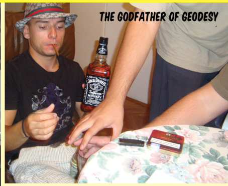
THE GODFATHER OF GEODESY