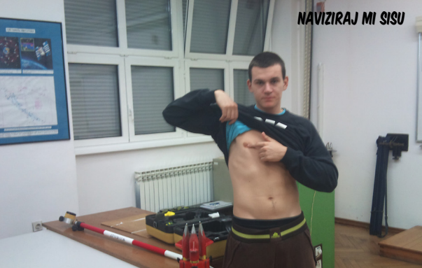
NAVIZIRAJ MI SISU