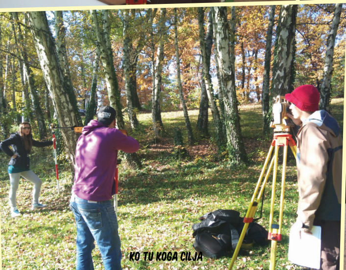
KO TU KOGA CILJA