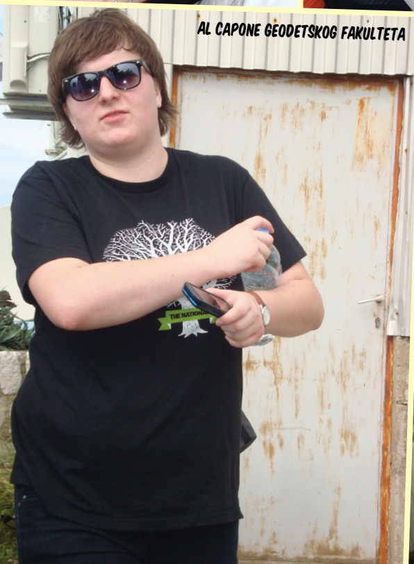
AL CAPONE GEODETSKOG FAKULTETA