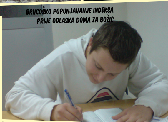
BRUČOŠKO POPUNJAVANJE INDEKSA PRIJE ODLASKA DOMA ZA BOŽIĆ