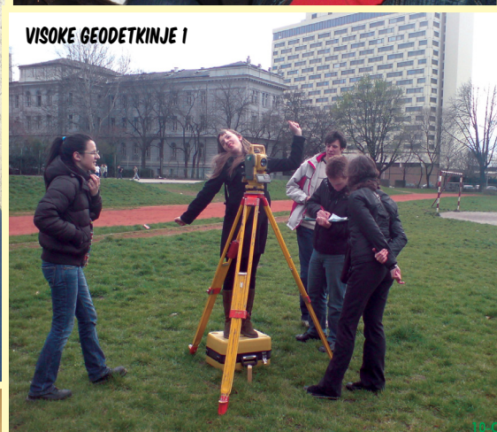
VISOKE GEODETKINJE 1