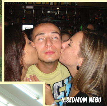
U SEDMOM NEBU