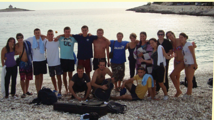
EKIPA NA HVARU