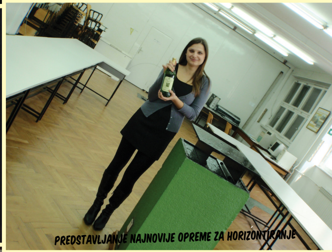
PREDSTAVLJANJE NAJNOVIJE OPREME ZA HORIZONTIRANJE