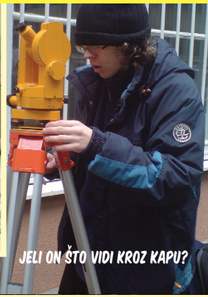
JELI ON ŠTO VIDI KROZ KAPU?