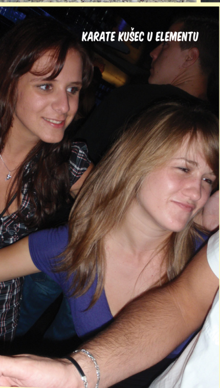
KARATE KUŠEC U ELEMENTU