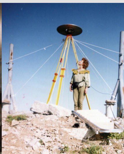
Plješivica 1994-1995., Asistentica BCD