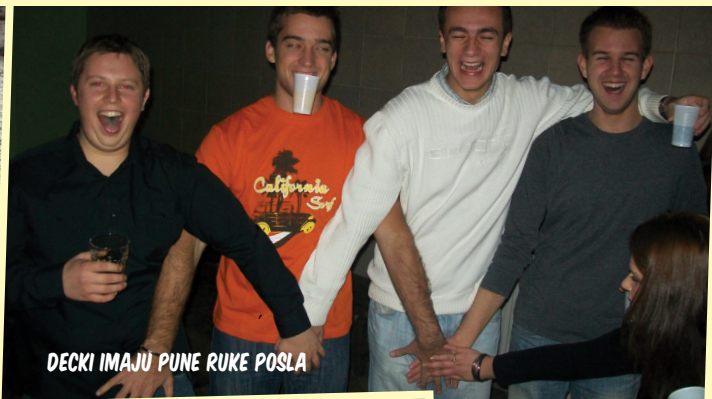
DECKI IMAJU PUNE RUKU POSLA