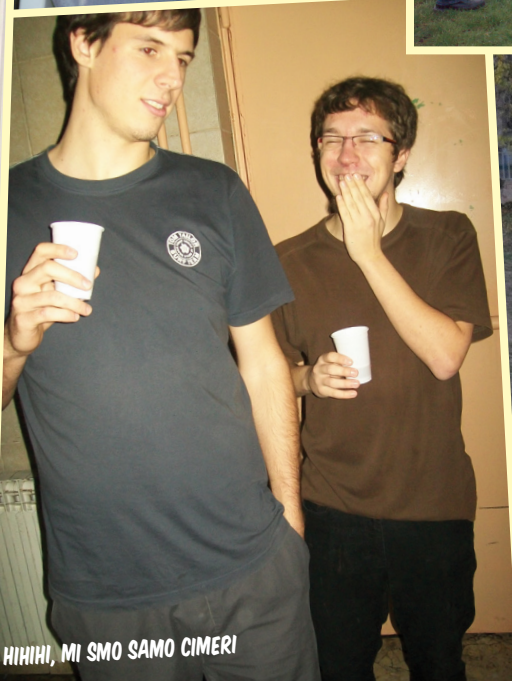
HIHIHI, MI SMO SAMO CIMERI