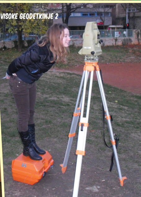
VISOKE GEODETKINJE 2