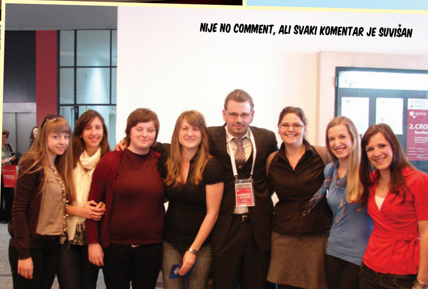
NIJE NO COMMENT, ALI SVAKI KOMENTAR JE SUVIŠAN