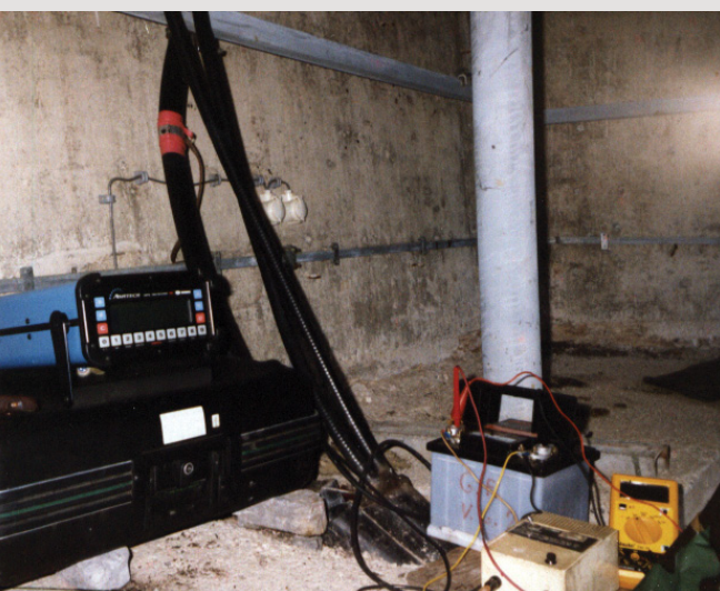
Plješivica 1994-1995., oprema Astech-1GPS