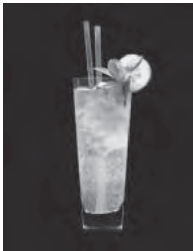
Slika 4. Primjer printa na vratnom krilu

naš ekološki sustav, tj. moramo dizajnirati proizvode koji od procesa proizvodnje i konzumacije do samog odlaganja što manje utječu na ravnotežu tog sustava! Održivi je dizajn inovativan: dizajn nije samo bolji proizvod, tehnološki usavršen i oblikovno poboljšan. Dizajn je stvaranje novih navika i načela uz pomoć novih proizvoda.