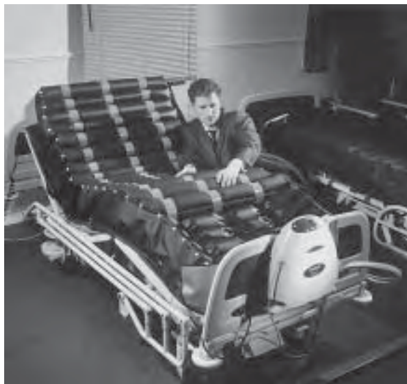
Slika 17. Bolnički krevet s ispunom od gela i ugrađenim senzorima

Stolovi, radni, blagovaonički ili klupski nude mnoštvo inovacija. Ponovno su u upotrebi podizni mehanizmi, preklonni mehanizmi i izvlačni mehaniz-