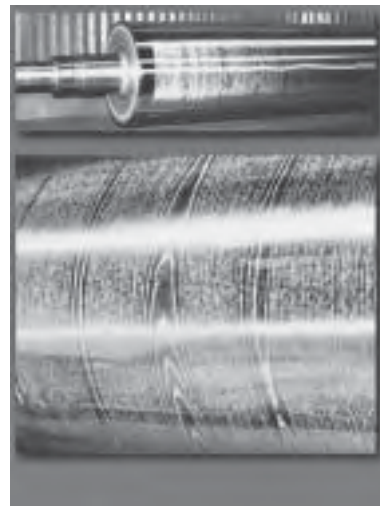
Slika 15. Primjer dekora i alata kojim je dekor izađen (SIBU)

tržištu, svi „paze“ na oblik prezentiranja svog uratka. Dizajneri su naporno radili i redizajnirali gotovo sve! Sve je dobilo nov oblik ili donijelo dodanu vrijednost i novu funkciju starom obliku. Prihvatnici, brave, stropni paneli, dekori za oblaganje ploča i inovacije u svim segmentima. Ističe se činjenica da je minula kriza sve proizvođače potaknula na razmišljanje i osmišljavanje novih proizvoda. Što je sve novo, teško je opisati riječima, to baš treba vidjeti.