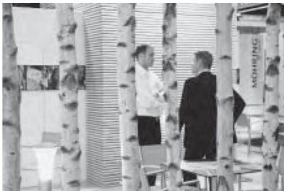
Slika 21. Priroda i interijer, kutak za okrepu

Prostori se povezuju u jedinstvene cjeline, nema jasno naznačenog prijelaza između, primjerice dnevnog boravka, blagovaonice i kuhinje. Kuhinje su samim time postale prošireni prostor i stilski poveznica s ostalim prostorima. Minimalizam u oblikovanju doveo je do još jačeg naglaska na materijalima i njihovim kombinacijama.