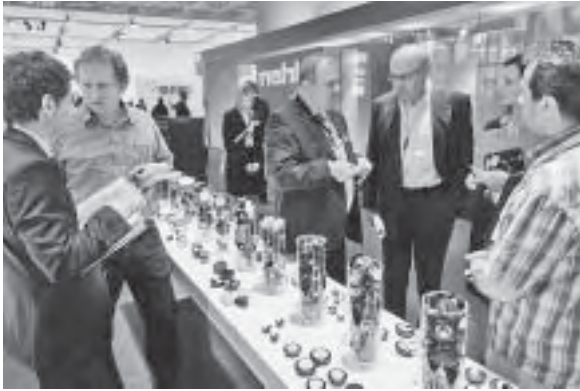
Slika 12. Presentacija kotačića za uredski namješta

po kući otvarate i zatvarate vrata i ladice, podižete i spuštate krevet, stol, stolac, prilagođujete rasvjetu. Netko od izlagača u službenom se priopćenju i našalio primjetivši da "jedini problem u svemu tome nastaje ako vam netko hakira sustav".