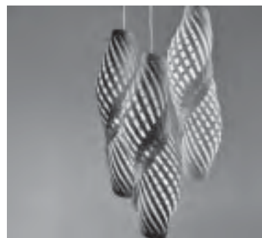
Slika 16. Rasvjetna tijela od savitljivog furnira