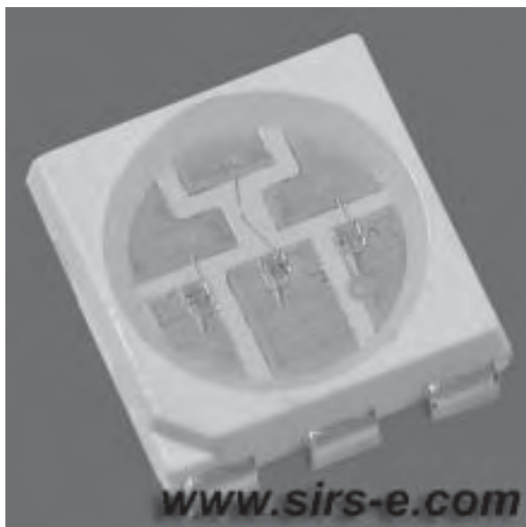
Slika 10. RGB LED dioda bez leće, tzv. modul

Pitanje kako rasvjetno tijelo uklopiti u interijer i proizvod tako da ono bude integralni dio cjeline ove je godine dobilo mnogo odgovora. Nanotehnologija u području LED rasvjete daje sve kvalitetnija rješenja, a rasvjetna tijela postaju sve manja. Uz činjenicu da se rasvjetna tijela smanjuju pojavljuje se paradoks da se njihova rasvjetna moć iz generacije u generaciju povećava. RGB LED (Red/crvena, Green/zelena, Blue/plava) tehnologija napravila je najveći iskorak. Sa samo nekoliko ampera dobiva se količina svjetla za koju se prije trošilo vrlo mnogo električne energije. LED to postiže diodama i lećama kroz koje svjetlost prolazi i tako se postiže velika disperzija. Dapače, ta disperzija vrlo jednostavno može biti kontrolirana malim korekcijama medija kroz koji svjetlost prolazi.