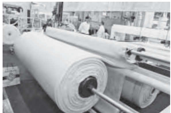
Slika 11. Stroj u procesu proizvodnje navlaka za madrace

Adhezivi predstavljeni na Intezumu 2011 ozbiljno počinju konkurirati spojnim tehnologijama koje se koriste šivanjem. Čak je i nekoliko tvrtki koje se tradicionalno bave strojevima za šivanje počelo razvijati tehnologije spajanja bez vlakana. Adhezivi bazirani na vodenim disperzijama spajaju bez vidljivih šavova. Industrija u tome vidi potpuno novi smjer razvoja, posebice nove dizajnerske mogućnosti.