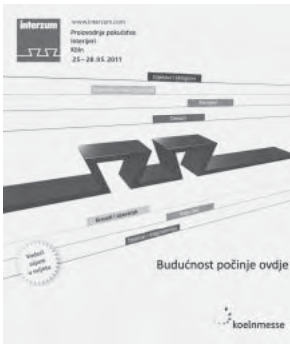
Slika 1. Plakat Interzum 2011

Vizualno lagan dizajn, aplikacije za pokućstvo i dizajn interijera, mogućnosti izravne aplikacije tiska