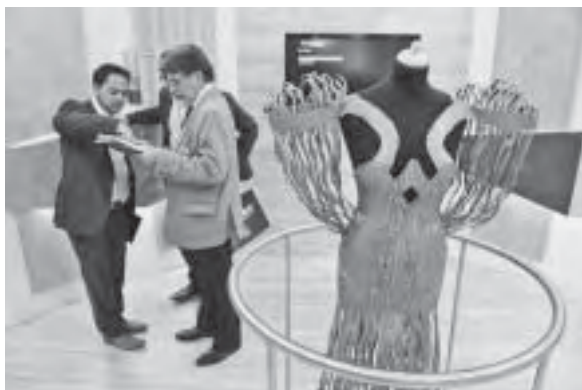
Slika 7. Presentacija dekora za ojašćenje kao odjevnog modela

Iz priloženoga možemo vidjeti da valja ponoviti dobre stvari i da kvaliteta ostaje glavno obilježje trenda. Neki proizvodi i tehnologije opstaju na tržištu više