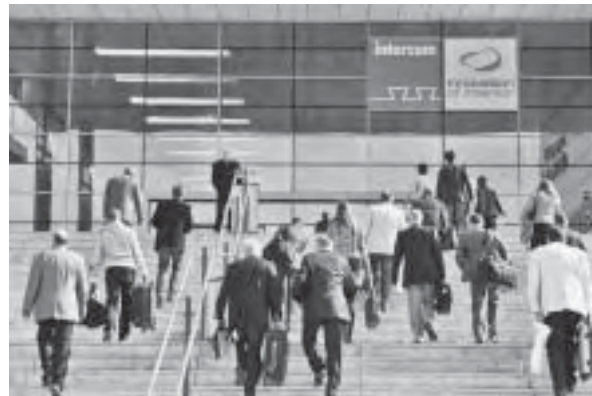
Slika 2. Interzum 2011, glavni ulaz

na elemente pokućstva, funkcionalne inovacije u okovima i spojnoj tehnici, tekstil i novi načini obrade kože, strojevi za obradu... samo su neki od mnogih tema koje je obuhvatio ovogodišnji Interzum.