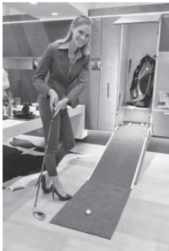
Slika 20. Häfele inovacije

Uz glavno pravilo tvrtke - funkcionalnost s potpisom Häfele, predstavljene su brojne nove ideje. Kuhinja i dnevna soba mogu postati jedno. Dnevna se soba kada ogladnite pretvara u kuhinju, a kuhinja, kada vam se pri- spava u dnevnu sobu. Drugi razlog toga višenamjenskog