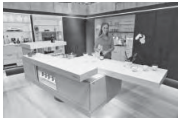
Slika 19. Primjer kliznih mehanizama za radne plohe

mi. Stol se može iz klupskog stolića preoblikovati u radnu površinu, i obrnuto. Višenamjensko svojstvo ključna je odrednica prilikom opisivanja dostignuća na tom području!