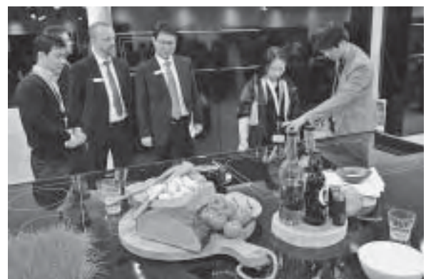
Slika 8. Hettich, trendovi u opremanju kuhinja