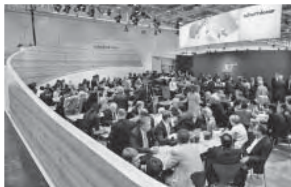
Slika 3. Interzum 2011, konferencijska sala