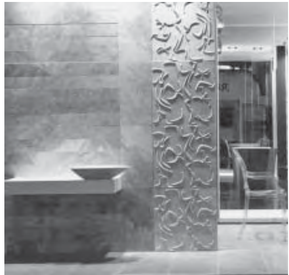
Slika 14. RE-Y-STONE® dekorativne obloge

tržištu, svi „paze“ na oblik prezentiranja svog uratka. Dizajneri su naporno radili i redizajnirali gotovo sve! Sve je dobilo nov oblik ili donijelo dodanu vrijednost i novu funkciju starom obliku. Prihvatnici, brave, stropni paneli, dekori za oblaganje ploča i inovacije u svim segmentima. Ističe se činjenica da je minula kriza sve proizvođače potaknula na razmišljanje i osmišljavanje novih proizvoda. Što je sve novo, teško je opisati riječima, to baš treba vidjeti.