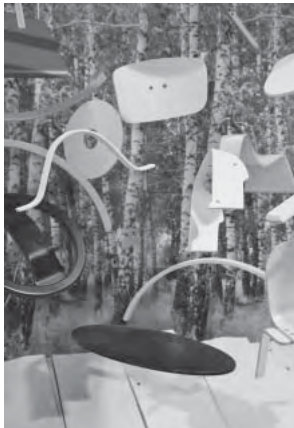
Slika 6. Termakointerzum 2011, štand