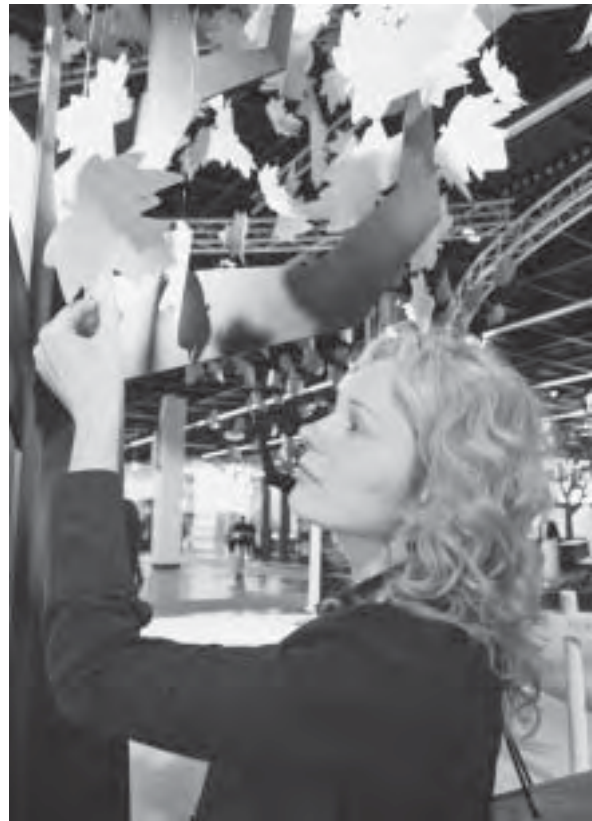
Slika 22. Izložbeni štand proizvođača furnira

U trendu su savitljivi furniri bez dodatne hidrotermičke obrade, 3D ploče, obloge od laminata koji oponaša doslovno sve prirodne površine, kao i furniri od vlakana banane, dekori od recikliranog papira. Može li to sve uistinu zamijeniti prirodne materijale u njihovu iskonskom obliku? Mogu li ti materijali imitirati onu energiju koju prenosi komad kamena obrađen u gazište stuba ili hrastov pod impregniran uljem prirodnog podrijetla? Je li sintetika dosegla tu razvojnu razinu da u sebi ne objedinjuje samo oblik i funkciju, već sa sobom donosi i dodatnu vrijednost u smislu poboljšanja kvalitete življenja?