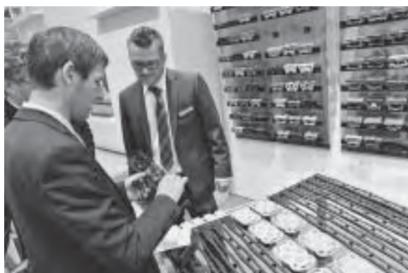
Slika 18. Gumeni ležajevi za izradu podnica kreveta