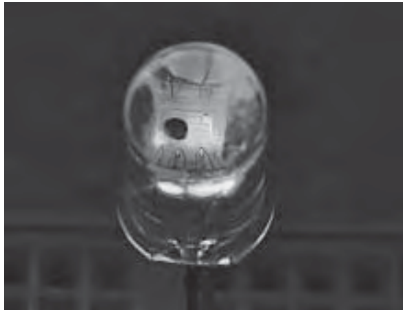
Slika 9. RGB LED dioda s lećom

Rasvjeta i rasvjetna tehnologija prešla je dug put od žarulje do LED diode.