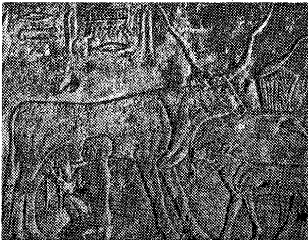
Kasnije se krava daje u prisutnosti teleta i musti

Narodi antike cijene mlijeko ne samo kao hranu, već i kao lijek. Hipokrat preporuča mlijeko kod uloga i tuberkuloze.