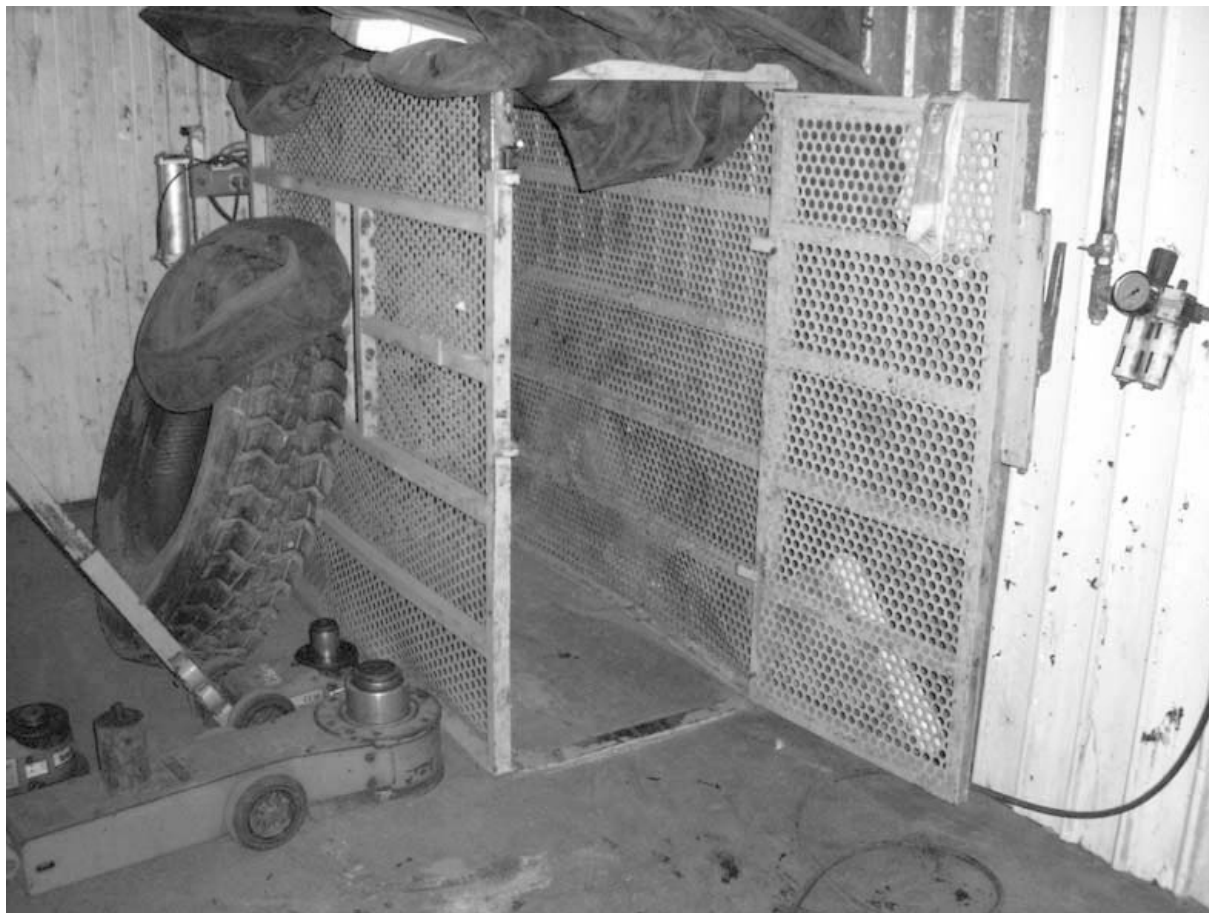
Slika 1. Zaštitni kavez