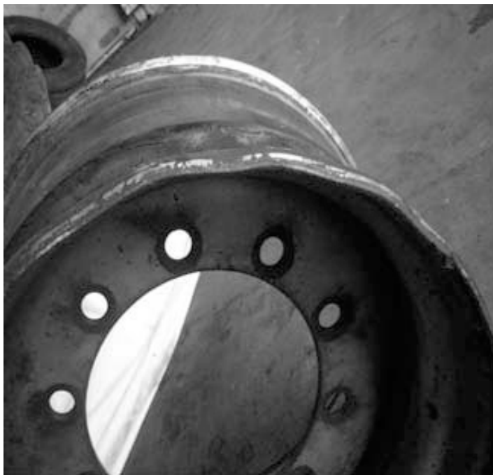
Slika 3. Oštećeni naplatak