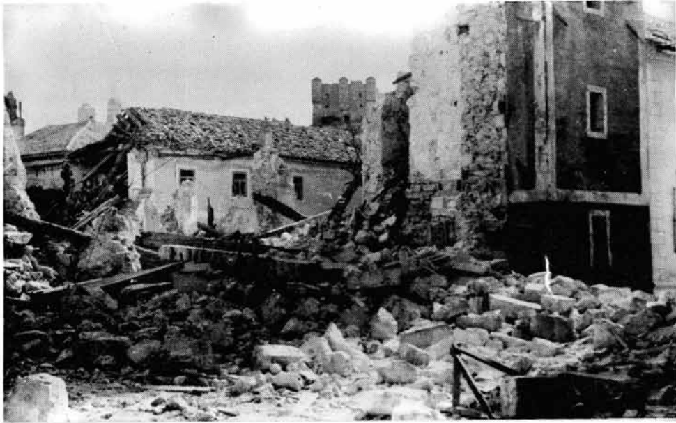
Sl. 2. Ruševine crkve i samostana sv. Franje nakon bombardiranja 1943.

Mečarića 11 i tko zna kojih drugih razgrađenih objekata koji su bili izvan zidina. Moguće je da čitav materijal potječe samo od crkve sv. Franje, stare zadužbine knezova Frankopana, izgrađene 1297. Neki misle da iz te crkve potječe i ona poznata kamena greda, 12 reljef Isusa sa šest svetaca koji predstavlja najvredniji romaničko-gotički reljef staroga Senja. Za toranj crkve neki misle da je izgrađen naknadno, jer je sagrađen od običnog kamena lomljenca, među kojima ima i fino tesanih kamenih blokova od kojih je izgrađena crkva. U prvo doba toranj