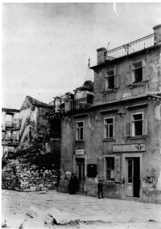
Sl. 1. Ruševine kuća u Ulici P. Preradovića, desno zgrada "Uskok" (ex crkva sv. Ivana Krstitelja). Snimio s prostora porušene crkve sv. Franje senjski fotograf I. Stella oko 1946.

spomeničke i kulturne vrijednosti. Nakon kapitulacije Italije, u rujnu 1943. Senj i širu okolicu zaposjele su partizanske postrojbe, koje su se na taj način domogle toliko potrebnih i velikih količina raznovrsne ratne opreme, odjeće i hrane. U to doba u sidrištu u senjskoj luci, na utovaru ili istovaru ratnog materijala ili opreme, nalazio se veći broj brodova. Da bi se uništio taj ratni potencijal, 7. i 8. listopada 1943. njemačko zrakoplovstvo u više navrata bombardiralo je Senj i neke manje obližnje luke. Precizno su pogodeni neki brodovi partizanske mornarice, ali su još više stradali mnogi crkveni i svjetovni stambeni i gospodarski objekti, a među njima i mnogi koji su imali spomeničku vrijednost. Tako su nestali ili teško oštećeni čitavi povijesni prostori, slikoviti senjski trgovi, ulice i objekti: Široka kuntrada, Zgon, Gorica, crkva sv. Franje,