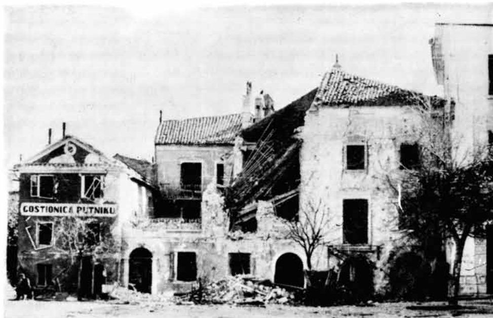
Sl. 6. Ruševine kuća Krišković i Hreljanović, te gostionica "Putnik" (danas Hotel "Nehaj") na obali. Snimio I. Stella godine 1946.

vrata (Trg Mirka Ožegovića) između kuća br. 14 i 16 pružala se duga uska ulica, koja je nekim adaptacijama i podizanjem balatura izgubila komunikacijsku namjenu. Sudeći prema prozorima, portalu, podrumu i demontiranim monoforama, kuću datiramo u 15./16. stoljeće, uz vjerojatnost da je oko 1668. doživjela neke pregradnje.