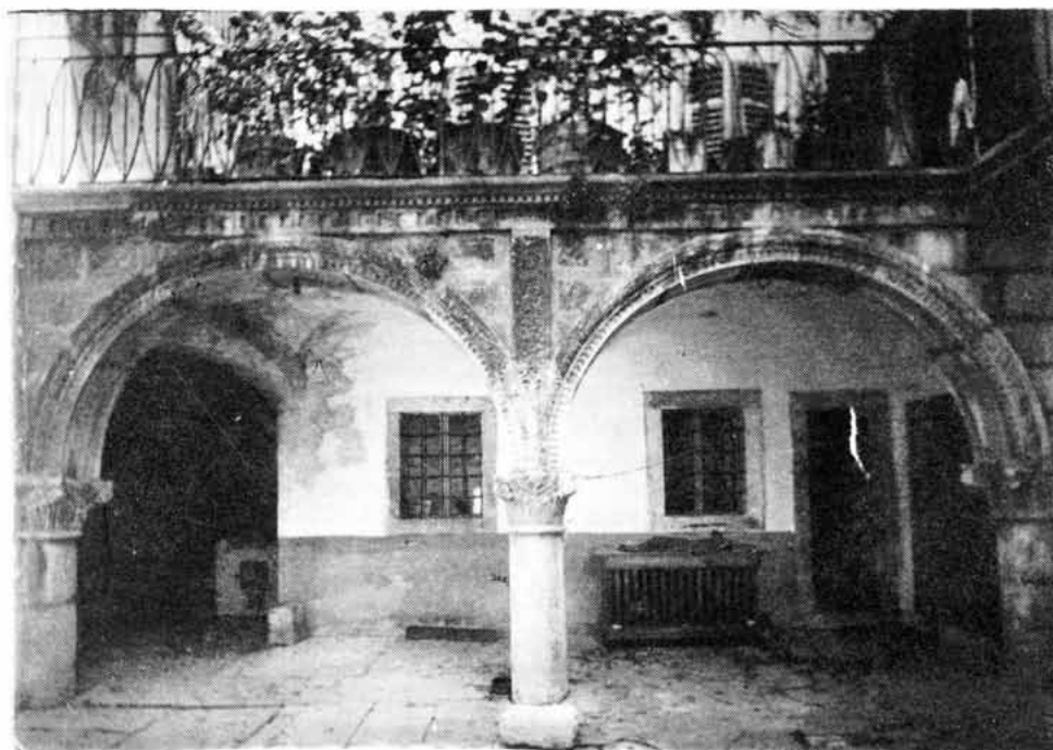
Sl. 3. "Lavlje dvorište"- izvornost i sklad renesansne senjske arhitekture sredine 15. st. Foto prof. Gj. Szabo 1940.

Malo po strani dvorišta je veliko monolitno grlo cisterne s grbom vjerojatno spomenutog nadvojvode. Na nesreću, nedavno je prizemlje kuće uređeno za potrebe privatne ugostiteljske radnje, pa je tom prilikom u cijelosti izgubljena njezina visoka umjetnička vrijednost i značenje spomenika kulture iznimne vrijednosti, koji se ubrajao među nekoliko ljepših renesansnih dvorišta na našoj obali. 13 Uokolo dvorišta na konzolama počivaju velike kamene ploče terase, paralelno u visini prvog kata, uz nju prema dvorištu stoji stara željezna ograda, velike umjetničke vrijednosti, moguće djelo nekog vrsnog ali anonimnog senjskog kovača. Po tim kamenim lavljim konzolama prozvana je zgrada - kuća s lavljim dvorištem. Kakvo je bilo lice kuće s gornje sjeverne strane do Preradovićeve ulice, ne znamo. Isto tako ne znamo kakva je bila na bočnim stranama bez obzira na to što su uz nju priložene druge dvije kuće. Sa četvrte,