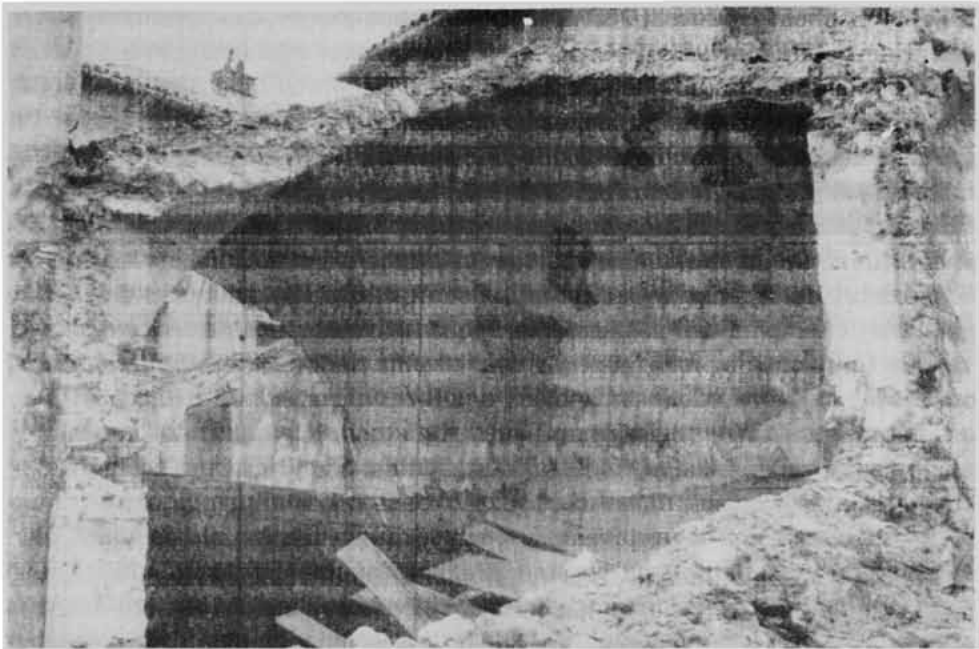
Sl. 5. Urušeno krovšte crkve sv. Marije Magdalene (Vlatkovićeve ulica) nakon bombardiranja godine 1943.

monofore ili pak vrata balkona, koja su uklonjena u vrijeme neke adaptacije. Taj otvor neke starije monofore zazidan je kamenom i opekom i danas predočuje osnovni bočni ugao kuće. Iznad otvora opaža se zasvođenje iz opeke, prvotni nadvoj, ali on krije mogućnost uklanjanja kompletne manje monofore, odnosno nekoga starijeg prozora na drugom katu. Ispod velikoga zazidanog otvora, okomice ugla kuće, mogu se vidjeti ostaci još jednoga luka od opeke koji je mogao zatvarati neki slični veliki prozor prvog kata. Iznad današnjeg ulaza u kuću nalaze se dva pravokutna prozora iznad prvog kata, lijevo je običan prozor, a uz njega velika trifora, okružena kamenim okvirom, nazubljenim dijamantnim rezom. Oko trifore zida plohe su ozidane opekom. Čini mi se da su se u visini prvog kata mogle vidjeti veće površine zida izgrađene od kvadara dobivenih pri obradi sedre koja se za ovu prigodu i za neke druge senjske građevine sa svodovima vadila u koritu Gacke kod Klanca, Brloga. Prema tim otkrivenim ali neistraženim detaljima lukova prvog i drugog kata moguće je da bi stariji dio kuće mogao koincidirati s izgradnjom lođe u vrijeme 13./14. stoljeća. Svakako da se oko 1463. u Senju dešavaju velike graditeljske promjene uzrokovane odlaskom knezova Frankopana iz Senja. Turci su pred gradskim zidinama