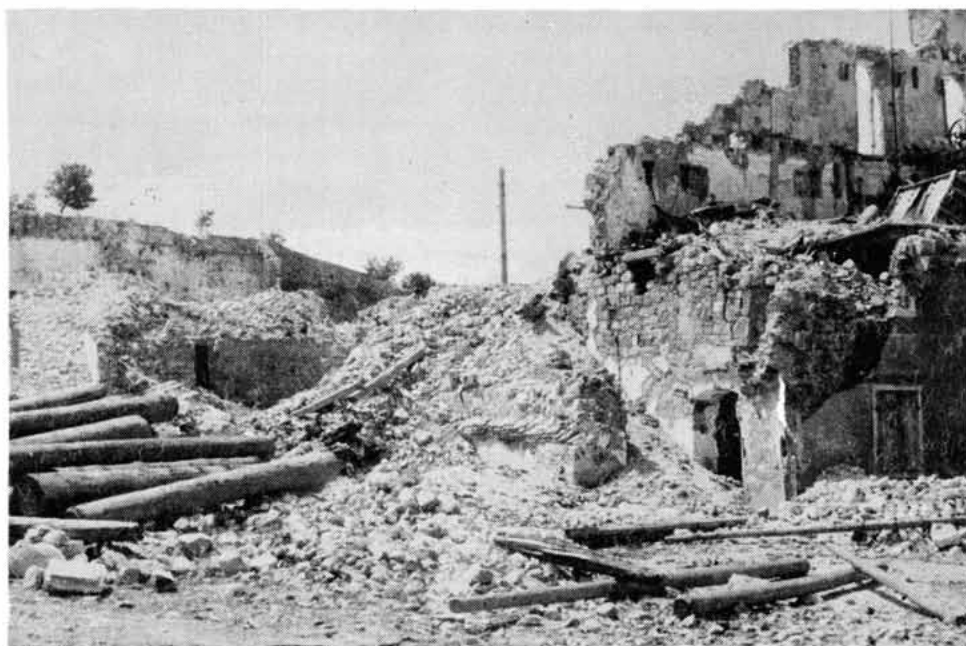
Sl. 7. Ruševine senjskih magazina i gradskih fortifikacija nakon bombardiranja godine 1943. Snimio I. Stella godine 1946.

običnog kamena, ali pomiješanog s finim tesancima, osobito na uglovima kula. On potječe s nekih razgrađenih objekata izvan zidina. Vjerojatno je učinkovitija obrana od Turaka bila razlogom da je senjski kapetan Ivan Lenković izvršio potrebne sanacije Kaštela. Stari ulaz u Kaštel vodi s trga kroz prva i druga vrata prizemlja. Na žalost, pri uređenju Kaštela 1896. godine stari ulaz zaklonjen je stepenicama koje su vodile u zgradu kroz novi ulaz na prvi i drugi kat. G. 1945. kaštel se koristi za potrebe gimnazije, ali i kao dom učenika, i tada započinje njegova devastacija i propadanje. Na žalost, svi oni koji su rabili Kaštel za različite namjene i od njega ubirali određene koristi, nisu adekvatno ulagali u njegovo održavanje, pa je ljudskim nemarom doveden u ruševno, žalosno stanje. Usljed zapuštenosti s fasada otpada žbuka i ukazuju se stari zidovi, poneki otvor i pojedine etape izgradnje. Među tim nalazima zanimljivo je otkriće starih vrata s puškarnicama s jedne i druge strane glavnog ulaza. Sve je ozidano lijepim tesanim kamenim blokovima. Stoga držimo da bi se kod obnove Kaštela osobita pozornost trebala posvetiti ovim detaljima, osobito ako bi se uklonile neprimjerne stepenice i ograda i restaurirao sam ulaz. Iz rečenog se može zaključiti da je senjski Kaštel sagrađen 1340. godine, ali da je u osnovi stariji, te