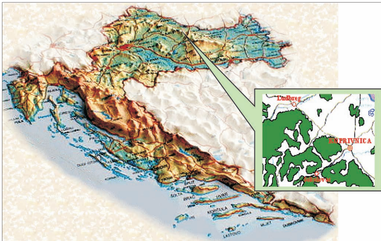
Slika 1. Zemljopisni položaj testova potomstva Figure 1 Geographical position of progeny tests

šuma Koprivnica (Slika 1.), Šumarije Sokolovac, predio Zabrdica, (Slika 2.) i Kloštar Podravski predio Kozare-