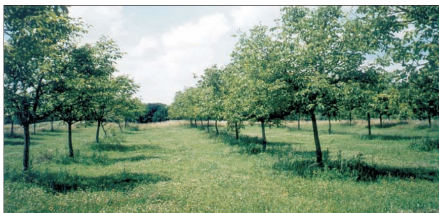
Slika 2. Test potomstva običnog oraha u Zabrdici Figure 2 Progeny test of Common Walnut in Zabrdica

vac I, (Slika 3.). Na površini od po 3,5 ha sa 400 sadnica, generativnog porijekla, po blok-metodi u četiri ponavljanja. Sadnice potječu od 18 potomstava domaćih selekcija, s razmakom sadnje 8 x 8 m, starost sadnica 1 + 1 godina Mrva (1984) i Mrva i Littvay (1988). Obični orah je vrsta koja ima velike zahtjeve na tlo, klimatske prilike, osjetljiv je na mrazeve, što u znatnoj mjeri ograničava njegovo unošenje na šira područja. Ova spoznaja daje nam dilemu u kojem smjeru voditi selekci-