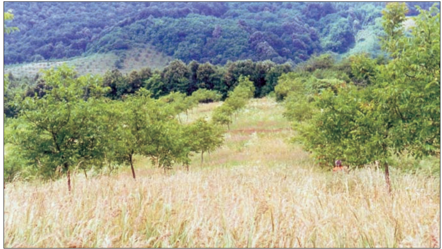
Slika 3. Test potomstva običnog oraha u Kozarevcu I Figure 3 Progeny test of common walnut in Kozarevac I

Tlo je na ovim lokacijama pedološki ispitano s obzirom na fizikalno-kemijska i biljno-hranidbena svojstva. Na temelju provedenih analiza izvršeni su agrotehnički zahvati, kao što su: duboko oranje, gnojidba stajskim i mineralnim (NPK) gnojivom, te iskopavanje jama 1 x 0,8 m.