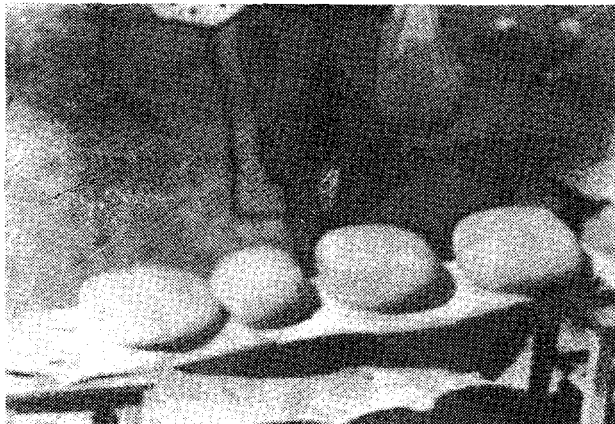
Sl. 1 — Sprava za bijenje, cjedilo sa sirom i oblik sira nakon cijedenja

stupa se »bijenju« gruša (otuda se i zove bijeni sir). Ovo razbijanje i sitnjenje gruša izvodi se drvenom spravom (sl. 1) koja na kraju ima okruglo-ovalnu dasku s rupama. Izvodi se toliko udara i razbijanje podsirevine (nešto kao bućkanje), da ista dobije konzistenciju jogurta. Poslije toga se u posudu dodaje provrela vruća voda, stalno miješajući pri tome sirninu. Posuda se prekriva platnom i sirnina ostavlja da se taloži (ovo traje oko pola sata). Neki proizvođači umjesto da dodaju vruću vodu, masu slabo zagriju, ako podsiruju u kotlu