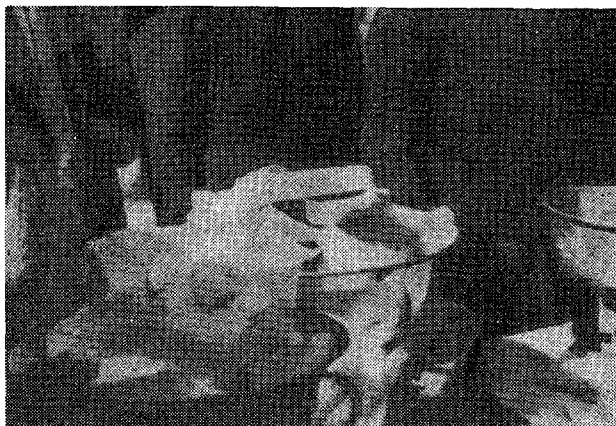
Sl. 4 — Prodaja bijenog sira na tržnici

Od sirutke što ostaje poslije cijedenja, dobiva se urda, neki je pak proizvođači skupljaju 2—3 dana, dodaju joj mlijeka, bučkaju i tako dobivaju maslo i osvježavajući napitak »matenica«.