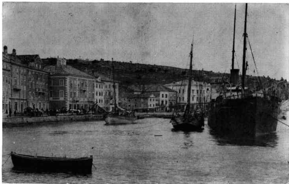
Senjska luka oko godine 1925.