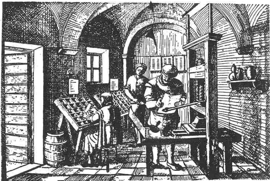
Sl. 2. Unutrašnjost senjske glagoljske tiskare prema zamisli prof. Mate Grgića

odgovoriti na dva značajna pitanja: što se razumijeva pod pojmom Senjske drage, i gdje je stajala opatija sv. Križa.