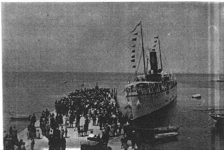
Sl. 2. Doček u Senju izletnika željezničarskog pripomoćnog Društva sv. Roka parobrodom Zagreb na Duhove 15. svibnja 1932.

onda zajedno s njima uz pjesmu i ples provesele, kod čega se obilno pilo i nazdravljalo. Izleti "Sv. Roka" imali su jasan hrvatski rodoljubni značaj. Bili su pravi odah za Zagrepčane i Senjane u tmurnoj atmosferi Aleksandrove diktature. Među izletnicima bilo je uvijek i zagrebačkih Senjana. Dinko Chudoba stavio bi se na raspolaganje izletnicima i u njegovoj drogeriji mogle su se dobiti sve potrebne informacije i rezervirati putne karte.