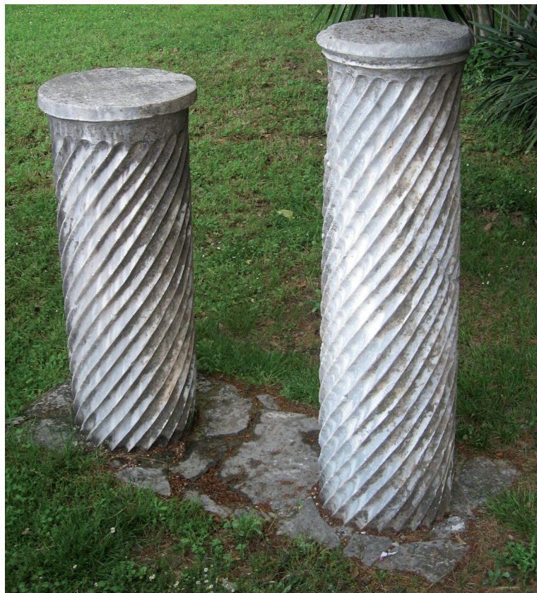
Sl. 1a. Ulomci stupa od prokoneškog mramora sa Čaira iz Stoca (362 x 40 cm) Fig. 1a. Fragments of a column of Proconnesian marble from Čaire at Stolac (362 x 40 cm).