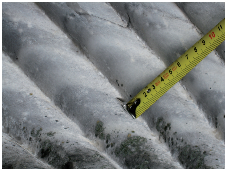
Sl. 1b. Detalj stupa od prokoneškog mramora sa Čaira iz Stoca (detalj) Fig. 1b. Detail of the column of Proconnesian marble from Čaire at Stolac.