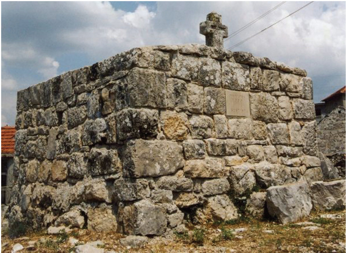
Sl. 7. Grobnica u Zelenikovcu. Fig. 7. Tomb in Zelenikovac.