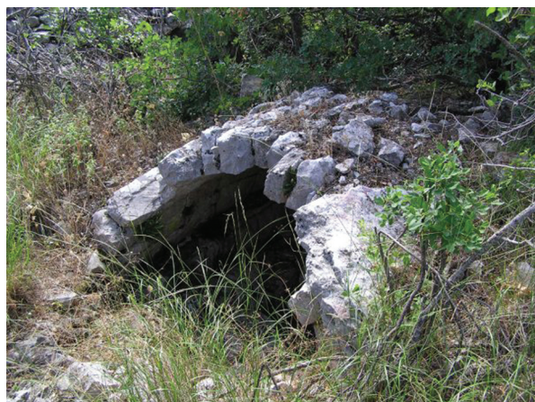
Sl. 3. Previš, grobnica na svod. Fig. 3. Previš, vaulted tomb.

U seoskom groblju u Previšu oko 18 km sjeveroistočno od Neuma (Sl. 13, 3) , neposredno uz kamenu gomilu, nalazi se neregistrirana grobnica na svod. Ulaz nije očuvan, a grobnica ima dva kamena ležaja s jarkom u sredini. Bačvasti svod grobnice bio je pokriven kamenim pločama na dvije vode. Vanjske dimenzije komore iznose: dužina 3,10 m, širina 2,62 m, a orijentacija groba je sjeverozapad – jugoistok. 8