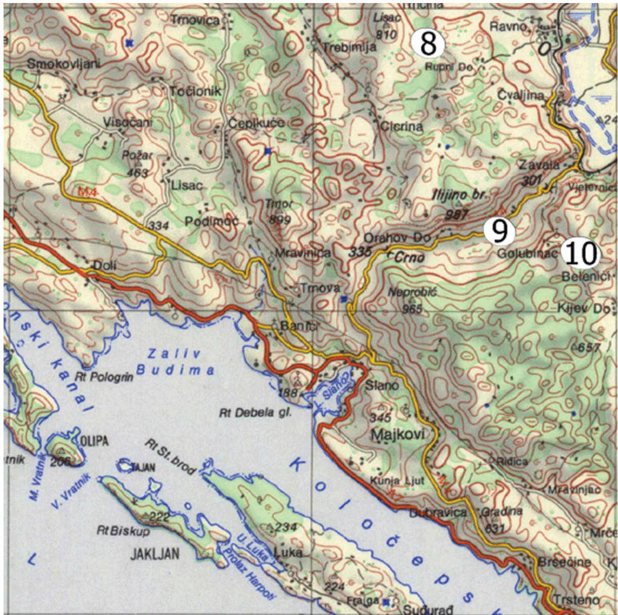
Sl. 14. Fig. 14.