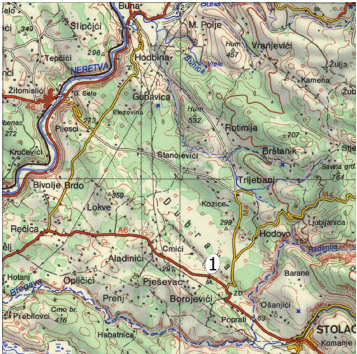
Sl. 12. Fig. 12.