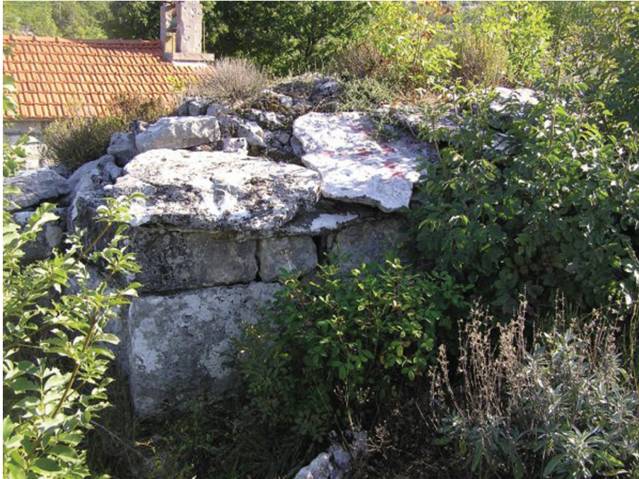
Sl. 10. Ružni Do, grobnica na svod. Fig. 10. Ružni Do, vaulted tomb.