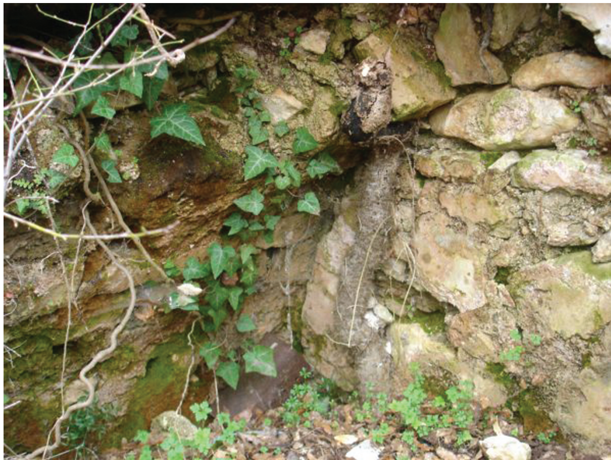
Sl. 1. Ostatci grobnice na svod na položaju Vlaka – Čemalovina (Rivine). Fig. 1. Remains of the vaulted tomb on Vlaka – Čemalovina (Rivine) site.

Do sada je u BiH registrirano oko 80 grobnica na svod, koje su vjerojatno bile obiteljske grobnice višeg društvenog sloja, možda vlasnika imanja na kojima su podignute crkve. Najčešće su prateći objekt ranokršćanskim crkvama, iako mogu biti i starije i mlađe od sakralnog prostora uz koji se nalaze. 2