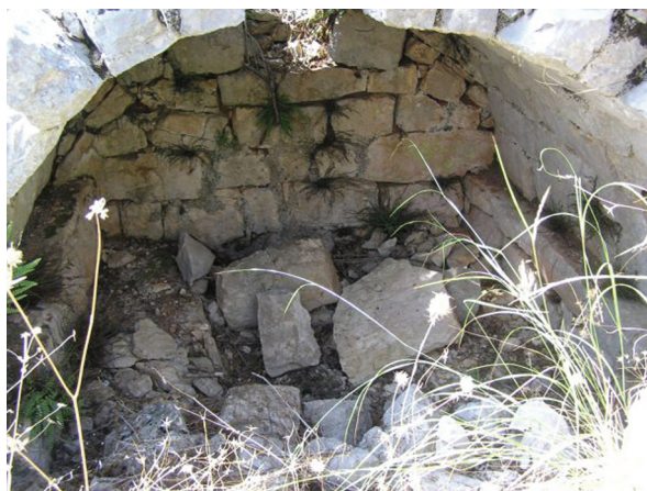
Sl. 4. Previš, grobnica na svod, unutrašnjost. Fig. 4. Previš, vaulted tomb, interior.