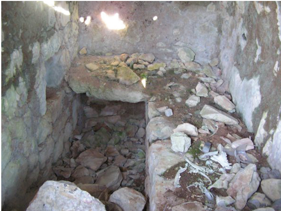
Sl. 9. Velja Međa, unutrašnjost grobnice na svod. Fig. 9. Velja Međa, vaulted tomb, interior.