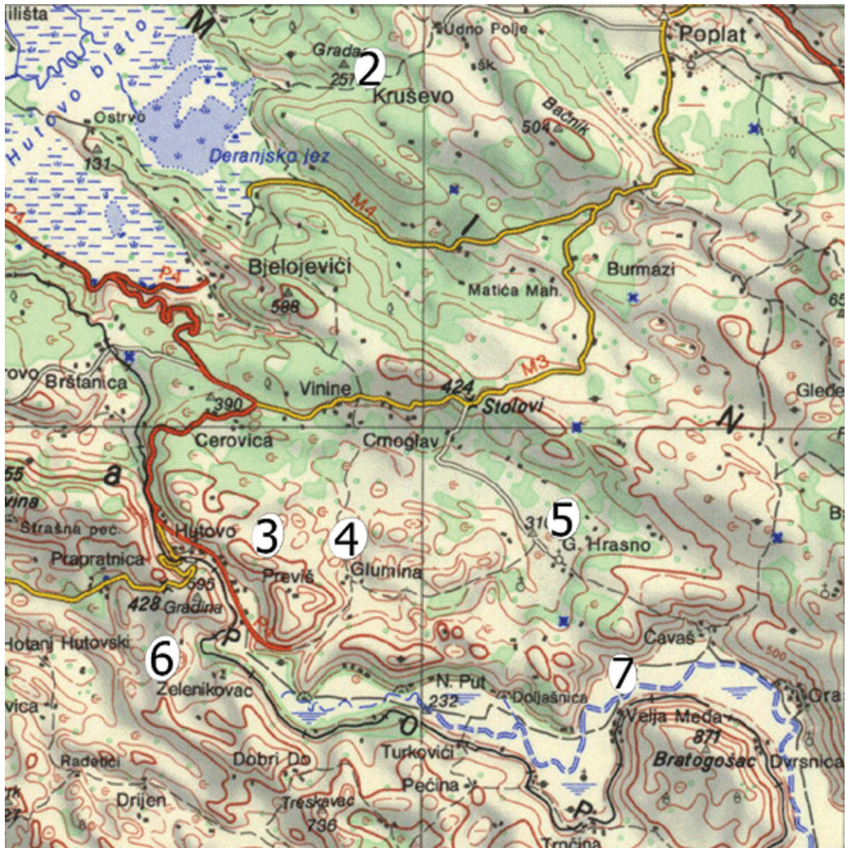
Sl. 13. Fig. 13.