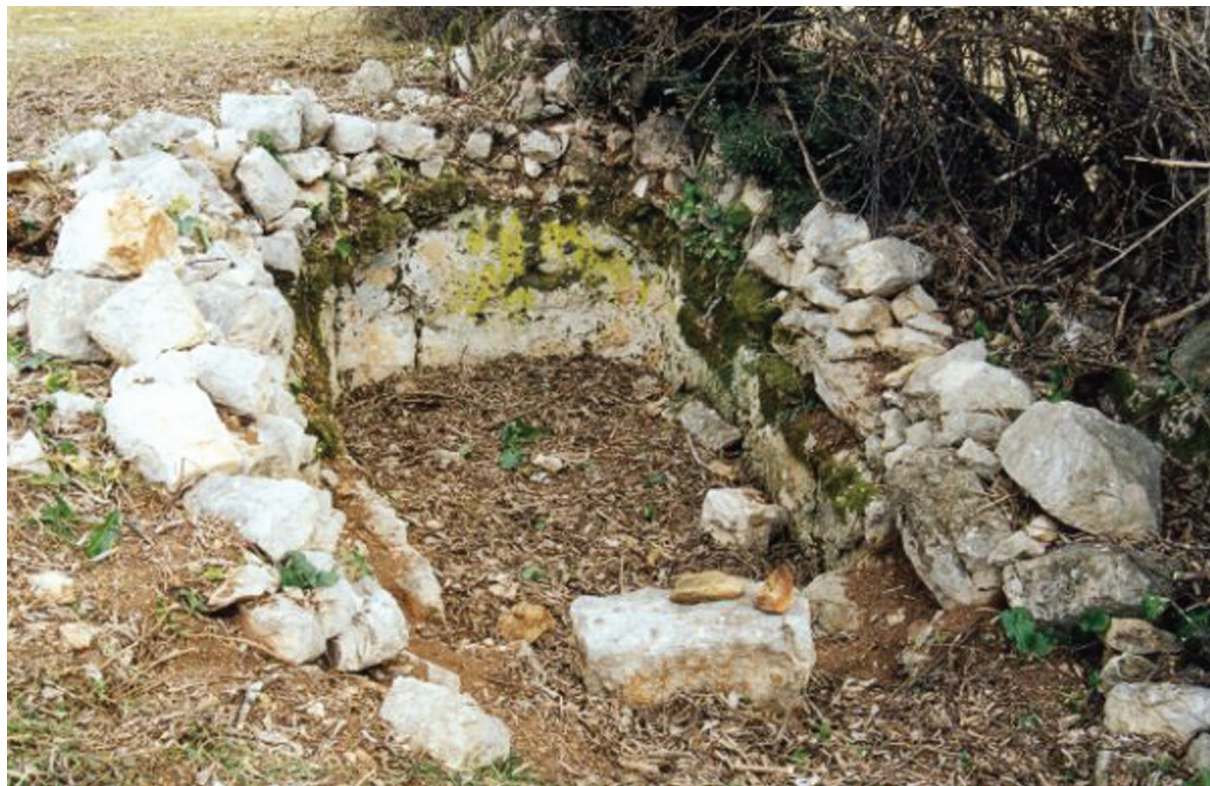
Sl. 2. Ostaci grobnice na svod u Kruševu kod Stoca.