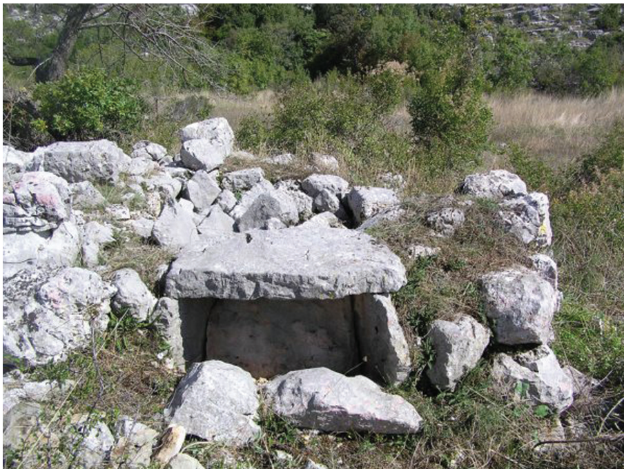
Sl. 11. Golubinac, grobnica na svod. Fig. 11. Golubinac, vaulted tomb.