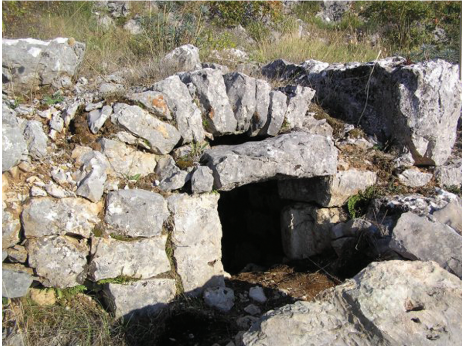
Sl. 8. Velja Međa, grobnica na svod. Fig. 8. Velja Međa, vaulted tomb.