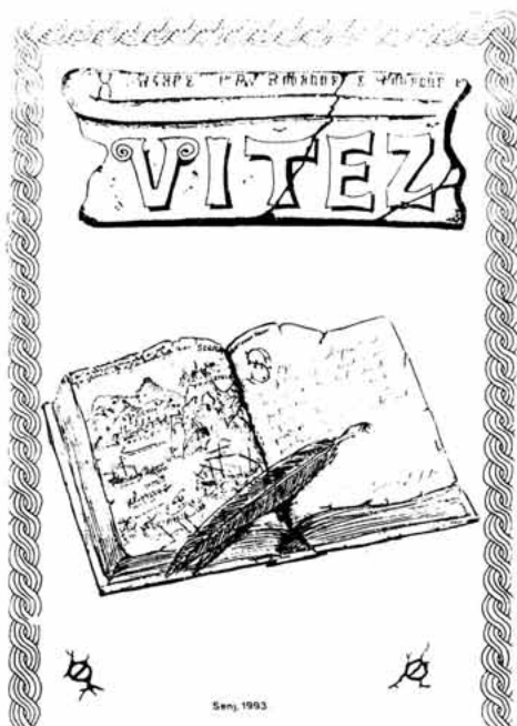
Naslovnica Viteza br. 2 iz godine 1993.

Na prvoj stranici svakog broja nalazi se ime lista, naziv ustanove koja ga izdaje, mjesto, školska godina (godina tiskanja) i broj, te u sredini, kao simbol škole i lista grb Pavla Rittera Vitezovića - štit na kojem je vitez - konjanik s isukanom sabljom, šesterokraka ili osmerokraka zvijezda i polumjesec. Iznad štita nalazi se srednjovjekovna viteška kaciga s perjanicom i krunom. Iz krune izlaze dva raširena ptičja (orlova) krila između kojih je ruka u viteškom oklopu sa sabljom i ponovno šesterokraka ili osmerokraka zvijezda.