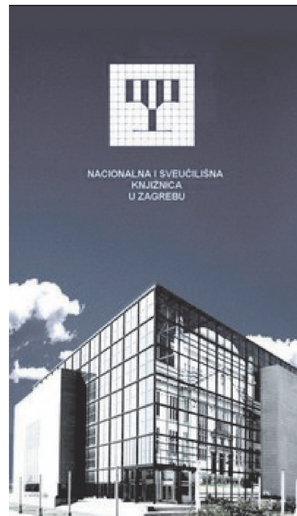
Slika 2 – Slika profila Nacionalne i sveučilišne knjižnice u Zagrebu na Facebooku