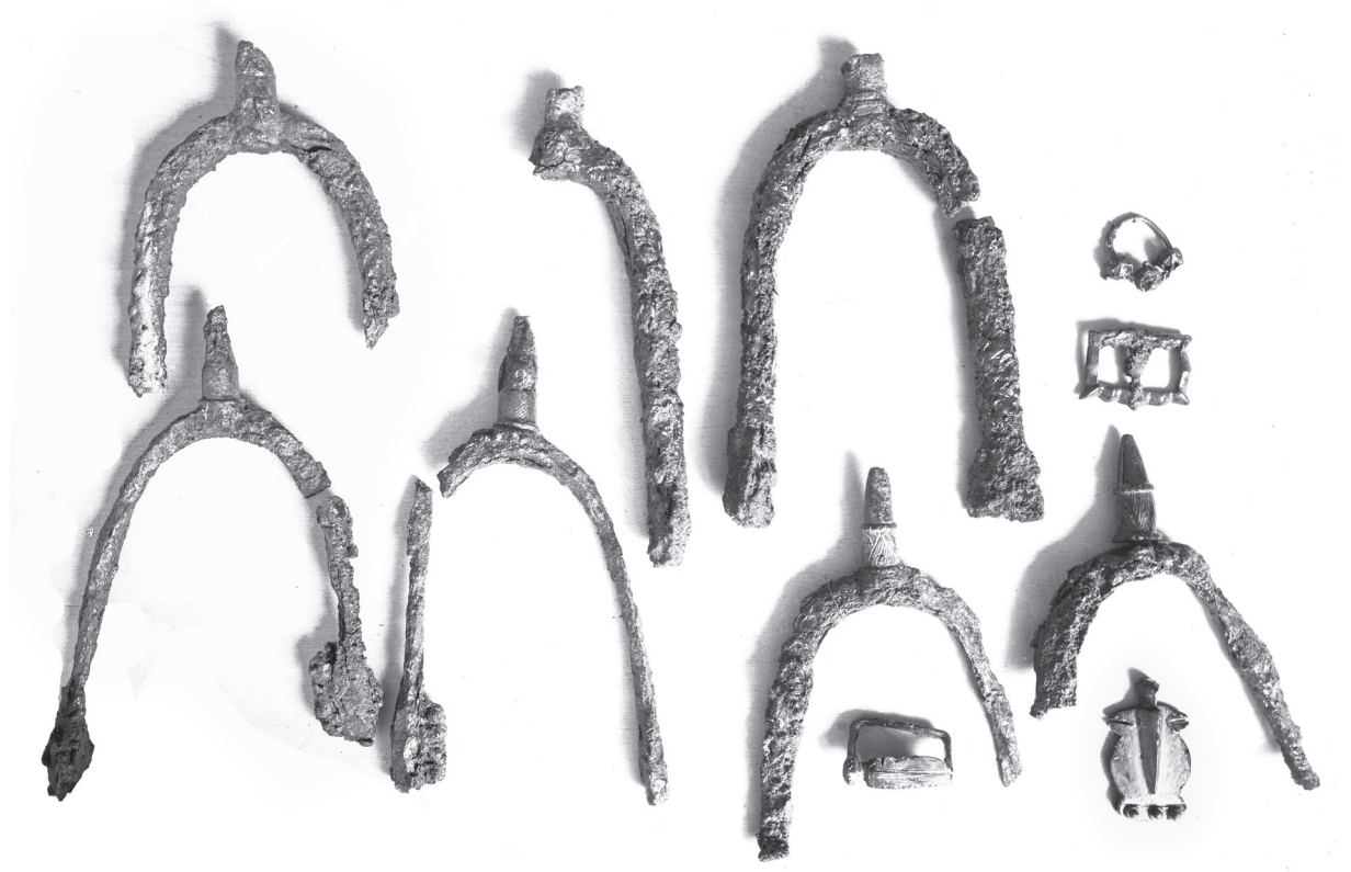
Sl. 1. Fig. 1.

karolinškim ostrugama u zatvorenoj grobnoj cjelini. Ta vijest u cijelosti je potvrdila sadržaj arhivske fotografije i osnažila Karamanovu argumentaciju. Bilo kakva daljnja domišljanja i pokušaji radikalnijeg mijenjanja kronologije nastanka trojagodne naušnice razvijenijih tehnoloških odlika, izgledali su, u tom trenutku, kao neozbiljan pokušaj i znanstveni promašaj. Osobito nakon što je u arhivu staklenih fotoploča 14 pronađena druga fotografija (Sl. 1) koja uz pet ostruga ima i sve predmete (osim manjih ulomaka) s Karamanove fotografije uključujući i trojagodnu naušnicu. Bila je to još jedna potvrda Karamanove kronološke teze o trojagodnim naušnicama kao proizvodima ranoga srednjeg vijeka.