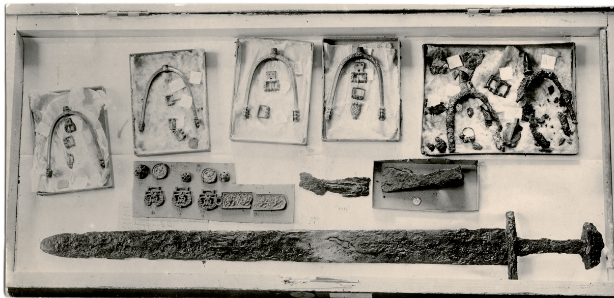
Sl. 2. Fig. 2.

Dakle, vlasnik zemljišta predao je Marunu željeznu sjekiru i trojagodnu srebrnu naušnicu koje nisu nađene u grobu s ostrugama, nego su raniji nalaz s istog zemljišta. 19 No, radi li se o istoj naušnici koja se nalazi uz karolinške ostruge? Odgovor je priskrbila prije spomenuta cjelovita fotografija iz koje je Karaman izvukao segment s karolinškim ostrugama. Poput okrugle pločice s datumom i mjestom nalaza na kraku ostruge, takva se pločica nalazi priložena i uz željeznu sjekiru u manjoj kutiji smještenoj tik do one s ostrugama. (Sl. 3). Na njoj je zapisano: Biskup. 21/2 08 .