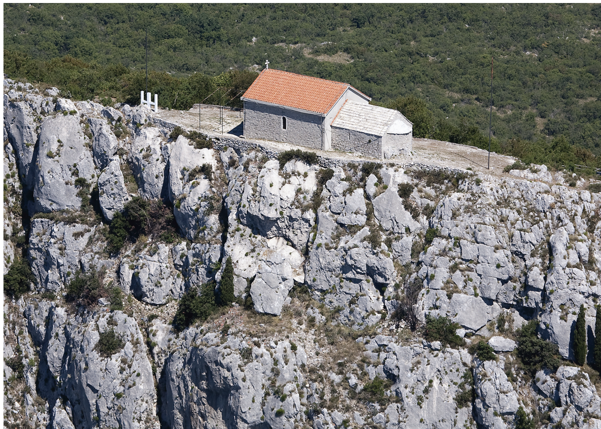
Sl. 1. Pogled na Biranj s juga i crkvu sv. Ivana Krstitelja nad liticama sred Krune.