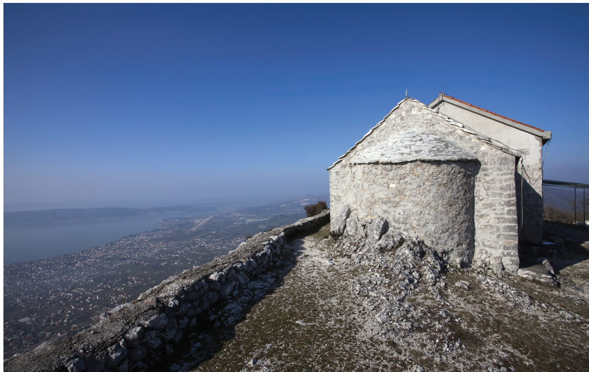
Sl. 2. Crkva sv. Ivana od Birnja sa začelja; u fokusu tri graditeljske faze (romanička, kasnogotička, novovjekovna.