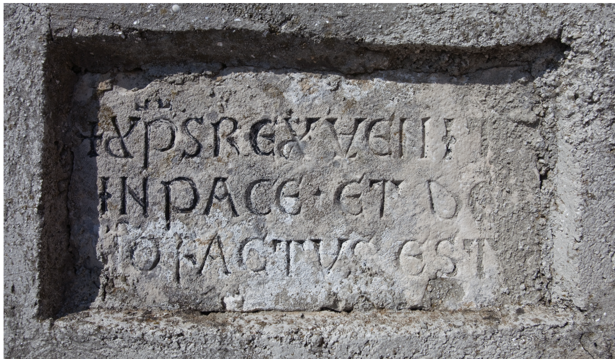
Sl. 6. Konsekracijski natpis izvorno na južnom pročelnom uglu kasnogotičke crkve, sada na južnoj strani začelnog zida novovjekovne nadogradnje.

Fig. 6. Consecratory inscription originally on the southern front corner of the late Gothic church, now on the southern side of the back wall of the modern period addition.