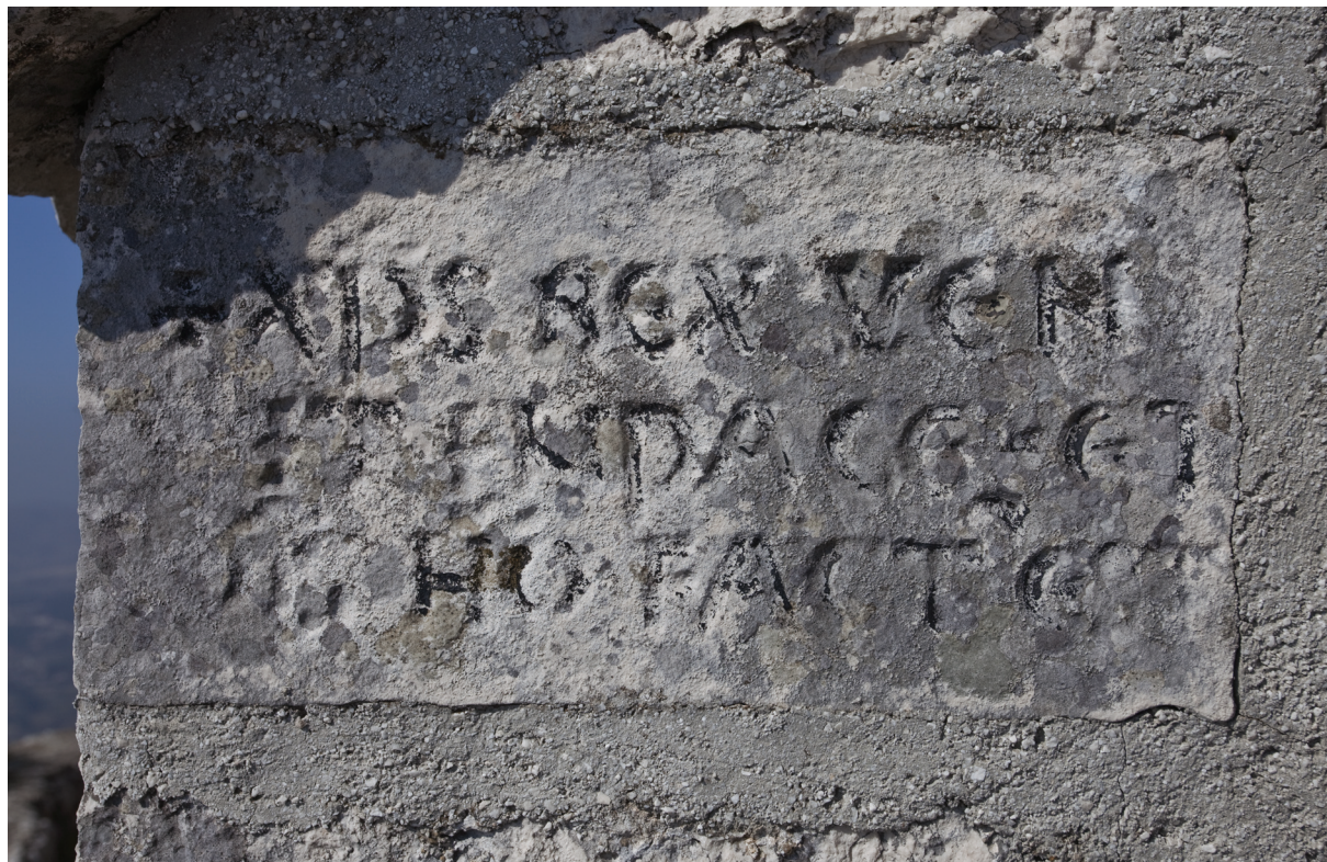
Sl. 4. Konsekracijski natpis na južnom začelnom uglu.