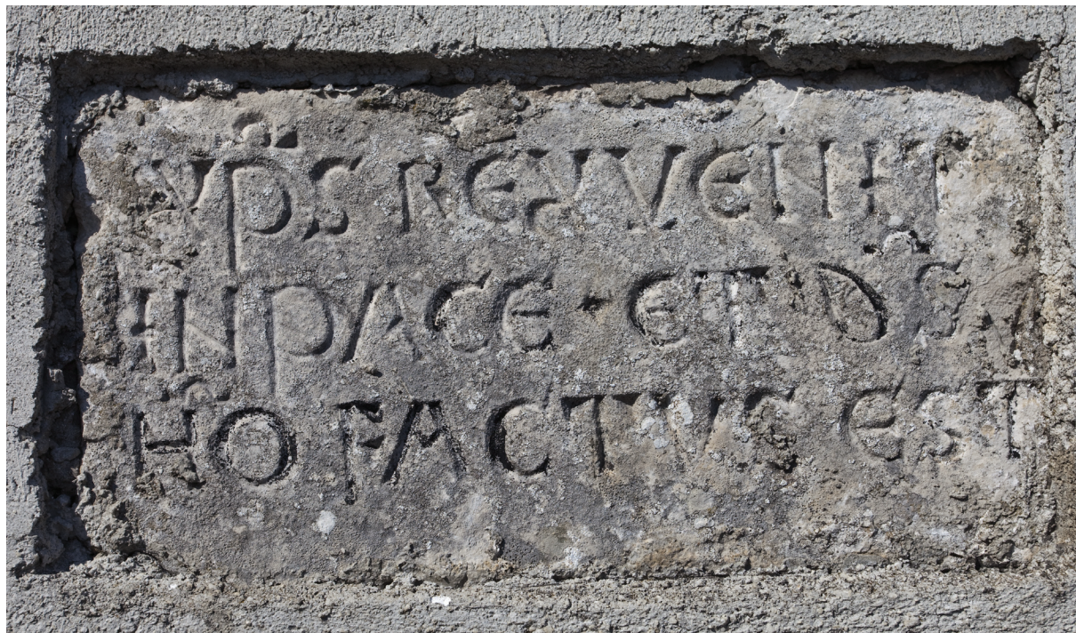
Sl. 7. Konsekracijski natpis izvorno na sjevernom pročelnom uglu kasnogotičke crkve, sada na sjevernoj strani začelnog zida novovjekovne nadogradnje.

Fig. 7. Consecratory inscription originally on the northern front corner of the late Gothic church, now on the northern side of the back wall of the modern period addition.