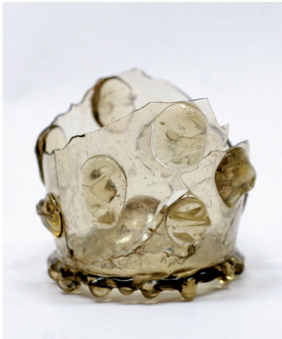
Sl. 9. Čaša tipa krautstrunk (Stari grad). Fig. 9. A krautstrunk beaker (Stari Grad).