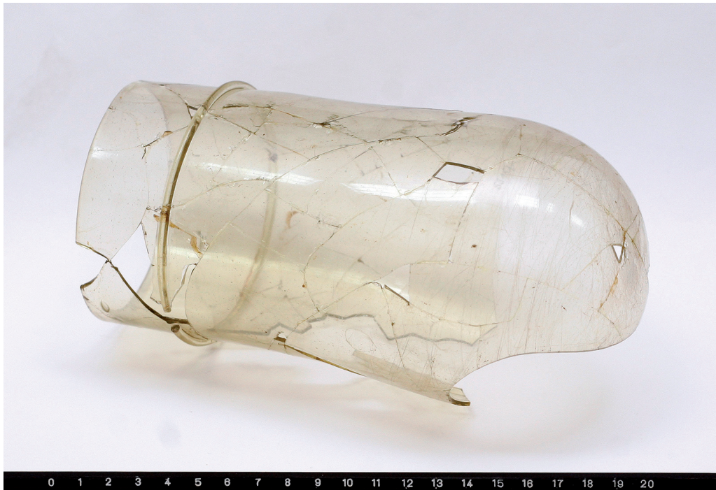
Sl. 13. Posuda (?) iz obrambenog jarka Staroga grada.

Fig. 13. A vessel (?) from the defensive ditch of Varaždin castle (Stari Grad).