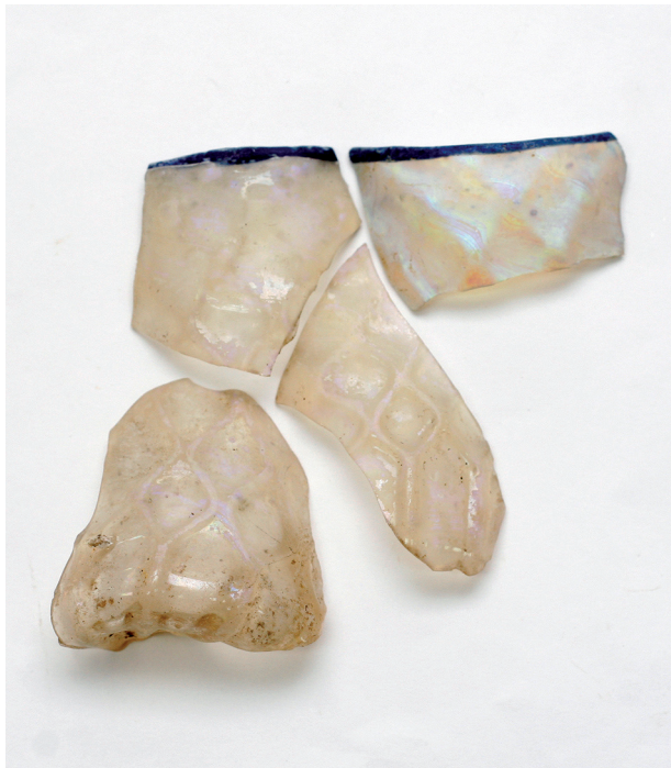
Sl. 7. Konusna čaša – optički puhano staklo. Fig. 7. A conical beaker – optical blown glass.