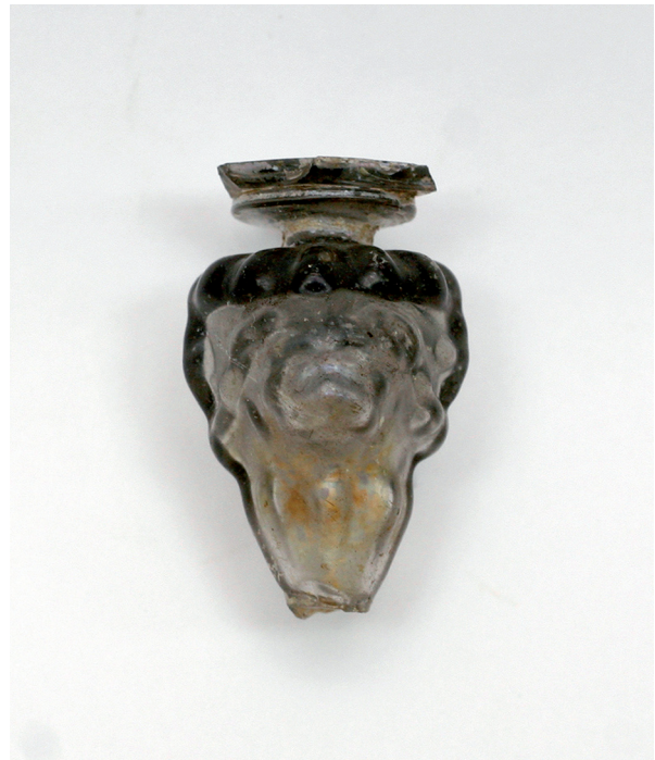
Sl. 10. Nodus s lavljim glavama (Stari grad). Fig. 10. A knob with lion heads (Stari Grad).