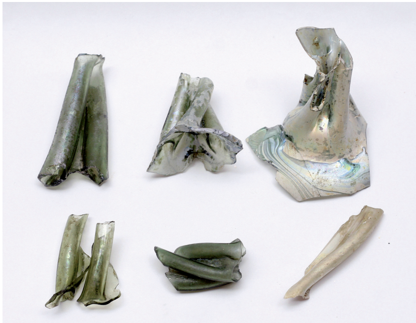
Sl. 5. Dijelovi boca tipa kutrolf (Preradovićeve ulica). Fig. 5. Sections of a kutrolf bottle (Preradović Street).