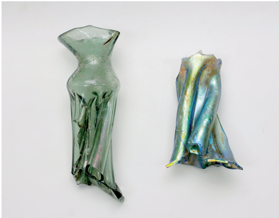
Sl. 6. Ulomci boca tipa kutrolf iz obrambenog jarka Staroga grada.