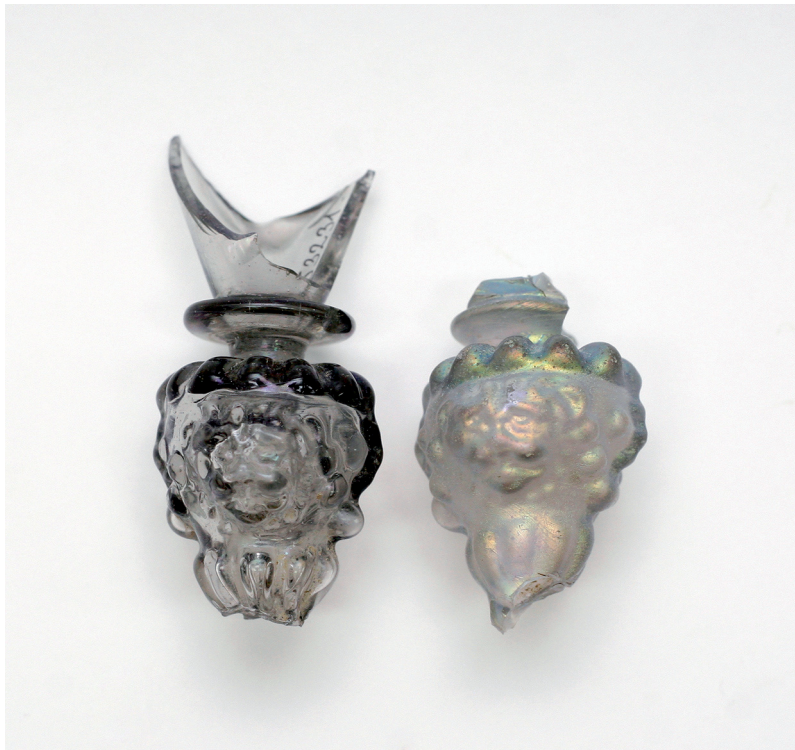
Sl. 11. Nodusi iz sloja s venecijanskim staklom (nekadašnji Adžijin trg). Fig. 11. Knops from a layer with Venetian glass (former Adžija Square).

nekadašnjeg Adžijina trga potječe iz sloja iznad drvene arhitekture 15. st. te je pronađen s ostalim primjercima stakla (dvokonusne boce), a nalazi iz grabišta Staroga grada vežu se u sloju uz materijal 15. do početka 17. st., pa nije isključeno da je koji od ulomaka i nešto mlađi jer su ove specifične čaše bile u uporabi i početkom 17. st.