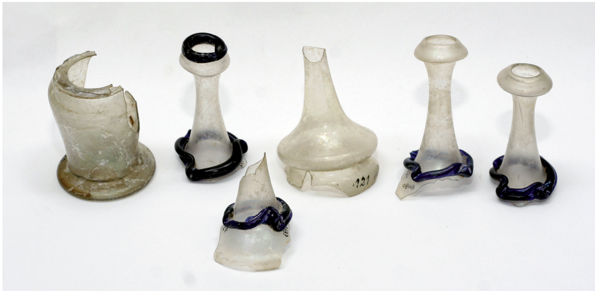
Sl. 2. Ulomci dvokonusnih boca otkrivenih na trgu B. Adžije (danas Franjevački trg). Fig. 2. Fragments of biconical flasks discovered at B. Adžija Square (today Franjevački Square).

među srednjovjekovnim staklom iz Celja nalazi se nekoliko dvokonusnih boca od tanko puhanog stakla. Pretpostavlja se da su boce proizvod domaćih ljubljanskih staklana koje su djelovale u 16. st. 13 Istom vremenu pripisuju se i boce iz štajerske utvrde Bajcsa-Var u Mađarskoj. 14