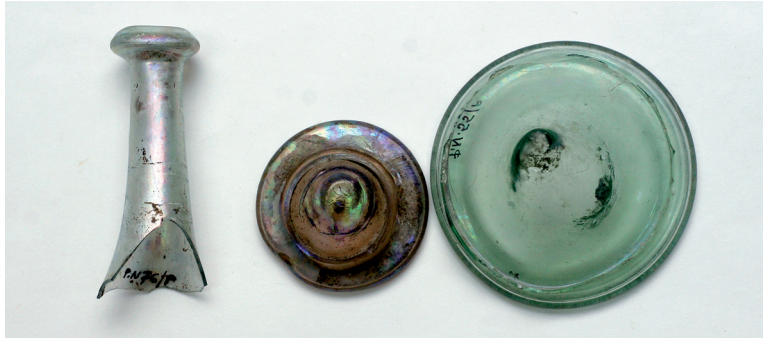
Sl. 3. Dijelovi dvokonusnih boca (Preradovićeva ulica). Fig. 3. Sections of biconical flasks (Preradović Street).