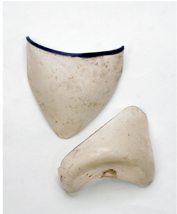
Sl. 8. Konusna glatka čaša (Pavlinska-Šenoina ulica). Fig. 8. A conical smooth beaker (Pavlinska-Šenoina Streets).