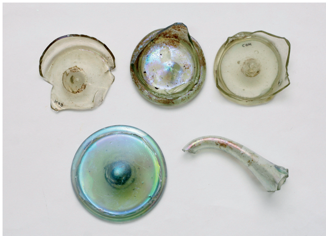
Sl. 4. Ulomci boca i lijevak (ugao Pavlinske i Šenoine ulice). Fig. 4. Fragments of bottles and a funnel (the corner of Pavlinska and Šenoina Streets).

venecijanske. Dekorativni detalj valovite trake od kobaltnog stakla poveznica je s orijentalno-islamskim stilom koji su tijekom 14. i 15. st. prihvatile muranske radionice i distribucijom svojih proizvoda širile Europom. Veliku sličnost s našim bocama pokazuju primjerci iz Bribira, 18 a njima je analogija pronađena u Kolovratu u Prijepolju s datacijom u 13.-14. st. 19 Bribirske primjerke datira se u šire vremensko razdoblje od sredine 14. do početka 16. st. 20 Male boce s Franjevačkog trga, združene s keramikom i željeznim predmetima, pripadati će vjerojatno kraju 15. i početku 16. st. Nalaz stakla s Franjevačkog trga kvalitetom izrade, raznolikošću oblika, a i količinom oslikava trgovačke veze Varaždina s venecijanskim staklarskim radionicama ili pak s onima iz drugih krajeva koje su usavršile svoju proizvodnju. Isto tako ovi su predmeti potvrda visokoga životnog standarda građana na razmeđu srednjeg i novog vijeka.