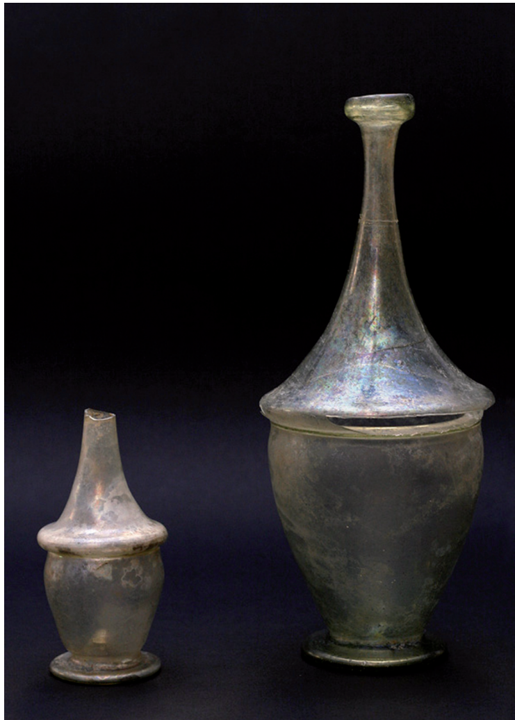
Sl. 1. Dvokonusne boce iz ulice S. S. Kranjčevića. Fig. 1. Biconical flasks from S. S. Kranjčević Street.

Iako su dvokonusne boce tijekom 14., a osobito u 15. st. bile često u upotrebi u gotovo cijeloj Europi kao kućni inventar, inventar gostionica i svratišta, a koristile su se i u ljekarništvu, 9 na nama obližnjim područjima nalazi takve vrste su rijetki. Ulomci takvih boca poznati su iz Bribira, odnosno iz franjevačkoga kompleksa na Dolu. 10 Kod varaždinskih primjeraka vrat je duži, trbuh je nisko spušten prema spoju s donjim konusom, a stajajući prsten niži je, što sve zajedno bocama, osobito onoj većoj, daje izduženu i elegantnu liniju. Dvokonusna boca iz Predjame u Sloveniji nađena je u sloju s drugim kasnosrednjovjekovnim nalazima. 11 Profilacija oboda svrstava ju među boce orijentalno-islamskih karakteristika, jednako kao što su i bribirski primjerci, datirani od sredine 14. do početka 16. st., nastali prema orijentalnim stilskim utjecajima. 12 I