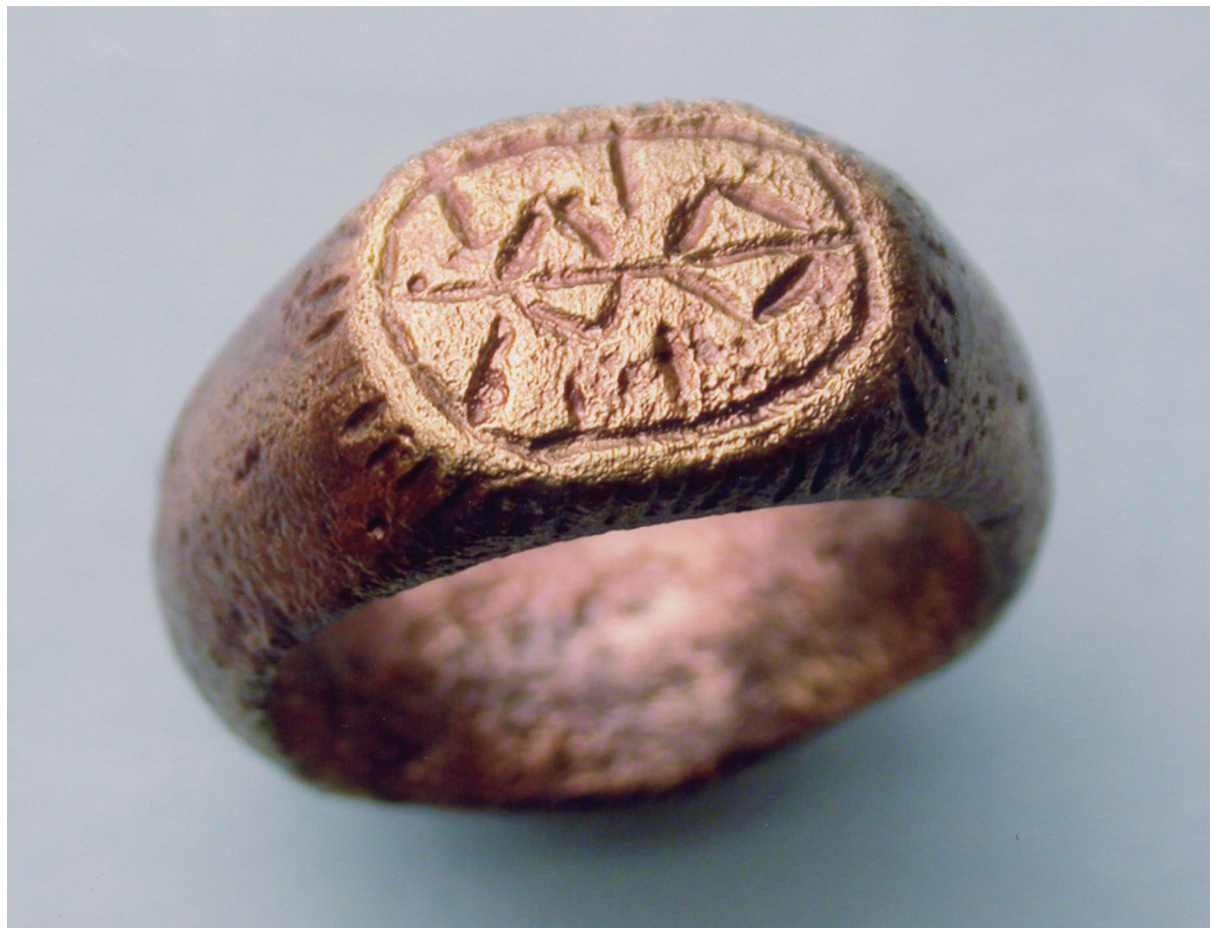
Sl. 10. Prsten sa žigom stilizirane pčele. Fig. 10. Ring with a stamp depicting a stylized bee .

isključeno da je spomenuti Muhamed Ibrahim darodavac prstena s osmanlijskim žigom te da ga je neki potomak vitezova iz reda drakona dobio kao zavjetni dar.