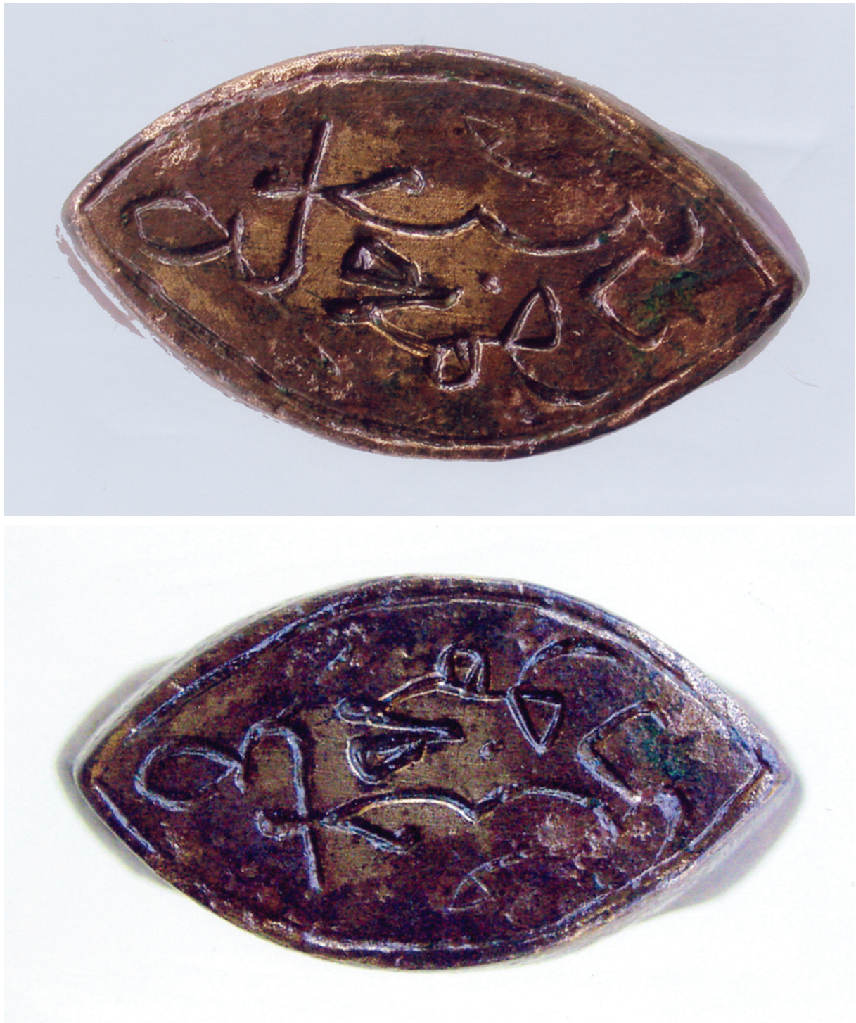
Sl. 12 a, b. Žig i otisak osmanlijsko-turskog zapisa na prstenu iz XVI st. Fig. 12 a, b. Stamp and impression of an Ottoman-Turkish inscription on a ring from the 16th century.