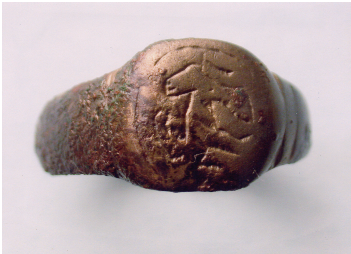
Sl. 5. Prsten s propetim lavom.