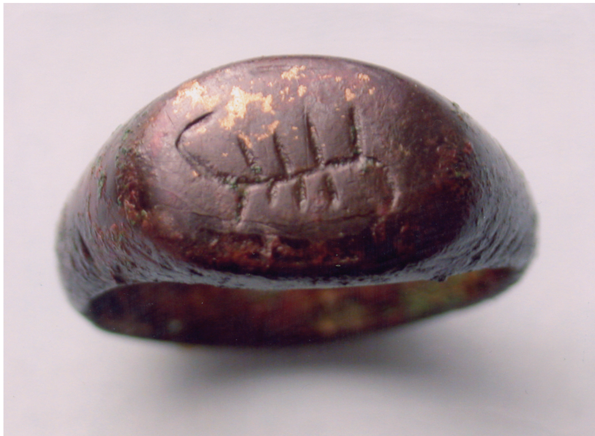
Sl. 9. Prsten sa škorpionom. Fig. 9. Ring with a scorio.

i obično stanovništvo zbog praktične uloge potpisa. 36 Pošto se ista formula natpisa sreće i s drugim imenima, očito se na vodočkom prstenu radi o konkretnoj ličnosti. Stoga su pregledane opširne popisne knjige koje se odnose na stanovnike naselja Vodica (Vodoča) u Strumičkoj kazi. U popisu iz 1570. godine, kako je uobičajeno, nabrojana su imena muških glava porodica (84), neoženjenih muškaraca (15), udovica (14) i takozvanih "baštinara" (16), 37 sve skupa s dažbinama. Pored kršćanskih imena, u ovom spisku prvi puta se spominju i muslimanska u smislu da je "jedna baština u rukama Kasema (sada) u rukama Muhameda Ibrahima". 38 Nije