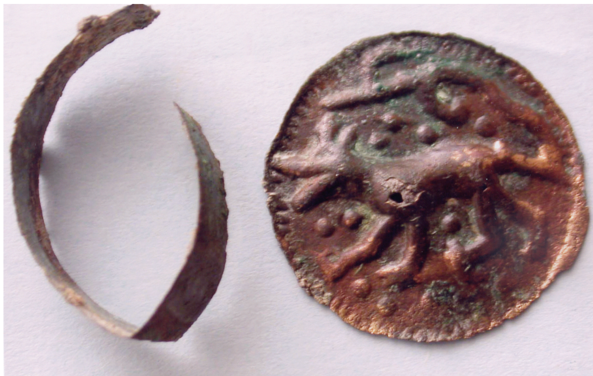
Sl. 3. Dio kružne naušnice vodočke varijante sa prikazom vuka.