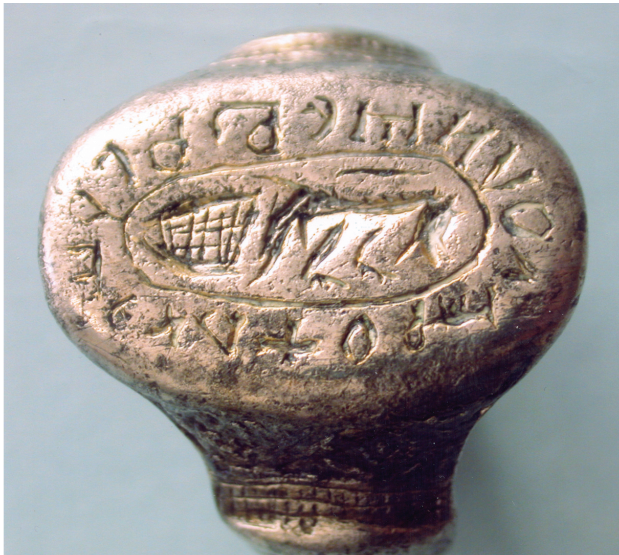
Sl. 1. Prsten s natpisom i cjelovitim grbom. Fig. 1. Ring with an inscription and complete coat of arms.

Pojedino prstenje ima zaručničku, bračnu, vjersku, amuletsku ili neku drugu namjenu. 3 Međutim, jasno se izdvaja skupina prstenja sa sfragističkom namjenom. Takvo prstenje ima natpise, cjelovite ili reducirane heraldičke i amblematske prikaze te prikaze zanimanja i društvenog, staleškog položaja.