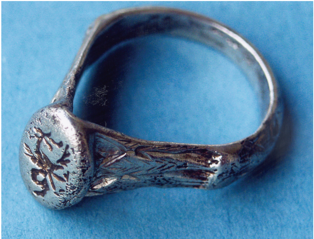
Sl. 11. Viteški, srebrni, pozlaćeni prsten s likom drakona. Fig. 11. Silver, gilt and knight's ring with a depiction of a dragon.

Granica između heraldičkih i amblematskih prikaza, sfragističke ili neke druge namjene prstenja u ovim vremenima (kraj XIV. – XVII. stoljeće) vrlo često je nejasno definirana. Ta je zanimljiva tema, međutim, tek načeta, pa nastavak istraživanja obećava, 43 poglavito u kontekstu izučavanja kulturne baštine šire regije.