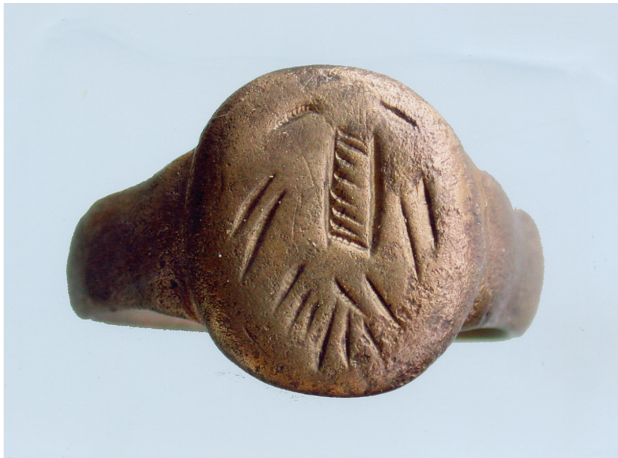
Sl. 7. Prsten s rustičnom imitacijom dvoglavog orla. Fig. 7. Ring with a rustical imitation of a double-headed eagle.

i amblematske. Njime se pokazuje zanimanje, investitura, jamči kvaliteta (primjerice pčelinjih produkata) itd. Prsten sa žigom pčele je datiran na kraj XV. ili u XVI. stoljeće.