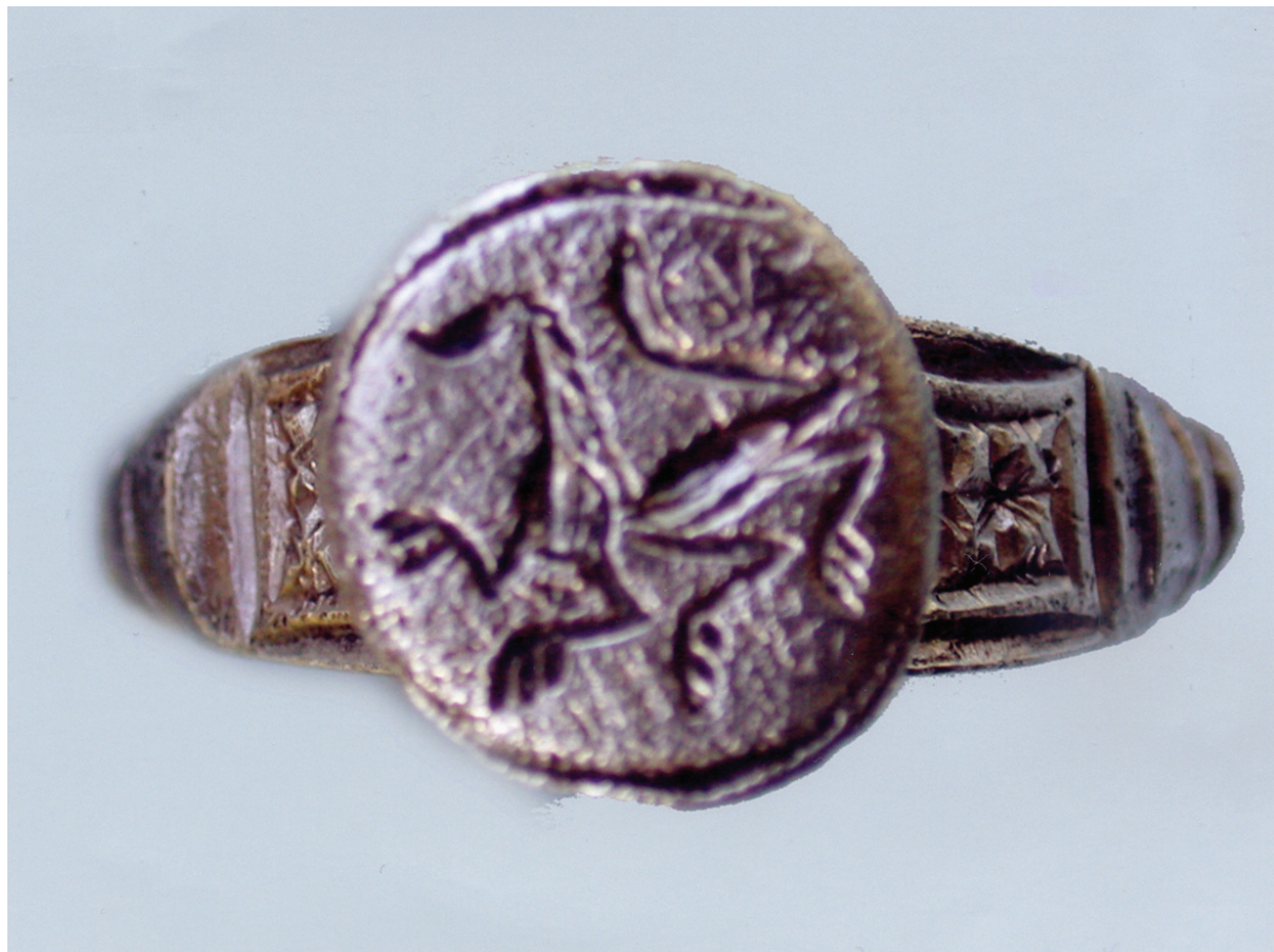
Sl. 2. Prsten sa žigom vuka.