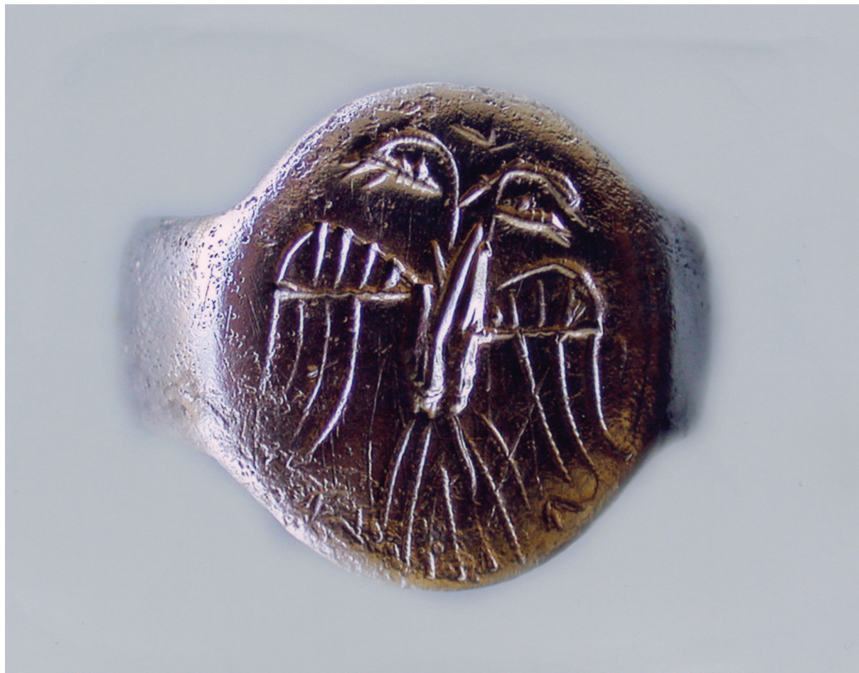
Sl. 6. Srebrni prsten s dvoglavim orlom. Fig. 6. Silver ring with a double-headed eagle.

iz sredine koja se držala tradicionalnih vrijednosti, 22 da je bio streličar (nosio je i prsten za odapinjanje luka), 23 da je bio ratnik (nađeni su ostaci željeznih oplata čizama), 24 a po svemu sudeći bio je i član posade bacačkih "makina" - σκορπιδιά. 25 Ovaj prsten potiče s kraja XIV. stoljeća, a bio je u uporabi i tokom XV. stoljeća.