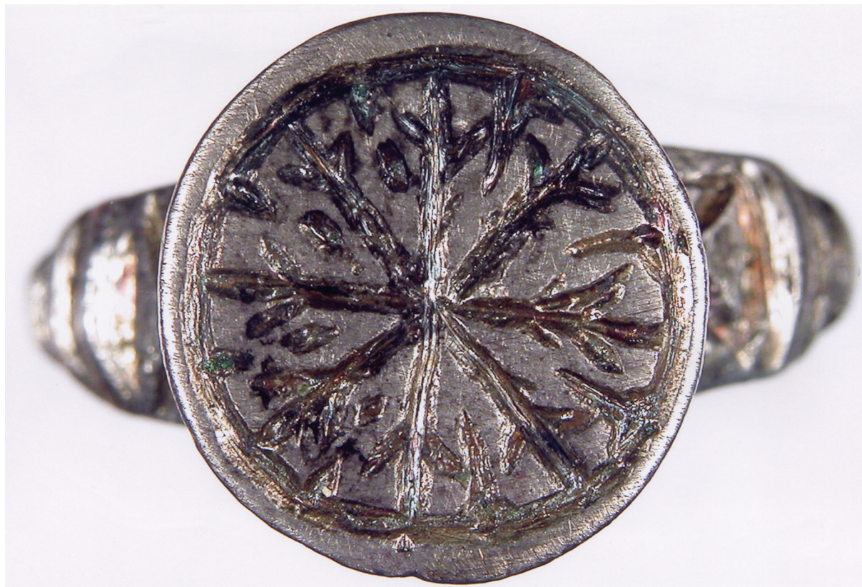
Sl. 4. Prsten s dvostrukim križem i stiliziranim krinovima. Fig. 4. Ring with a double cross and stylized lilies.

za potrebe osiromašenog pučanstva. 16 Analognog oblika prethodnom primjerku, tradicionalnog bizanstkog izgleda, su još tri prstena, ali sa žigovima dvoglavog i jednoglavog orla (Sl. 6-8; T. II, 2-4). 17 Najbliži srednjovjekovnim uzorima, što se tiče oblika i likovnih kvaliteta, je srebrni prsten iz groba 595 (Sl. 6; T. II, 2, a-c). Obruč široke trake u gornjem dijelu prelazi u prostranu kružnu glavu na kojoj je dvodimenzionalni crtež orla raširenih krila i repa, s jednim vratom i dvije glave iznad kojih je skica krune. 18 Proizveden krajem XIV. ili na samom početku XV. stoljeća, ovaj je prsten bio u dugoj uporabi kod više generacija jedne porodice.