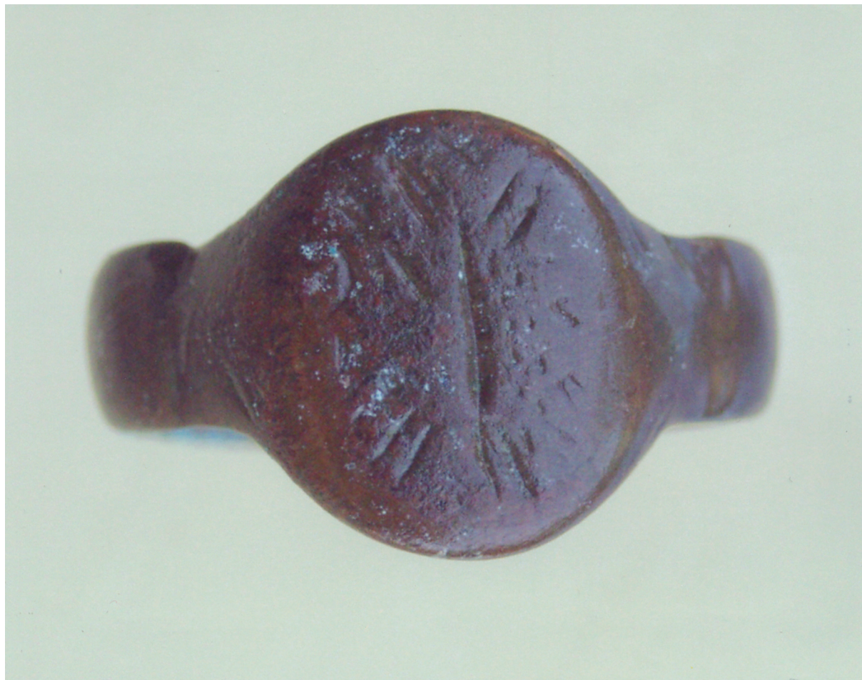
Sl. 8. Prsten s pučkom imitacijom jednoglavog orla. Fig. 8. Ring with a folk imitation of a single-headed eagle.

i Balkana. 32 Oni su bili ovlaštteni da "uruče viteštvo" družini od 50 svojih izabranika. 33 Tokom XV. stoljeća neki plemeniti čovjek iz vodočke okolice ostvario je tu čast. Njegov potomak iz drugog ili trećeg koljena bio je sahranjen s tim prstenom – insignijom na Vodočkoj nekropoli.