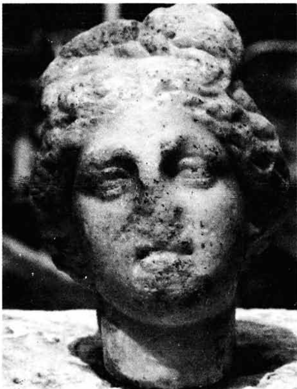
Sl. 1. Glava božice iz Senja, en face, Arheološki muzej u Zagrebu

nom košu i uz stopala. Svrdlo nije proizvodilo toliko snažan efekt svjetla i sjene kao na kipu A, jer je nešto pliće paralo površinu. Stoga nije čudno što kip B izgleda nekako klasičniji. Međutim, razlike među naborima oba kipa posljedica su stilskog i radio-ničkog, dakle tehničkog postupka, više nego što bi indicirali različiti vremenski postanak. Ako bi nas čak nabori i mogli prevariti u pogledu vremena nastanka statua, reljef na bočnim stranama, tj. na hridini kipa B, ipak upućuje da se radi o približno suvremenim kreacijama. Tu, naime, svaka životinja ima jasnu i duboku rubnu liniju koja odvaja figuru od pozadine. Ta rubna linija uparana je duboko i široko brzorotirajućim svrdlom. Duboke linije zapažaju se i na detaljima koji naznačuju izbočine i reljef hridine na bočnim stranama kipa B. Pojava rubnih linija uočena je na reljefima antičkih 28 i maloazijskih sarkofaga 29 iz, oko tzv. stilske promjene i nakon nje. 30 To nedvojbeno dokazuje da je ovaj