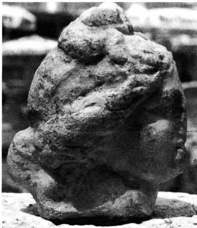
Sl. 2. Glava božice iz Senja, desni profil, Arheološki muzej u Zagrebu

kip izrađen oko godine 200. ili nakon nje, a rekao bih da ide čak i u prva desetljeća 3. st. Dakako, kad bi oba kipa bila cjelovitije očuvana, odnosno da su nam na raspolaganju i njihove glave, tada bi navedena datacija bila pouzdanija, ali i ovako je dovoljno sigurna.