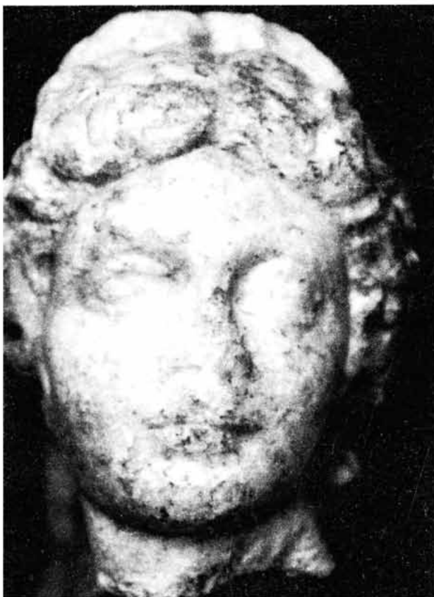
Slika 4. Glava božice iz Kostolca (Viminacij), Arheološki muzej u Zagrebu

javlja u ranom 3. st. To najbolje potvrđuje ranija glava božice iz Čitluka, 37 što je samo potkrepa gore iznesenoj dataciji.