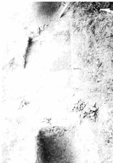
Sl. 3. Senj, Čopićevo naselje - kasnoantički grob 61