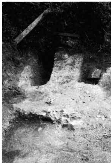
Sl. 4. Senj, Čopićevo naselje - kasnoantički grobovi 62 i 63

bijeli tragovi utvrđeni duž stranice groba. Ipak držimo prihvatljivijim tumačiti spomenute tragove žbuke kao ostatke neke konstrukcije za zatvaranje groba (kamene ploče, tegule ili sl.), a za koju je bila potrebna žbuka kao sredstvo učvršćivanja. Relativna velika širina upućuje na pomisao da je grob bio predviđen za više (dva paralelna) ukopa. Uz lijevu bočnu stranu, u blagom luku od uzglavnice prema donožnici, grob je sužen zidićem širine 22-25 cm izrađenim uz uporabu žbuke čiji su tragovi vidljivi na podnici. Do uništenja ovoga zidića došlo je vjerojatno pri raščišćavanju, kada je i probijena lijeva bočna strana u dužini 80 cm od donožnice, pa naše izrečene pretpostavke osim bijelih tragova žbuke na podnici ne možemo potkrijepiti drugim dokazima. Podnica groba klesanjem je poravnata stijena. Isklesane stijenske i podnica groba nisu žbukani.