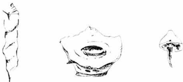
Sl. 5. Predmeti iz grobova 62 i 63

Širina groba pri vrhu iznosi 43-52 cm, a na dnu se smanjuje na 40 cm po sredini, odnosno 35 kod uzglavnice i donožnice. Dužina groba na podnici iznosi 176 cm (dužina na vrhu nije se mogla odrediti zbog postojećeg nasipa). Dubina groba je različita pa se tako