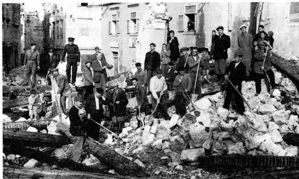
Razorne bombe srušile su (7. X. 1943.) do temelja crkvu sv. Franje, akcija Senjana na raščišćavanju ruševina spašavanja ostataka baštine, Senj krajem 1943.