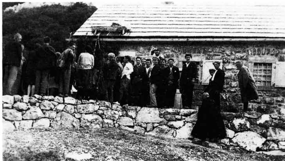
Svečanost otvorenja „Krajačeve kuće” - planinarskog doma na Zavižanu, snimljeno oko 15. kolovoza 1927.