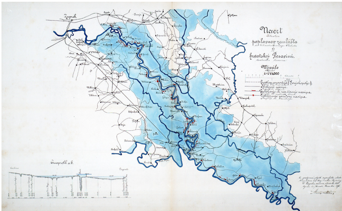
Poplavljeni nasipi u Hrvatskoj Posavini u godini 1876. - nacrt, UOZV, sv. XI-12 282/1875 (17637/1877)

Plan je prilog spisa koji se odnosi na razgraničenje djelokruga između Rijeke i Sušaka, a glede ubiranja mostarine i cestarine preko Rječine.