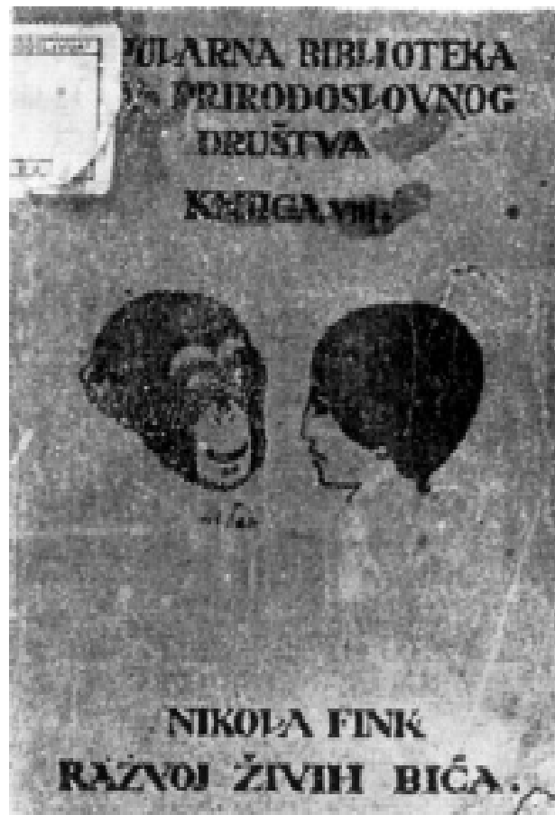
Naslovna stranica knjige jednog od domaćih autora iz niza Popularna biblioteka Hrvatskoga prirodoslovnog društva, iz godine 1919.