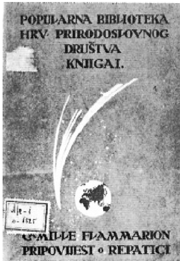
Naslovna stranica prve knjige iz niza Popularna biblioteka Hrvatskoga prirodoslovnog društva, stranog autora, u prijevodu, iz godine 1916.