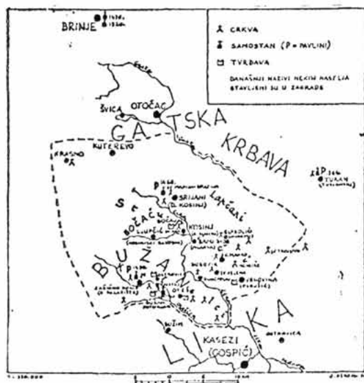
Buška župa (Bužani) prije turskih provala, prema St. Pavičiću izradio J. Derossi