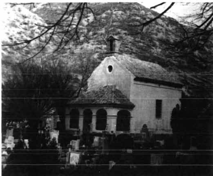
Sl. 1. Današnje senjsko groblje sv. Vida, posljednje počivalište mnogih generacija Senjana i svih onih koji su u Senj došli i u njemu djelovali; snimak od zapada, oko 1945.

Najljepše grobnice nalaze se na povišenom platou pod gajem. To su velike monumentalne grobnice najodličnijih senjskih obitelji nalik na arkade na zagrebačkom Mirogoju. Jednu od tih grobnica gradio je poznati hrvatski kipar Rendić. 13