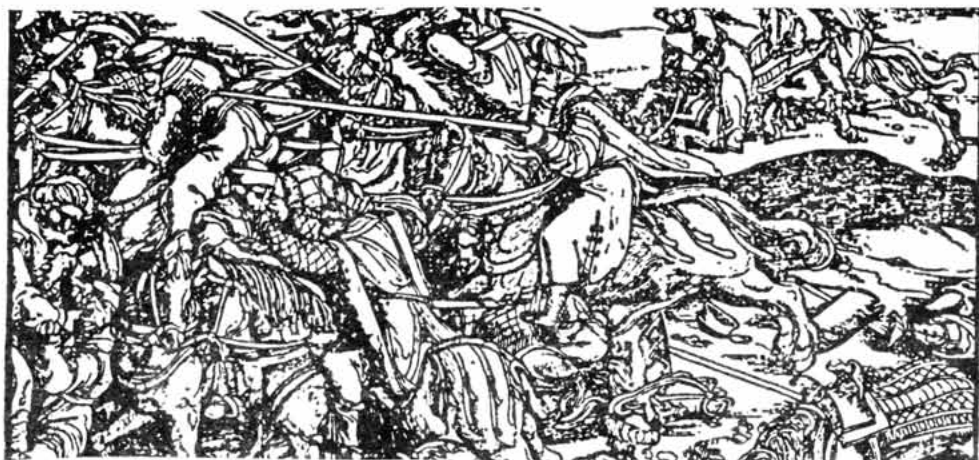
Sl. 2. – Boj s Turcima u Hrvatskoj (prema drvorezu Hansa Burgkmaura)

3. Ključni raspon razgradnje i stvaralaštva u Hrvatskoj na razmeđu XV. i XVI. stoljeća bijaše plodom prožimanja složenih društvenih procesa. Njihove su značajke i gibanja ovisili o uzajamnom djelovanju tri glavna razvojna područja: (a) strukture vladanja, (b) vanjski utjecaji i (c) promjene u hrvatskom društvu. Svako je od tih područja bilo strukturalno složeno, osjetlji- vo i ovisno o promjenama u drugim razvojnim područjima. Ako, dakle, istraživački i smijemo zasebno razlagati o razvoju kraljevske vlasti, djelovanju Venecije ili Turske, o demografskim promjenama i migracijama ili o značajkama privrede, ipak je tek njihovo komparativno prouča- vanje nužni preduvjet ocrtavanju društvenih procesa u Hrvatskoj oko godine 1500.