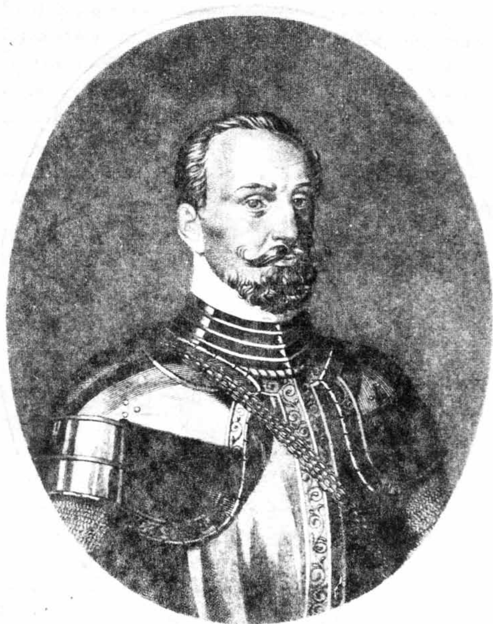
Sl. 3 – Senjanin Nikola Jurišić, znameniti hrvatski vojskovođa, kapetan Senja i Rijeke, vojni zapovjednik krajiške vojske i slavni branitelj Kisega od Turaka 1532 (prema bakrorezu Adama Ehrenreicha)