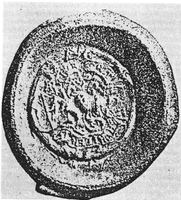
Sl. 4. – Pečat Nikole Jurišića s jedne isprave iz 1528. koja se čuva u Beču. U gornjem dijelu grba kaci-ga, dolje gavran i škorpija, naokolo na njemačkom: Niclas Jvreschusch Riter, 1527.

dem još jednu centu. Samo Božja milost čuva nas; budi ona milostiva mojoj duši« (citata prema Vj. Klaiću).