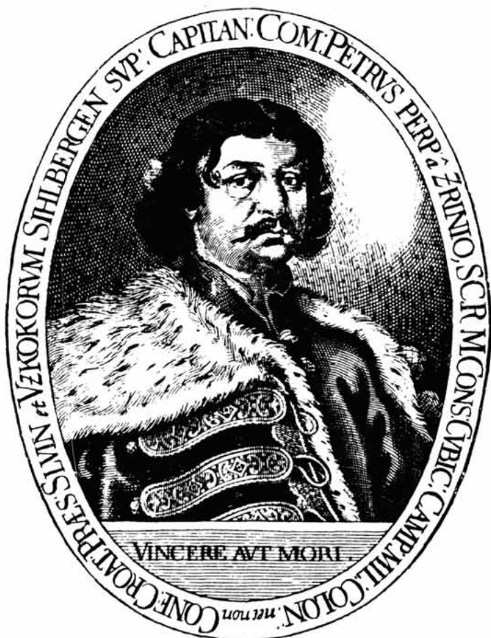
GRÖF PETAR ZRINSKI

Sl. 13. – Grof Petar Zrinski, (1621-1671) vojskovođa, hrvatski ban i veliki kapetan Senja, pjesnik i narodni mučenik