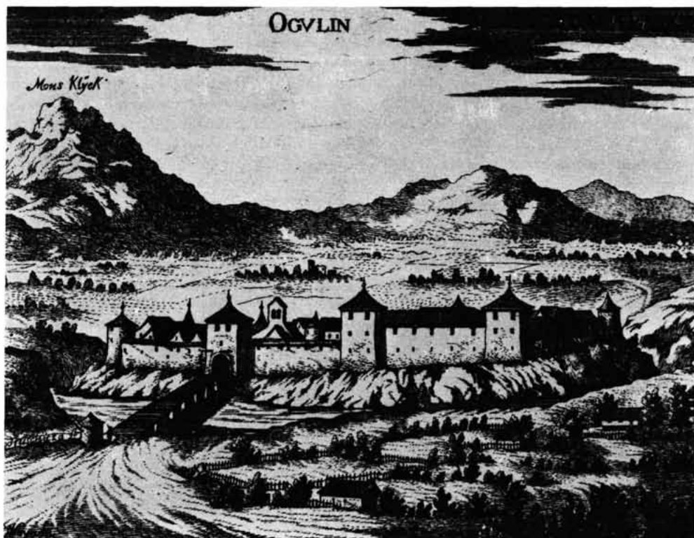
Sl. 16. – Stari frankopanski grad i tvrđava Ogulin s bližom okolicom, prema I. V. Valvasoru 1687.

Tražeci radnu snagu hrvatski ban Franz Batthyáni, koji ima svoje posjede i u Ugarskoj za- tražio je od kralja Ludovika II 1524. da može svoje kmetove iz Hrvatske preseliti na imanja u zapadnoj Ugarskoj. Slično dopuštanje zatražit će i Zrinski godine 1561. Batthyáni je na svoje posjede u Ugarskoj rado primao sve hrvatske doseljenike videći u njima prije svega radnu snagu. U Grebengradu nedaleko Varaždina organizirao je pravu ekspozituru za vrbovanje i prebaciva-