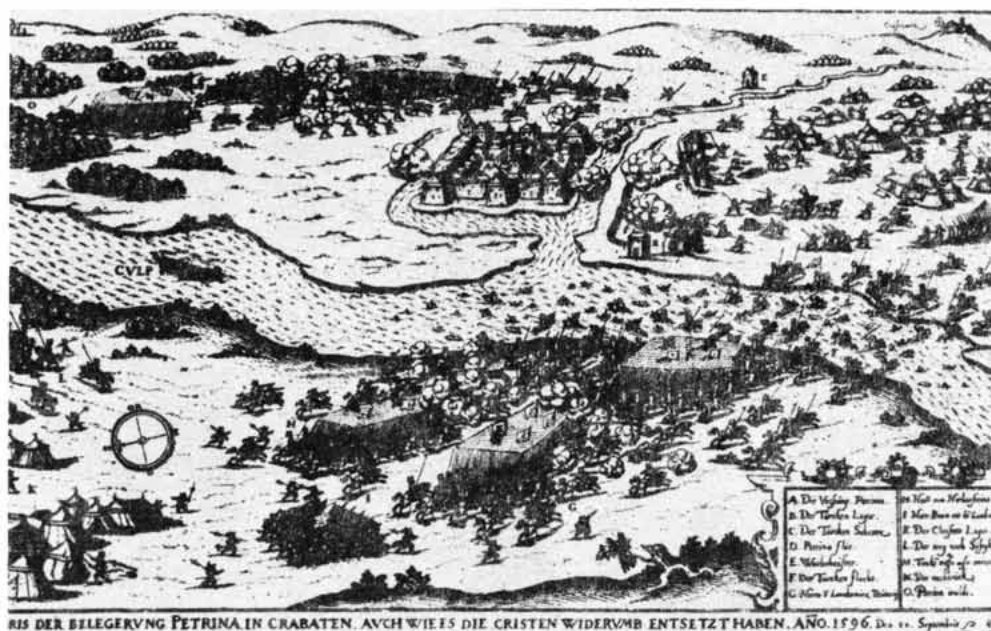
PODSADA PETRINJE I OBRANA NJEZINA 20. RUJNA 1596.