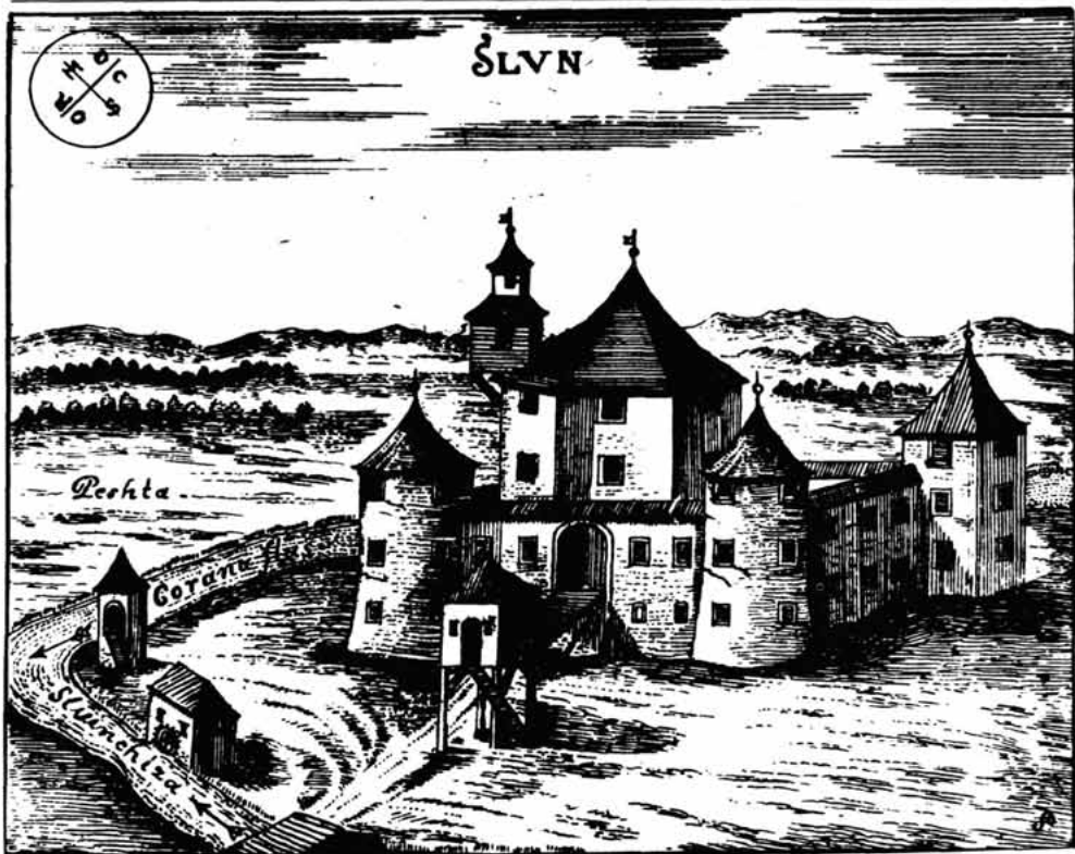
Sl. 17. – Krajiška tvrđava Slunj podignuta na ušću Slunjičice u Koranu, prema crtežu I. V. Valvasora iz 1687.

i Krbave početkom XVI. stoljeća, napose Klisa 1537, zauzela je Senjska kapetanija još značajnije mjesto u obrani Hrvatske koja se, kao što smo pokazali, sve više pretvara u Evropsku ratnu provinciju. 30