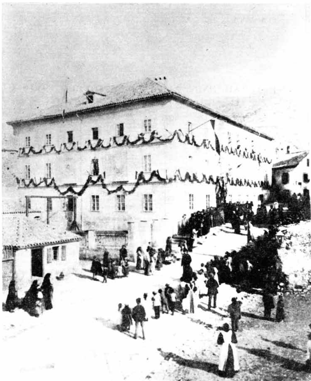
Sl. 3 – Ustoličenje biskupa dr. Antuna Maurovića – posjet Kraljevskoj velikoj realnoj gimnaziji u Senju, Zgon 9. XI. 1895.

1871. grad Senj izdvaja se kraljevskom naredbom iz vojne uprave i dobija privilegije kraljevskog slobodnog grada. U vezi s tim povijesnim događajem već iduće godine 1. 1. 1872.