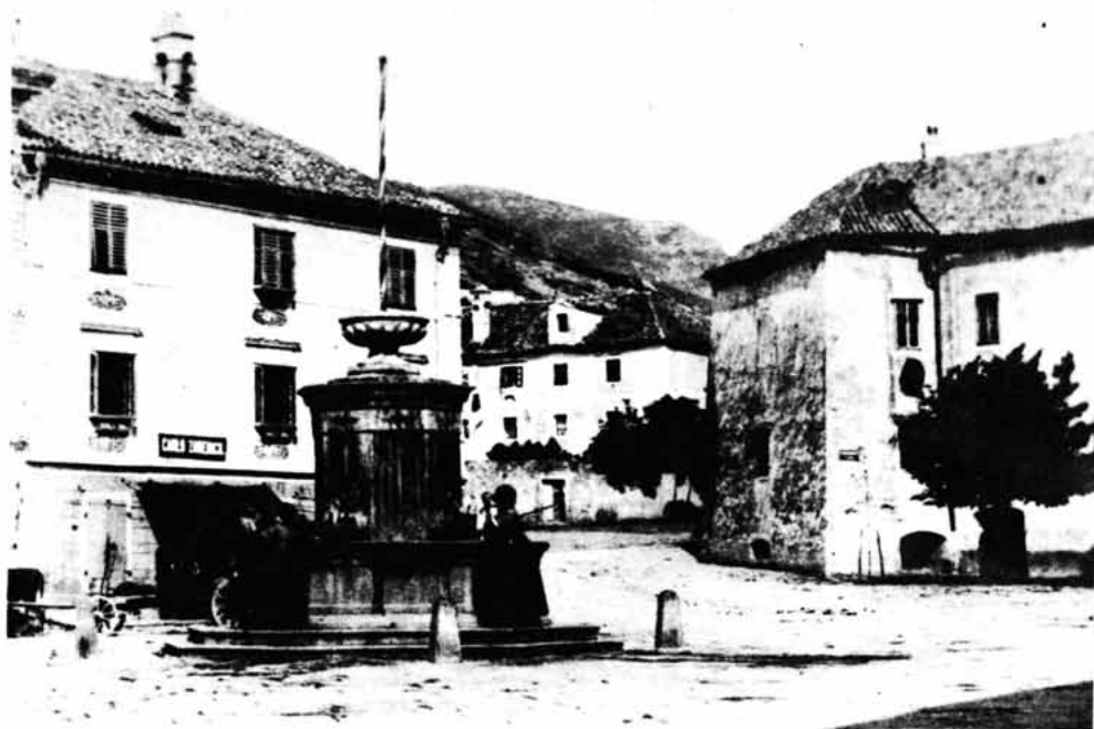
Sl. 4 — Bivši Zvonimirov trg — Cilnica, danas Trg M. Balena, snimak sa zapada, izgled oko 1910.

U poratnim godinama nastava se potpuno normalizira. Škola se polako oprema učilima. Kako je to jedina gimnazija od Zadra do Rijeke, vrlo je velik pritisak za prijem u ovu školu. S tim u vezi javlja se i pitanje prostora. Bila je, dakle, nužna adaptacija zgrade za gimnaziju i to se čini od bivše pučke škole i magistrata. Iz izvještaja prosvjetnih savjetni-