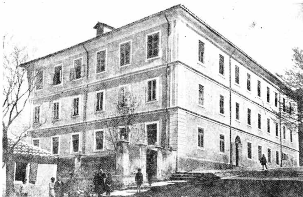
Sl. 5 – 5 Stara zgrada Senjske gimnazije – Zgon, oko 1935.

1945/46. dolazi do promjena u programu rada gimnazije. Ispuštaju se npr. predmeti: talijanski i njemački jezik, vjeronauk, nauka o zdravlju, ručni rad, a uvode ruski, engleski i francuski jezik, astronomija, tjelovježba, zemljopis Jugoslavije, a povijest se proširuje poviješću SSSR-a. Neki predmeti mijenjaju samo nazive: tako na primjer filozofska propedeutika mijenja naziv u filozofija. Postavljaju se i novi zahtjevi nastavnih metoda. Tako u Zapisniku Nastavničkog vijeća od 25. siječnja 1946. stoji između ostalog »... diktiranje je nesuvremeno, a nastavnicima je diktiranje zabranjeno osim glavnih pravila i zakona, a pojedine jedinice se moraju obrađivati tako da ih osrednji dak može zapamtiti.« U gimnaziji su, dakle, prisutne stare metode rada, ali unatoč tome u zapisniku od 22. lipnja 1946. prosvjetni izaslanik prof. V. Beñac »... izražava zadovoljstvo nad radom u ovoj školi. Uspoređujući sa školom na Sušaku uspjeh je ovdje bolji, a tako isto i disciplina.« U zapažanjima direktora prema zapisniku od 25. studenoga 1946. zгодne su primjedbe: