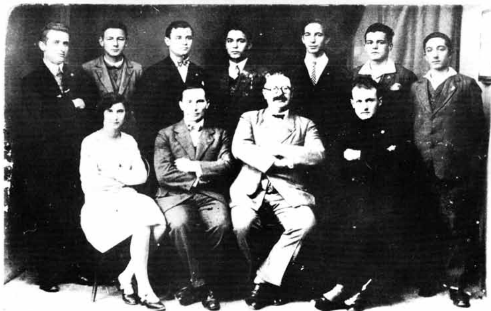
Sl. 7 — Maturanti Senjske gimnazije, s razrednikom 1930. godine

Kako je već bio na snazi Zakon o obvezatnom osmogodišnjem obrazovanju, tako se četiri niža razreda gimnazije pripajaju osnovnoj školi, a četiri viša razreda počinju raditi samostalno. Broj učenika počinje naglo opadati iz jednostavnog razloga što su otvorene srednje škole u susjednim općinama. Maksimalni broj učenika bio je pretposljednje godine rada gimnazije šk. g. 1973/74, a iznosio je 191 učenik. Razlog smanjenja broja daka leži i u činjenici da se u Senju otvara i ŠUP, koji prerasta u elektrometalsku školu.