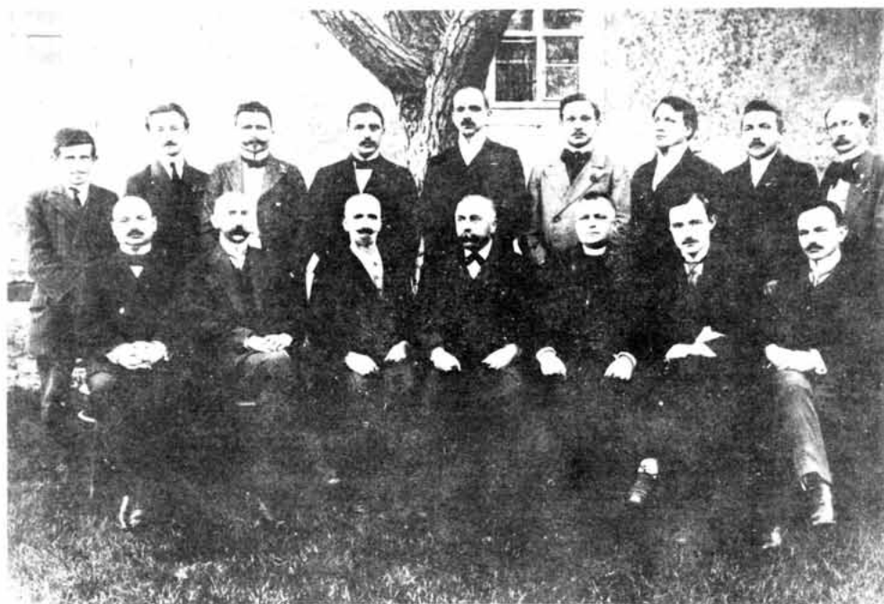
Sl. 18 — Profesorski zbor Kraljevske realne gimnazije u Senju oko 1920.

Konačno, šk. g. 1898/99. je najvažnija i od neprocjenjive vrijednosti za poznavanje