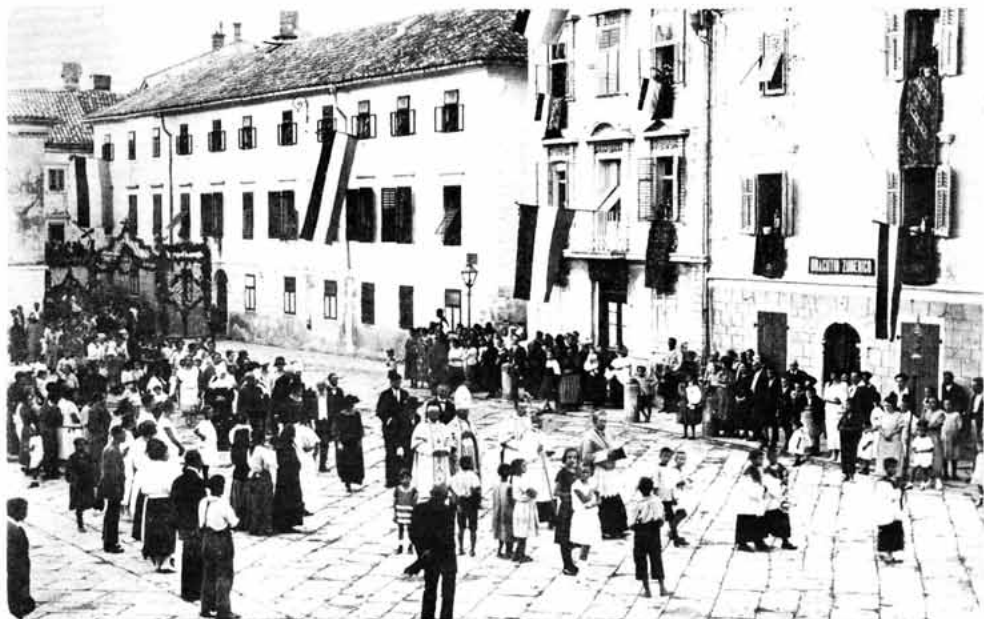
Sl. 20 – Velika placa – Cilnica, procesija na dan sv. Jurja – patrona grada Senja. Snimak oko 1925.