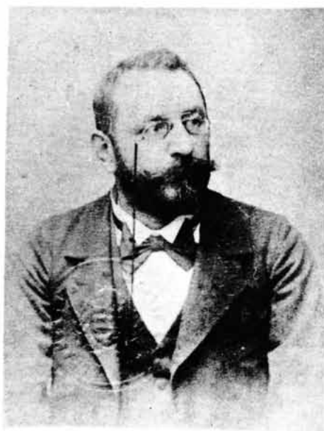
Sl. 59 – Sveučilišni profesor dr. Aleksandar Lochmer

Pisac brojnih stručnih rasprava o fonetici i prvih udžbenika za engleski u nas. Osnivač anglistike u Hrvata.