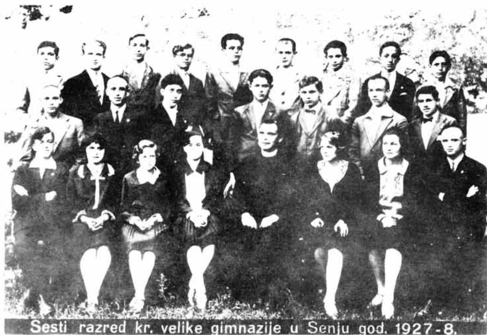
Sesti razred kr. velike gimnazije u Senju god. 1927-8.

ČRNČIĆ, Ivan (Poljana na Krku, 1831 – Rim, 1897), učenik. Školovao se u Rijeci, Senju i Gorici. Doktor teologije. Istraživao hrvatsku prošlost i sakupljao arhivsku građu. Jedan od prvih proučavatelja Bašćanske ploče.