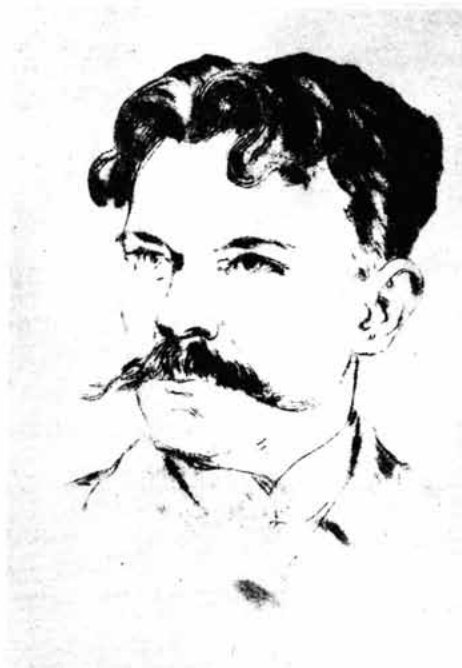
Sl. 58 – Pjesnik Silvije Strahimir Kranjčević

Učiteljevao u trgovačkim školama u Bosni i Hercegovini. Direktor sarajevske trgovačke škole i školski nadzornik. Suraduje u glavnim književnim časopisima, uređuje u Sarajevu časopis »Nada« (1895-1903), a pored pjesama piše manje informativne i kritičke članke. Kranjčević je jedan od rijetkih naših pjesnika koji je duboko osjetio osnovne probleme svoga naroda i suvremena društvena kretanja te je o njima pjevao neposredno i spontano u svojim pjesmama kao o svojim ličnim pitanjima. Svoj umjetnički svijet otvara nacionalnim temama iz senjske, uskočke i hrvatske prošlosti te neposrednog zbivanja, proširuje ga