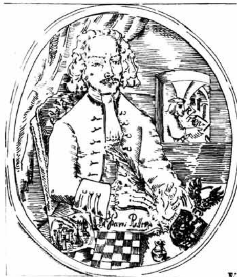
Sl. 64 – Pavao Vitezović

predlagao trodijalektalnu osnovicu za književni jezik Hrvata. Mnogo je radio na zbližavanju jugoslavenskih naroda i na njihovu međusobnom kulturnom upoznavanju. Glavna su mu hrvatska djela: »Odljenje sigetsko«, »Kronika aliti spomen vsega i svieta vikov«, »Priručnik aliti razliko mudrosti cvitje«, »Senjčica«, a latinska: »Croatia rediviva«, »Bosna captiva«, »Stemmatographia...« U rukopisu je ostao njegov bogat »Lexicon latino-illvricum«.