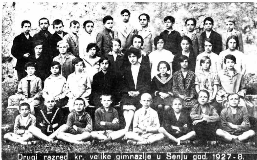
Sl. 52 – Drugi razred Kr. velike gimnazije u Senju god. 1927-8.

BONEFAČIĆ, Kvirin, Klement , (Baška, 1870 – Split, 1954), učenik. Bogosloviju polazio u Gorici. Teologiju doktorirao na Sveučilištu u Beču. Kulturni radnik i publicist. Zalagao se za bogoslužje na staroslavenskom jeziku. Zaslužan u borbi za oslobođenje Hrvatske. Biskup splitski (1923).