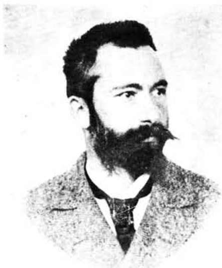
Sl. 61 – Književnik Vjenceslav Novak

Vrlo plodan i raznovrstan pisac. Znatno je proširio i bogatio tematsko-motivski raspon realističkih pisaca. U hrvatsku književnost uvodi Senj s okolicom («Posljednji Štaničići», «Dva svijeta», «Zapreke», «Dobro Dorčić» i dr.). Obraduje njegovu prošlost, raslojavanje pučanstva u novim promjenama, propadanje patricija, proširivanje građanstva, a osobito pojavu probleme intelektualaca. S tematikom i likovima iz Podgorja, kraja ispod Šebita, Novak otkriva pomalo bizarni svijet seoske sirotinje i pojavu prosjačenja («Baba Marta», «Fiškalova ispovijed», «Podgorka», «Pavao Šegota» i dr.). Novak je prvi naš pripovjedač radničke sirotinje, za koju je osjećao naročito razumijevanje i pokazivao iskrene zanose («Nezasitnost i bijeda», «Iz velegradskog podzemlja», «U glib»). Prvi je unio u književno djelo socijalističke pojave u Hrvatskoj («Majstor Adam», «Socijaldemokrati»). Imao je izvanredan dar opažanja, dao je široku i pastoznu sliku modernoga društvenog života potkraj 19. stoljeća. Ukupna djela I-XII (1931-1932).