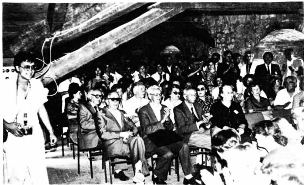
Sl. 76 – Članovi Kluba maturanata Senjske gimnazije na godišnjoj proslavi – susretu, tvrđava Nehaj

Senjska gimnazija-a well known classics-program secondary school at Senj (in modern usage the word »gimnazija« means a secondary school with a classical curriculum)-has given a very important contribution to Croatian and Yugoslav literature and culture, especially as an inspirational and effective factor in developing the cultural identity of the city of Senj and the surrounding countryside, first of all a part of the Croatian Littoral and the Lika region. Not a few of its teachers and pupils established a name for themselves in different areas of political, social and cultural life during the long struggle of the Croatian people to win its national freedom and defend its existence. This came into prominence particularly in literature and other areas of the written word, beginning with glagolitic priests and Pavao Ritter Vitezović to the rebellious and independent poetry of one of the greatest Croatian poets Silvije Strahimir Kranjčević as well as other distinguished Croatian writers born at Senj, and those protagonists of the written word who in the new situation acted also in a more finite period of time.