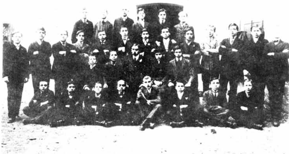
Sl. 72 – Učenici Senjske gimnazije – pitomci konvikta »Ožegovićanum«, oko 1925. godine

VLAHOVIĆ NIKOLA , publicista. Rodio se u Senju 1863. Gimnaziju polazio u Senju i Rijeci, pravo u Grazu, Beču i Zagrebu. Od rane mladosti bavio se beletrističkim radom.