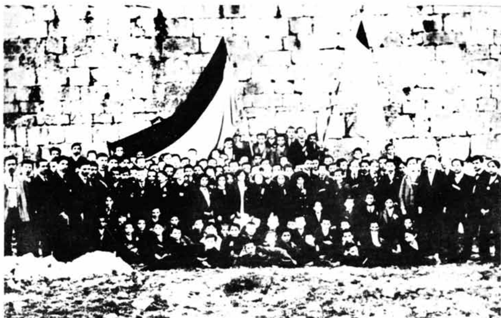
Sl. 75 – Učenci i profesori Senjske gimnazije učesnici općeg dačkog štrajka protiv Cuvaja ispred tvrđave Nehaj, travanj 1912.

Povijest hrvatske književnosti, NZMH-Cankarjeva založba, Zagreb-Ljubljana, 1987. Dokumentarij Gradskog muzeja Senj (rukopis).