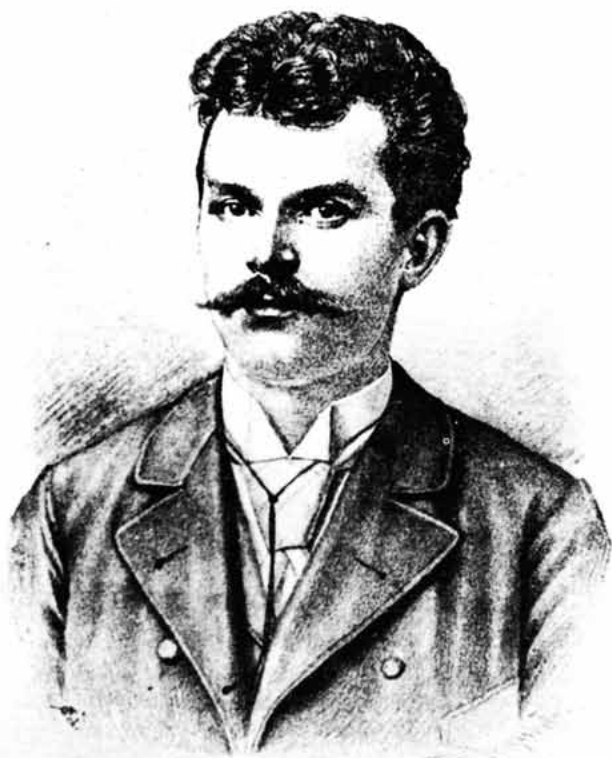
Sl. 70 – Veliki hrvatski pjesnik Silvije Strahimir Kranjčević

stu nacionalne sudbine svoga hrvatskog naroda, ali i univerzalnu, trajnu i općeljudsku težnju za slobodom u svim područjima ljudskog života, nagovijestivši socijalizam kao pretpostavku za izgradnju jednog čovječnijeg i pravednijeg društva. Po lucidnosti svojih spoznaja u svojim pjesmama, Kranjčević je nedvojbeno anticipator socijalnog bunta u nas i najžešći kritičar građanskog društva u Hrvatskoj i uopće, pa po tome i po svemu onome što je projicirao u svojim pjesmama pojam je korifeja napredne misli u nas, briljantni analitik tragizma hrvatske nacionalne sudbine u vremenu u kojem je živio i književno djelovao.