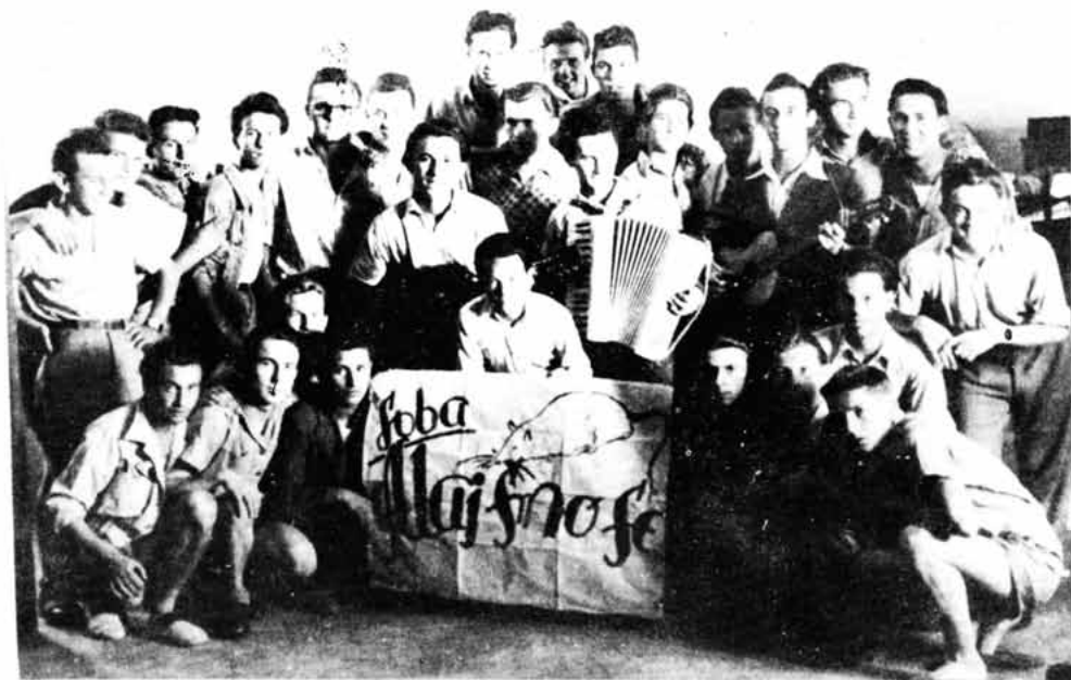
Sl. 68 – Učenici Senjske gimnazije, pitomci u Dačkom domu (Ožegovičianum) 1946. g.