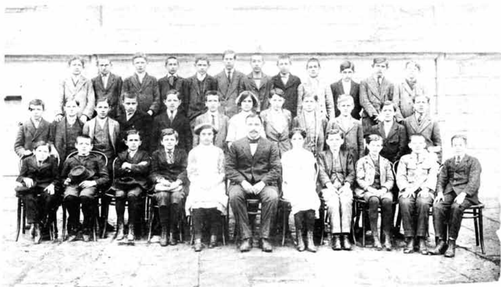
Sl. 73 – Učenici Senjske gimnazije ispred »Ožegovićanuma« oko 1920. godine

VUKELIĆ LAVOSLAV , književnik (Gornji Kosinj, 1840 – Sveti Križ, 1879). Gimnaziju završio u Senju 1897. Ban Ivan Mažuranić imenovao je Vukelića tajnikom podžupani-je u Križu. Kao šesnaestogodišnji mladić piše pjesme, koje objavljuje u spomenici »Lada« 1862. Njegov glavni rad vezan je za »Vijenac«, u kojemu je izašla većina njegovih pjesama i pripovijedaka. Zastrta turobnom slutnjom prerane neminovne smrti njegova je kasna poezija mračna. Pripovijesti Vukelićeve uklapaju se tematski u krug hajdučko-turske novelistike i u njima Vukelić se približava realističkom pisanju.