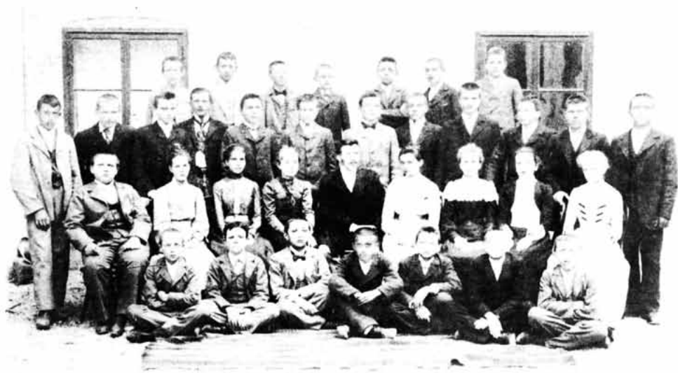
IV. razr. kr. real. gimn. senjske 1900 1901.