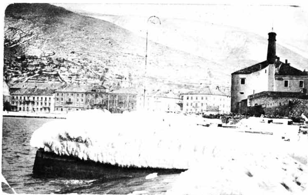
Sl. 71 – Senjska luka u ledu, gat sv. Marija Art oko godine 1925.

POTOČNJAK FRANJO , političar i publicist (Novi Vinodolski, 1862 – Zagreb, 1932). Gimnaziju završio u Senju 1882, pravne nauke u Zagrebu, Sudac, odvjetnik, član Stranke prava, narodni zastupnik u Hrvatskom saboru i žestoki kritičar režima, posebno khue-