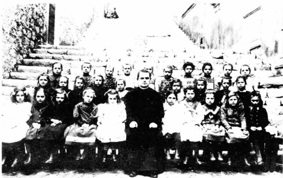
Sl. 99 – Učenici pučke škole Senj sa vjeroučiteljem. Mala vrata.