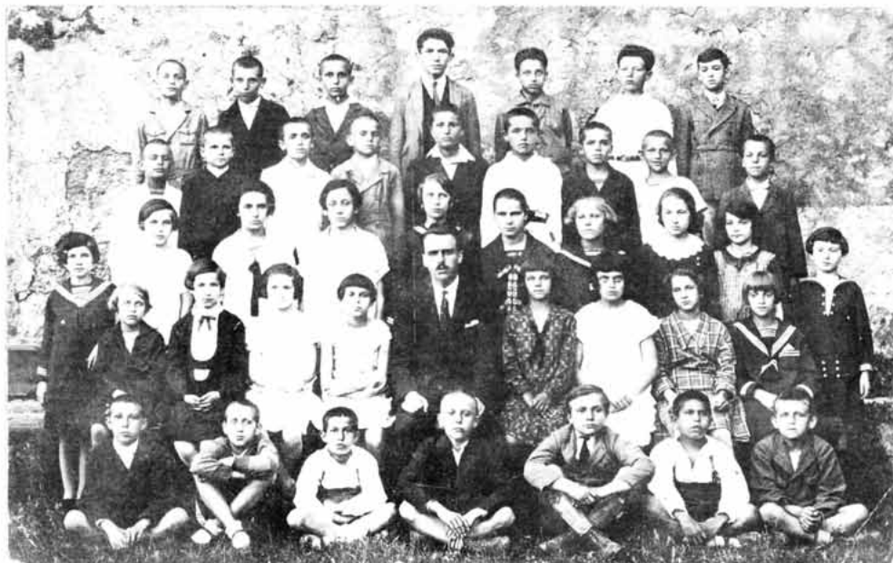
Sl. 98 – Učenici IV. raz. pučke škole u Senju s učiteljem

Uz ove škole u Senju djelovala je i radila nautička škola još godine 1780. Ukinuta je 1820. Glavna gradska škola s vremenom prerasta u višu pučku školu. Ova je imala tri smjera: obrtni, gospodarski i trgovački. U njima nastava traje tri do četiri godine i po programu bitno se razlikuje od gimnazije. Nije se moglo prijeći iz građanske škole u gimnaziju, jer su se programski znatno razlikovali. Obrtnička škola u Senju otvorena je 1894. Je li u to vrijeme otvorena i ženska stručna škola, pouzdano se ne zna, ali se zna da je ta škola u Senju djelovala i radila i da je odgajala brojne generacije ženske mladeži obrazujući ih za ženske stučne poslove. Ženska stručna škola trajala je tri godine i razvijala kod ženske mladeži sposobnosti krojenja i šivenja haljina i ostalog rublja. Iz dačke knjižice može se nazrijeti strogi odgoj u toj školi, s vrlo strogim pravilima ponašanja učenika. Pre-