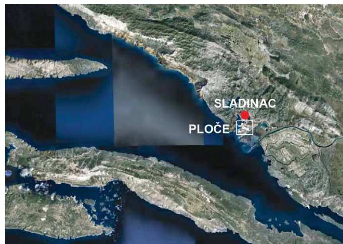
Karta 1 – Položaj lokaliteta Sladinac u Baćini.