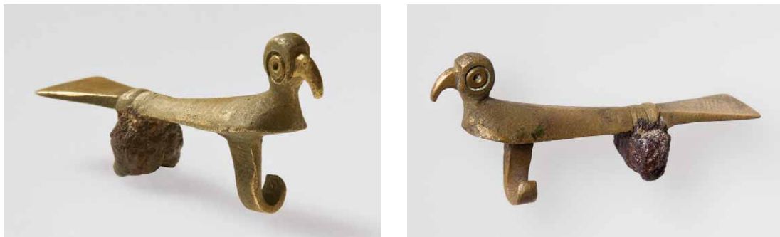
Sl. 2 – Pticolika kasnoantička fibula sa Sladinca u Baćini.