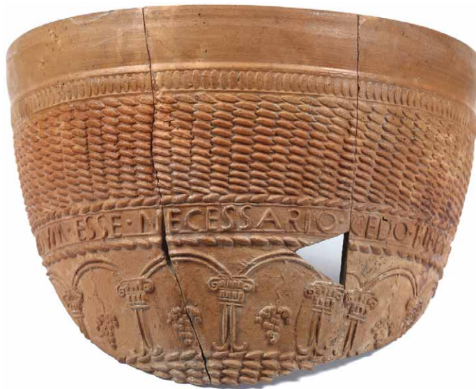
Slika 1 – Pehar s natpisom iz Osijeka (D. Doračić).

Na ovom mjestu ipak nas više zanima izuzetnost grupe posuda s potpisom Acastus , a riječ je o čašama s natpisom, kakva je i osječka (LAVIZZARI PEDRAZZINI 1987: 47). Uz natpis, osječki primjerak ističe se i po motivu imitacije stijenke pletene košare, vrijedne indikacije porijekla pehara.