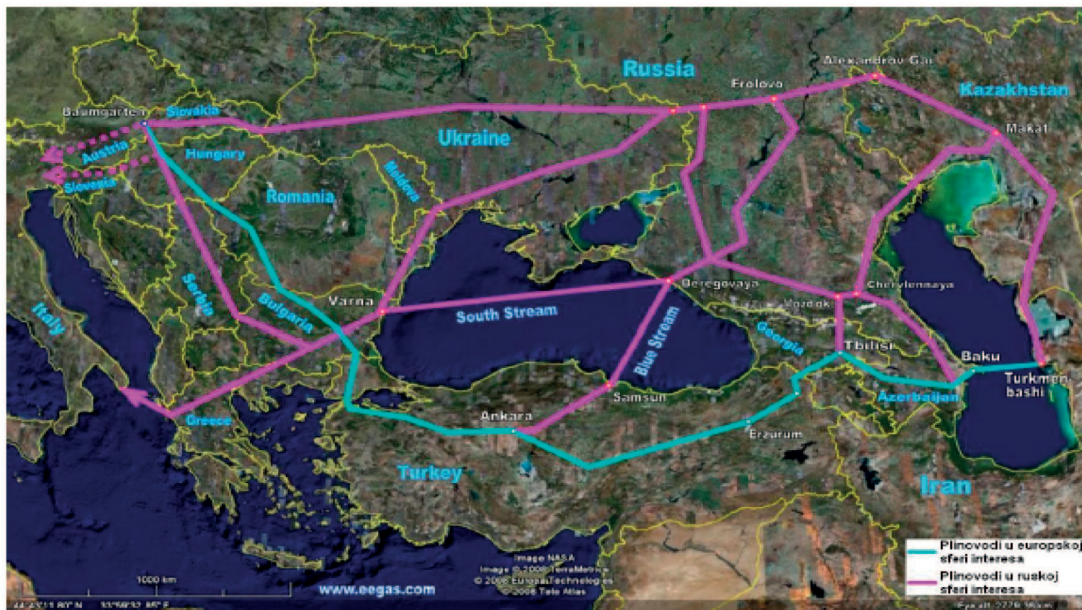
Slika 4. Plinovodi Južnog koridora za dobavu plina u Europu (Korchemkin, 2008)