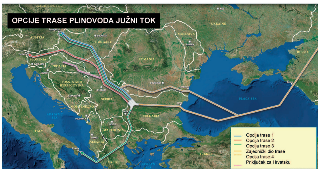
Slika 2. Trasa plinovoda Južni tok (South Stream, 2010)

Figure 2 South Stream pipeline route (South Stream, 2010)