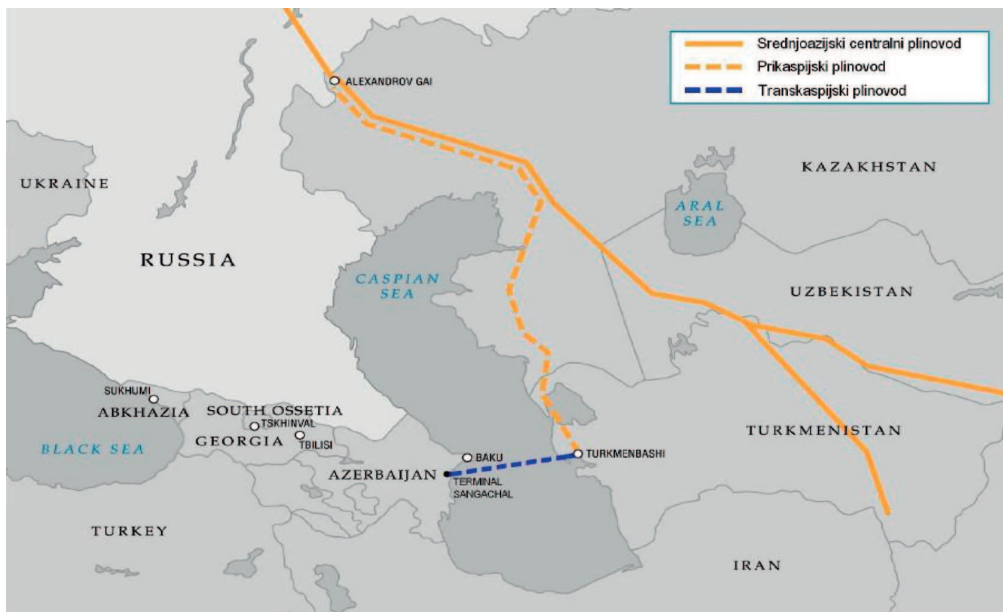
Slika 5. Planirane trase Prikaspijskog i Transkaspijskog plinovoda (Gazprom b, 2010)

predstavlja još jednu od mogućnosti opskrbe plina za Nabucco. Međutim, zbog različitih političkih čimbenika teško da će dobava biti osigurana u bližoj budućnosti. Stoga je Nabucco trenutno bez osiguranih izvora plina za projektirani kapacitet. Također javlja se i problem neizgrađene plinovodne infrastrukture u kaspiskoj regiji što se prvenstveno odnosi na izgradnju Transkaspijskog i Prikaspijskog plinovoda (slika 5).