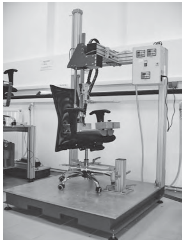
Uređaj za određivanje dimenzija uredskih i drugih vrsta stolica

Laboratorij je 1996. g. postao članom međunarodne europske udruge institucija koje se bave ispitivanjem i istraživanjem kvalitete namještaja EURIFI, čime je stekao pravo na ravnopravnu suradnju u ispitivanju i istraživanju kvalitete namještaja za sve zemlje članice. Šumarski fakultet, s predstavnikom prof. dr. sc.