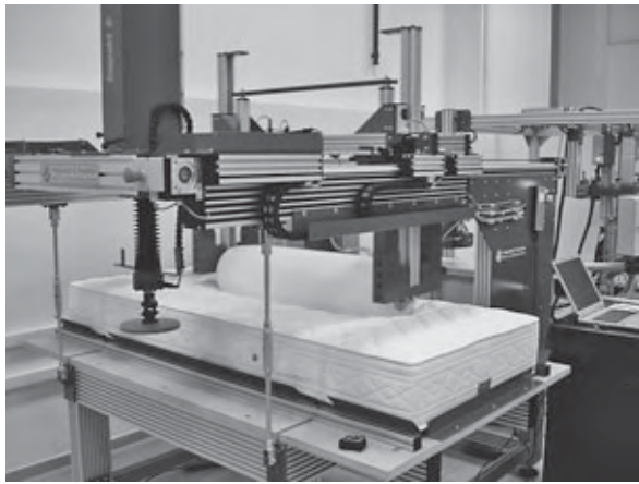
Uređaj za ispitivanje madraca valjanjem i određivanje elastičnih svojstava