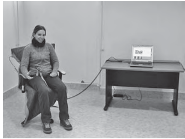
Mjerenje raspodjele i veličine tlakova pri sjedenju – EC Chair