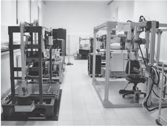
Pogled na dio laboratorija