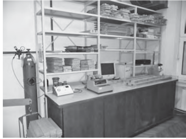
Dio laboratorija za površinsku obradu