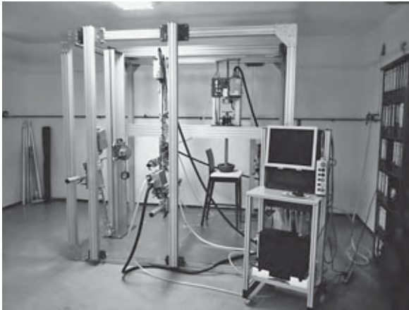
Uređaj za ispitivanje dječjih visokih i barskih stolica, dječjih krevetića i ormara