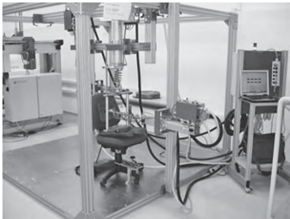
Uređaj za ispitivanje uredskih i drugih vrsta stolica, stolova i korpusa

vanje i provedbu ispitivanja laboratorij raspolaže klima-prostorijom za pripremu uzoraka te potpuno klimatiziranim i automatiziranim laboratorijem za provedbu ispitivanja površinske obrade, boja i lakova te ljepljiva i lijepljenja.