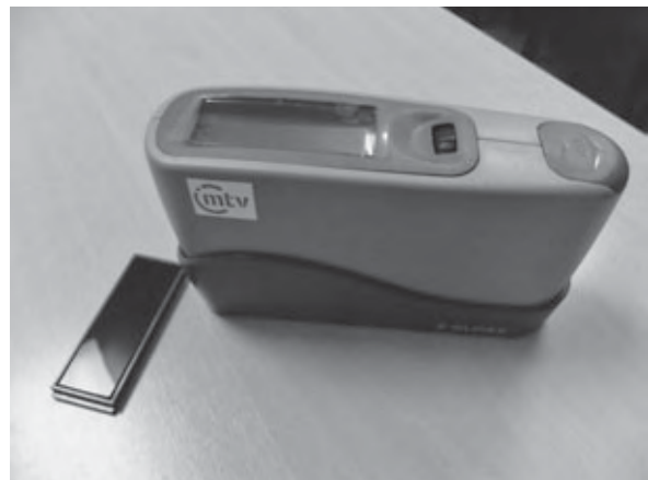
Uređaj za mjerenje sjaja

Akreditirane su metode na području ispitivanja otpornosti površine prema tekućinama, toplini i habanju te ocjenjivanje stupnja sjaja površine. Kad je riječ o bojama i lakovima, metode se odnose na određivanje otpornosti na habanje te na ispitivanje mrežice zarezivanjem. LIN je prvi laboratorij u zemlji koji ima akreditiranu sposobnost procjene zapaljivosti