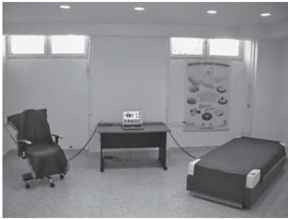
Laboratorij za ergonomiju – mjerne prostirke ErgoCheck Chair i Classic