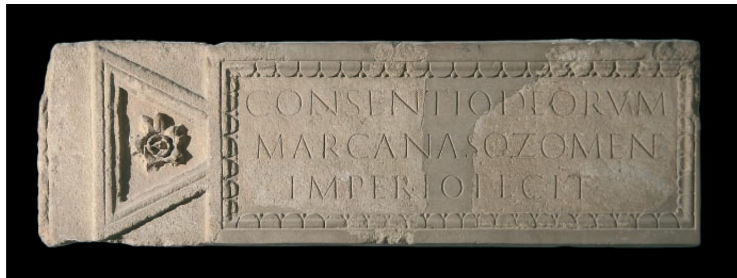
Slika 5. Natpis iz Salone sa spomenom višeg zbora bogova. Arheološki muzej u Splitu

komponentu kulta. Tu komponentu teško je potvrditi na prostoru Salone, no u obzir treba uzeti čitavo područje provincije Dalmacije, pogotovo zadinarski prostor, koji pokazuje drugačiju situaciju od one koja se zatječe u Saloni. Isto tako, zaključci se ne bi smjeli izvoditi samo na temelju ikonografskih značajki. Kao važni dokazi služe i epigrafske posvete Silvanu, koje na zadinarskom području idu u prilog tezi o autohtonosti Silvanova kulta, dok na prostoru Salone svjedoče o raširenosti kulta štovanja italskog Silvana u okvirima jakih utjecaja romanizacije, koji se očituju i na njezinoj religijskoj slici.