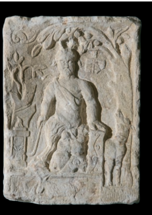
Slika 1. Reljef Silvana s Peruče. Arheološki muzej u Splitu