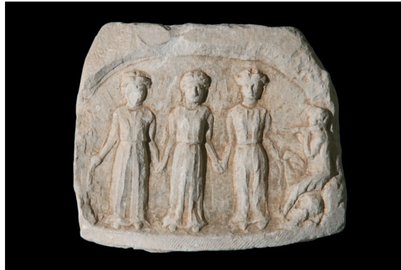
Slika 2. Reljef s Klisa, s prikazom Silvana koji sjedi i tri nimfe koje plešu. Arheološki muzej u Splitu