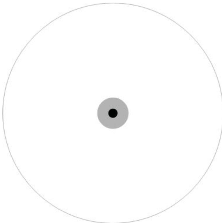
Slika 1: Korelacija između bijele, sive i crne zone izvora informacija – glavnih meta obavještajnih služba

se nalaze i informacije koje diplomatska predstavništva mogu slati matičnoj državi. 4 Prema tome, do informacija iz otvorenih izvora svatko obučen za tu vrstu posla može relativno lako doći. To su, dakle, javni, otvoreni i svima dostupni podaci. Smatra se da stručnjak za obavještajnu službu može, služeći se kompjuterom, doći i do 90 posto relevantnih informacija o onome što ga zanima. No, to uvijek nije pravilo. U svakom slučaju, kada se govori o otvorenom izvoru informacija, radi se o tzv. bijeloj zoni, gdje se dolazi do informacija etičnim i legalnim sredstvima . Taj aktivizam prikupljanja obavještajnih podataka iz svima dostupnih legalnih izvora naziva se i «obavještajnom službom otvorenih izvora» ( Open Source Intelligence – OSINT ). Dakle, informacije se prikupljaju na razne načine. A danas je prvi zadatak pretražiti internet koji nudi kolosalno obilje informacija.