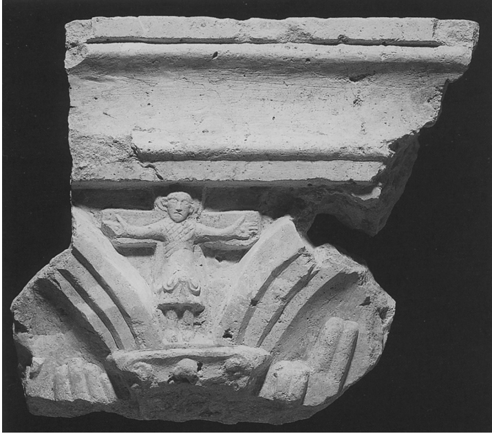
Slika 7. Fragment gornjeg dijela mramorne kamene ploče s prikazom Krista na križu, umetnutim između obruba ploče i dvaju reljefnih lukova. Ispod sačuvanog dijela bio je prikazan veći ljudski lik podignutih ruku od kojih se vide samo prsti. Muzej Vojvodine, Novi Sad (Nagy, Dombo: srednjovekovna opatija, tabla XXIII, sl. 64 = Paradisum plantavit, 417).