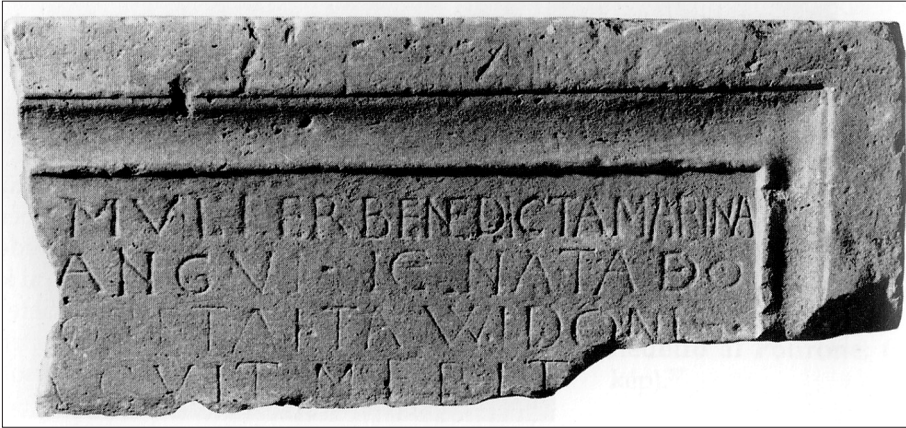
Slika 3. Fragment nadgrobne ploče “blagoslovljene žene Marine”, pronađen na Gradini. Muzej Vojvodine, Novi Sad (Nagy, Dombo: srednjovekovna opatija, tabla I, sl. 1 = Paradisum plantavit, 236).