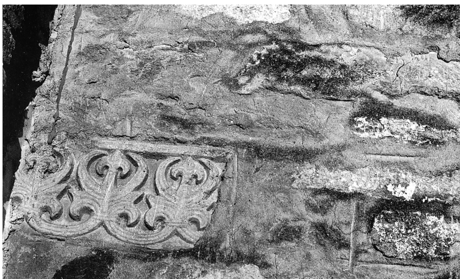
Slika 6. Fragment friza ukrašenog reljefom s motivom palmeta, ugrađen kao spolij u zapadni zid crkve pravoslavnog manastira u Starom Rakovcu (Nagy, Dombo: srednjovekovna opatija, tabla XXI, sl. 60 = Kulić, Manastir Rakovac, 51).