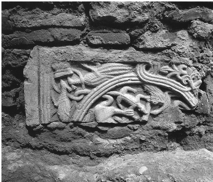
Slika 5. Fragment reljefom ukrašene mramorne ploče, ugrađen kao spolij u mlađi zid samostana u Dumbovu. Muzej Vojvodine, Novi Sad (A középkori Dél-Alföld, 405 = Paradisum plantavit, 416).