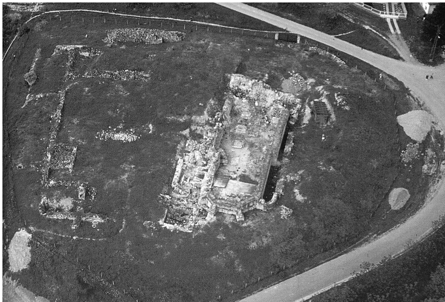
Slika 1. Lokalitet Gradina u Novom Rakovcu: pogled iz zraka s istoka (A középkori Dél-Alföld, 383).