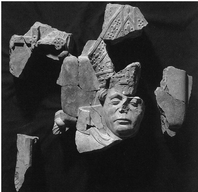
Slika 4. Ulomci nadgrobne ploče crkvenog poglavara (vjerojatno kaločkog nadbiskupa), pronađeni među ostacima apside crkve na Gradini. Muzej Vojvodine, Novi Sad (Nagy, Dombo: srednjovekovna opatija, tabla I, sl. 2 = Paradisum plantavit, 456).