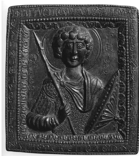
Slika 8. Liješana brončana ikona sv. Jurja (veličina 7,2 × 6,5 cm), pronađena u skupnom nalazu u Novom Rakovcu nedaleko od samostana Dumbovo. Muzej Vojvodine, Novi Sad (Paradisum plantavit, 141).