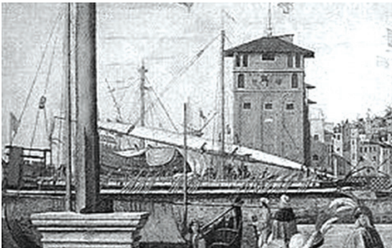
Slika 5. Uvećani detalj Carpacciove slike s galijom a sensile na kojoj se jasno razabiru po tri vesla u skupini. Figure 5. Magnified detail of Carpaccio painting with a galley a sensile on which three oars in a group are clearly seen

Figure 4. Painting of Vittore Carpaccio Ritorno degli Ambasciatori – The Return of the Ambassadors from the cycle of Legend of St. Ursule from the end of 15th century which Vidović used as a main proof