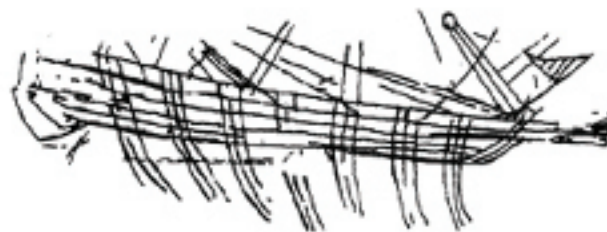
Figure 1. Stone relief from 4th century B.C., found on Athens acropolis, on which oars and rowers on Greek trireme are clearly seen

Slika 2. Crtež duboreza urezanoga na olupini mletačke galije iz prve polovice 14. stoljeća, nedavno pronađenoj u Veneciji. Jasno se vide vesla u jednom redu, po tri u grupi.