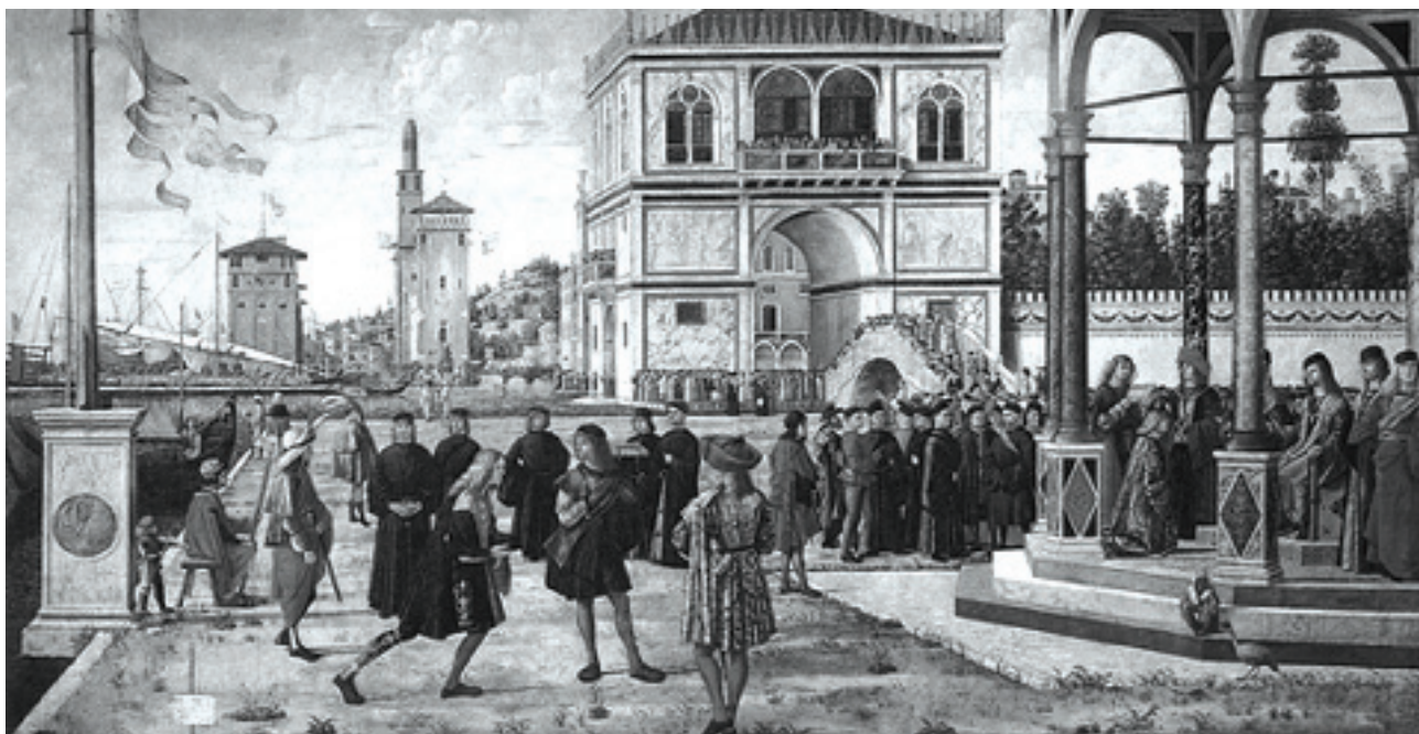
Slika 4. Slika Vittorea Carpaccia Ritorno degli Ambasciatori (Povratak veleposlanika), iz ciklusa Legende o sv. Uršuli s kraja 15. stoljeća, koja je Vidoviću poslužila kao „krunski“ dokaz.

Figure 4. Painting of Vittore Carpaccio Ritorno degli Ambasciatori – The Return of the Ambassadors from the cycle of Legend of St. Ursule from the end of 15th century which Vidović used as a main proof