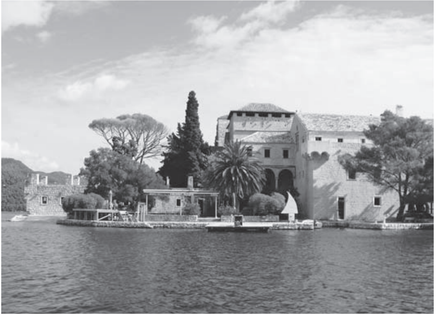
SL. 1. SAMOSTAN SV. MARIJE NA MLJETU FIG. 1 MONASTERY OF ST. MARY, MLJET