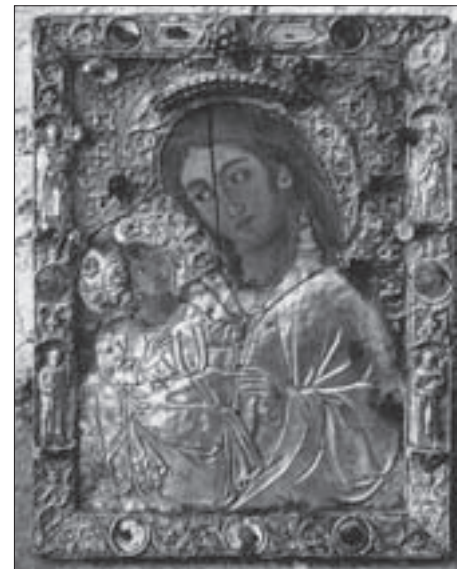
SL. 8. NEZNANI MAJSTOR, IKONA GOSPE OD JEZERA (15. ST.) FIG. 8 UNKNOWN PAINTER, OUR LADY OF THE LAKE, ICON (C15 TH )