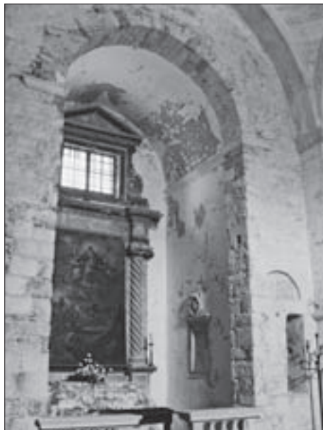
SL. 4. CRKVA SV. MARIJE NA MLJETU, SJEVERNA KAPELA FIG. 4 CHURCH OF ST. MARY, MLJET, NORTH CHAPEL