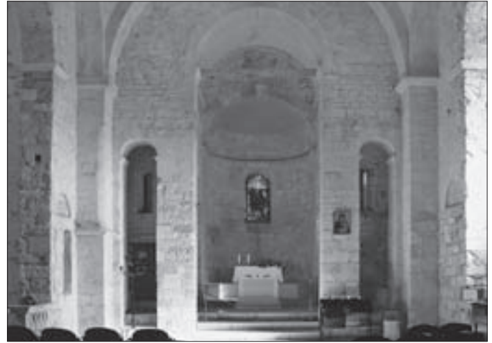
SL. 10. CRKVA SV. MARIJE NA MLJETU, SVETIŠTE FIG. 10 CHURCH OF ST. MARY, MLJET, CHANCEL

ve crkve: u južnoj je smještena pala Sv. Benedikta iz 1706. godine pripisana Petru Matteiju (Matej, Matijašević, Matejević; Dubrovnik, 1670.-1726.), 62 ocijenjena osrednjim radom ovog dubrovačkoga baroknog slikara, 63 a u sjevernoj oltarna slika neznanoga majstora 64 s prikazom Uznesenja Blažene Djevice Marije , kopija slike iste teme na stropu crkve Karmen u Dubrovniku venecijanskog slikara Bartolomea Litterinija (Venecija, 1669.-1748.).