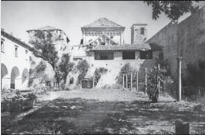
SL. 6. SAMOSTANSKI KLAUSTAR PRIJE OBNOVE, S LODOM PRIGRAĐENOM JUŽNOJ KAPELI CRKVE FIG. 6 MONASTERY CLOISTER PRIOR TO RESTORATION, WITH A LOGGIA ANNEXED TO THE SOUTH CHAPEL