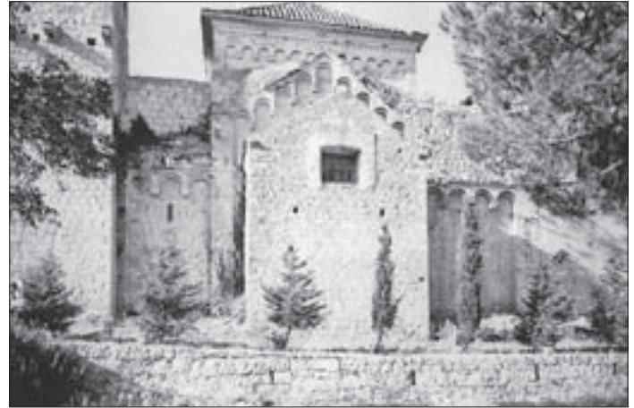
SL. 7. SJEVERNA KAPELA PRIJE OBNOVE FIG. 7 NORTH CHAPEL PRIOR TO RESTORATION

potkraj 15. ili početkom 16. stoljeca, 37 pa je stoga i ta prostorija vjerojatno bila dio renesansne obnove samostana. 38 Ako je doista riječ o nekadašnjoj kapeli, 39 ona je mogla služiti kao mjesto za molitvu priključeno samostanu, kojemu su redovnici mogli pristupiti bez napuštanja samostanskog zdanja. Spomenuti prostor, dakle, ne predviđa izravnu komunikaciju s tijelom crkve (nego samo s njezinim jasno odvojenim predvorjem) pa se stoga ne može shvatiti kao novoizgrađena kapela posvećena sv. Jeronimu, za koju Girolamo Giorgi kaže da je njegovom zaslugom ukrasila mljetsku crkvu (a ne samostan).