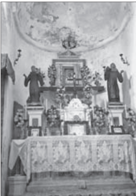
SL. 11. NEKADAŠNJI GLAVNI OLTAR CRKVE SV. MARIJE NA MLJETU FIG. 11 CHURCH OF ST. MARY, MLJET, FORMER MAIN ALTAR

(Sl. 10.). 66 Inventaru 18. stoljeća koji je upotrijebio baroknu obnovu pripadaju i bočni kameni oltari pod pjevalištem, kao i samo oslikano pjevalište, redom radovi domaćih kasnobaroknih majstora. 67