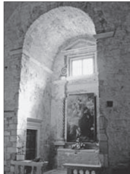
SL. 5. CRKVA SV. MARIJE NA MLJETU, JUŽNA KAPELA FIG. 5 CHURCH OF ST. MARY, MLJET, SOUTH CHAPEL

Ranija, Bogorodicična kapela može se prepoznati kao današnja sjeverna kapela posvećena Uznesenju Marijinu (Sl. 4.), a ‘nova’ kapela koju pisac izvještaja navodi kao posvećenu svome imenjaku sv. Jeronimu bila bi današnja južna kapela s kasnijom, osamnaestostoljetnom oltarnom palom sv. Benedikta (Sl. 5.). Kontinuitet čašćenja sv. Jeronima, prema Giorgijevim riječima „posebnog zagovornika slavenskoga naroda”, u mljetskoj je crkvi tako nastavljen novoizgrađenom kapelom. U njoj su, kako doznajemo iz sačuvanog popisa samostanske imovine iz 1458. godine, već polovicom 15. stoljeća postojala tri oltara, od kojih je jedan bio posvećen upravo sv. Jeronimu. 36 Moguće je da se promjena titulara bočnoga oltara dogodila prilikom postavljanja oltarne pale s prikazom osnivača benediktinskoga reda početkom 18. stoljeća. Valja napomenuti da se u sklopu sjevernoga krila samostana (odnosno uz jugozapadnu stranu crkvenog predvorja) nalazi još jedna prostorića, nekoć vjerojatno kapela, koje je ulaz smješten u prvom traveju klaustara nasuprot stubištu što vodi u stambeni dio samostanskoga sklopa i iz koje su jedna – danas zadržana – vrata vodila u predvorje crkve. Obilježja arhitektonske dekoracije njezina polukružnog lunetom nadvišenog portala prema samostanu odgovaraju renesansnim profilacijama prozorskih okvira takozvane Gundulićeve kule nad crkvenim trijemom, izgrađene