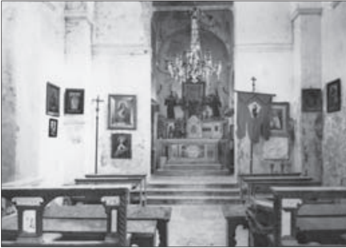
SL. 9. SVETIŠTE CRKVE SV. MARIJE NA MLJETU PRIJE OBNOVE FIG. 9 CHURCH OF ST. MARY, MLJET, CHANCEL, PRIOR TO RESTORATION