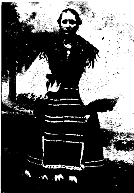
Slika 3. Djevojka iz Koške. Snimljeno 1915.

Djevojke su nosile dugačku kosu spletnu u pletenice i složenu na različite načine, u cop ili knedlu i kobasicu . (Sl. 2 i 3)