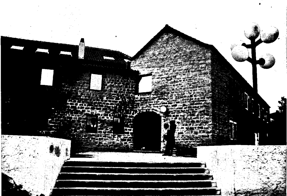
Slika 6: Dječji vrtić u Supetru na Braču

Regionalistički projekt dječjeg vrtića u Supetru na otoku Braču nastao je s namjerom da se oživi tipična arhitektura mediteranskog područja. Zato je kući nametnut kosi krov, pokrov od zaobljenih opeka i kameni zid. Ali autor je kameni zid vezao uz male otvore i budući da nije želio napustiti odnos kameni zid - mali otvori, kuća je ostala zaobljena u zidu. Tako dječji vrtić nije mogao dobiti pogodnosti otvaranja prema okolini, koje je moderna arhitektura razvila, i koje s lakoćom rješava. (Slika 6)