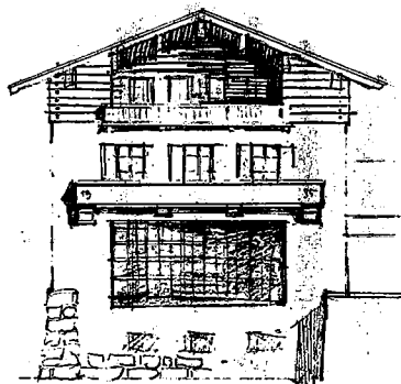
Slika 3: Hitlerov projekt i izgrađena vila u Obersalzbergu

Novokomponirana arhitektura je, kao i novokomponirana glazba, sociološka činjenica. Sociologija kulture mogla bi objasniti dublje razloge nastajanja, podlogu za širenje, ulogu obrazovanja i rasprostranjenost tih fenomena. U estetskom pogledu za nas je interesantniji pad i gubitak prostornih vrijednosti na račun površne slikovitosti. Prostorne vrijednosti izvornog folkloru gube se kod epigona. U novokomponiranom stvaranju vladaju principi u kojima gotovi, preuzeti i kompilirani predlošci pobuđuju nostalgijna raspoloženja. Originalno strukturiranje djela, drugačija građa ili umjetnička ideja mogu samo poremetiti površno kompiliranje.