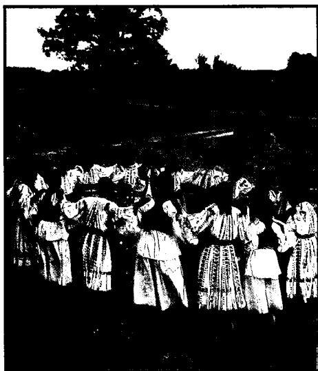
Djevojčice i dječaci iz podunavske Baranje.