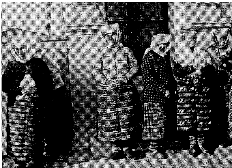
10. Žene u starinskom oglavlju, Baranjsko Petrovo Selo. Snimljeno 1938.