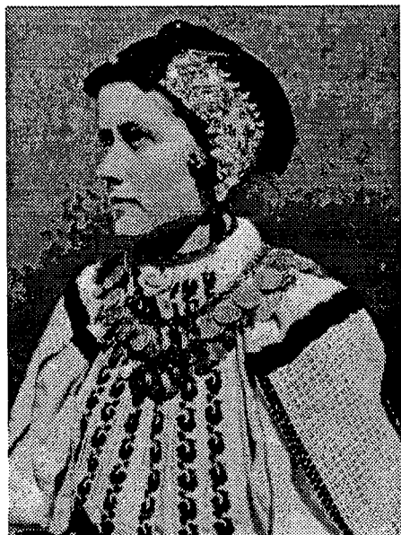
11. Djevojka počušljana u pletenicu, Duboševica. Snimio Milan Pavić, 1951. Agencija za fotodokumentaciju, Zagreb.