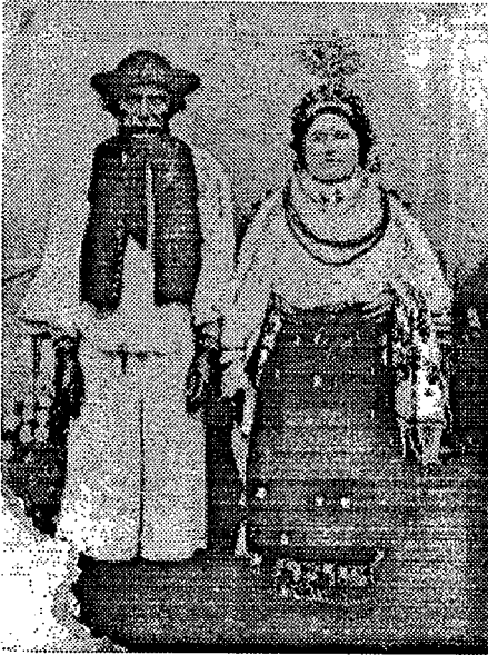
1. Narodna nošnja, Duboševica. Snimljeno oko 1920.