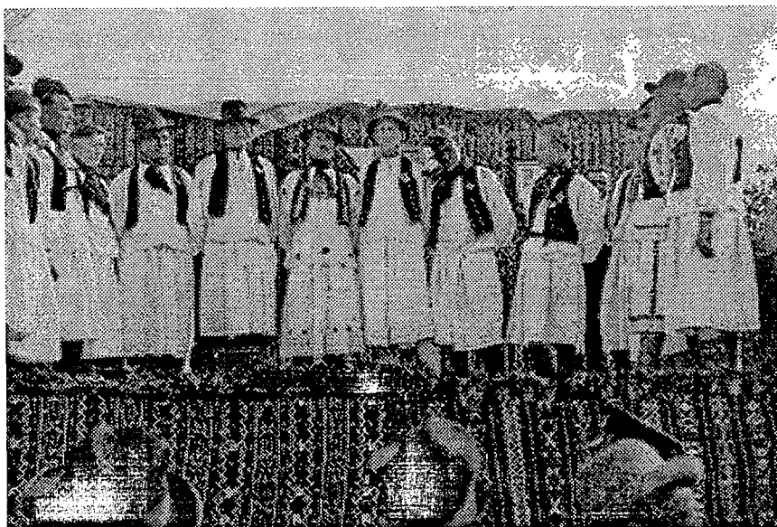
5. Muškarci iz Branjinog Vrha snimljeni na Smotri Seljačke sloge u Gajiću 1939.