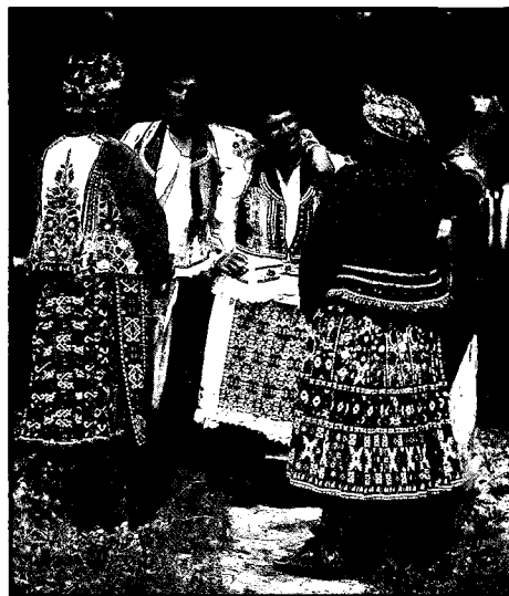
Muškarci u pregači i žene u zimskom ruhu