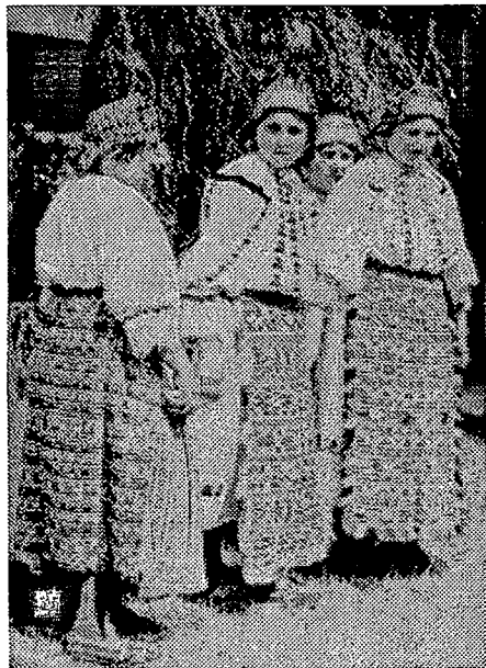
4. Žene iz Draža na Smotri Seljačke sloge u Zagrebu 1939.