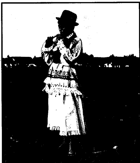
Dječak svečano odjeven, Draž.