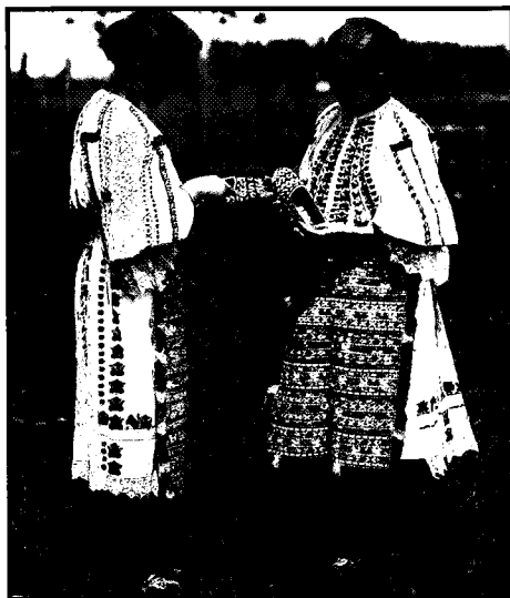
Djevojčice u narodnoj nošnji, podunavska Baranja.