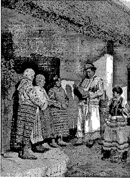
6. Muškarac i dječak u svečanoj odjeći s grupom žena, Draž. Snimio Damir Klasiček, 1973.