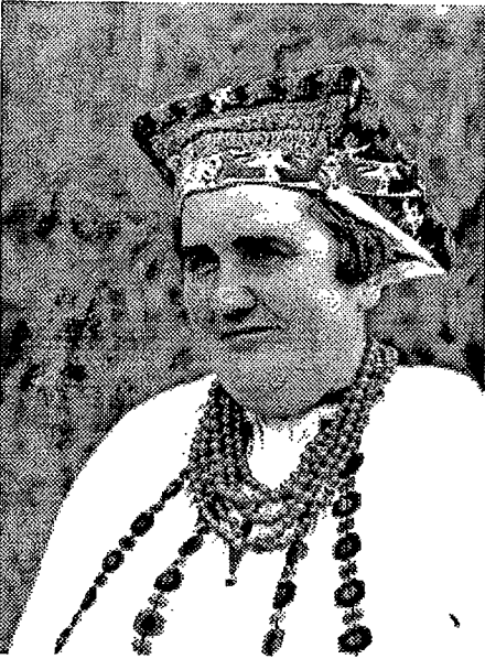
8. Žena s kpicom znakovitim za podravsku Baranju, Baranjsko Petrovo Selo. Snimio Damir Klasiček, 1973.