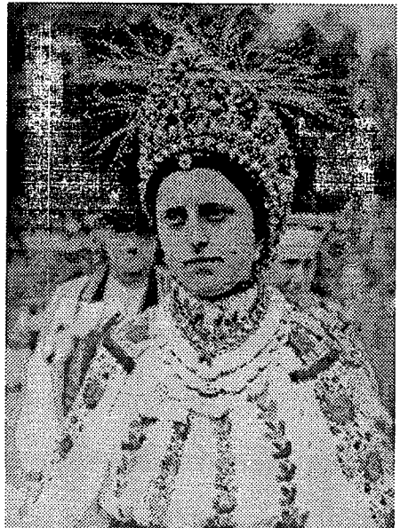
9. Djevojka u svečanom oglavlju, Baranjsko Petrovo Selo. Snimljeno na Smotri Seljačke sloge u Zagrebu, 1935.