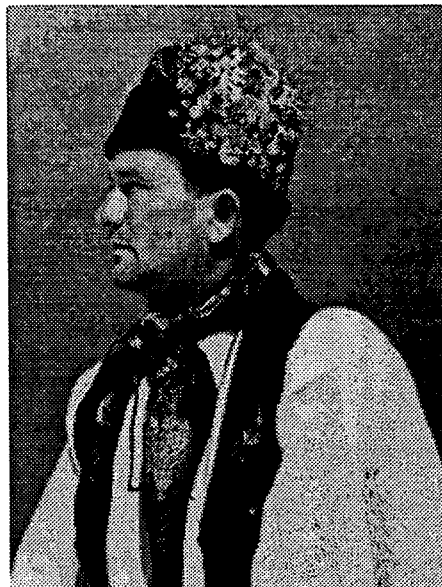
12. Svečano odjeven muškarac, Duboševica. Snimio Milan Pavić, 1951. Agencija za fotodokumentaciju, Zagreb.