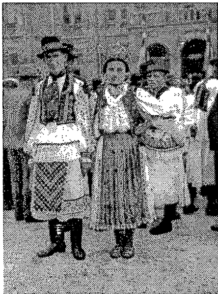
3. Muškarci žena u svečanom ruhu, Baranjsko Petrovo Selo. Snimljeno na Smotri Seljačke sloge u Zagrebu 1935.