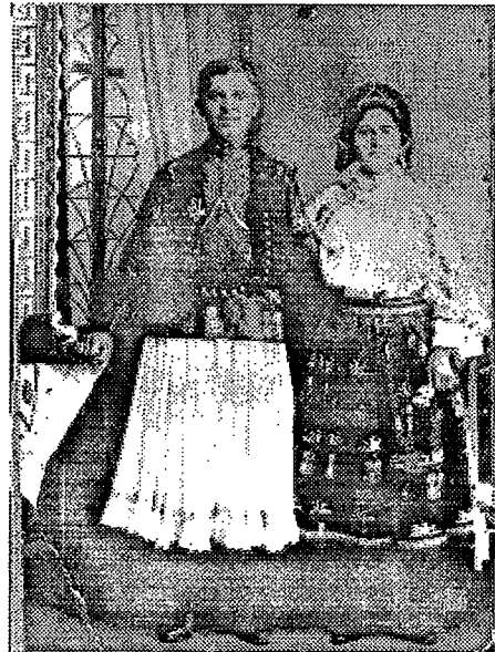
2. Muškarac i žena u svečanom ruhu, Duboševica. Snimljeno 1919. ili 1920.