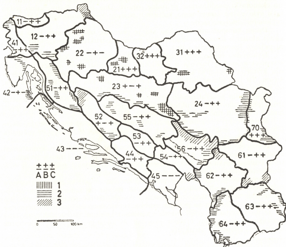
Sl. 1. Načrt II stupnja homogene regionalizacije Jugoslavije

Složena historijsko-geografska stvarnost jugoslavenskog prostora osobi- to ističe važnost spoznaje kontinuiteta društvenog ekonomskog razvoja, For- miranje tipova današnjih kulturnih pejzaža, osim najmlađih formi i pojava, rezultat je različitih historijsko geografskih perioda. Njihovo formiranje se najpregnatije može spoznati primjenom retrogradne historijsko-geograf- ske metode. Tako na primjer prave panonske vojvođanske ravnice i (pre-