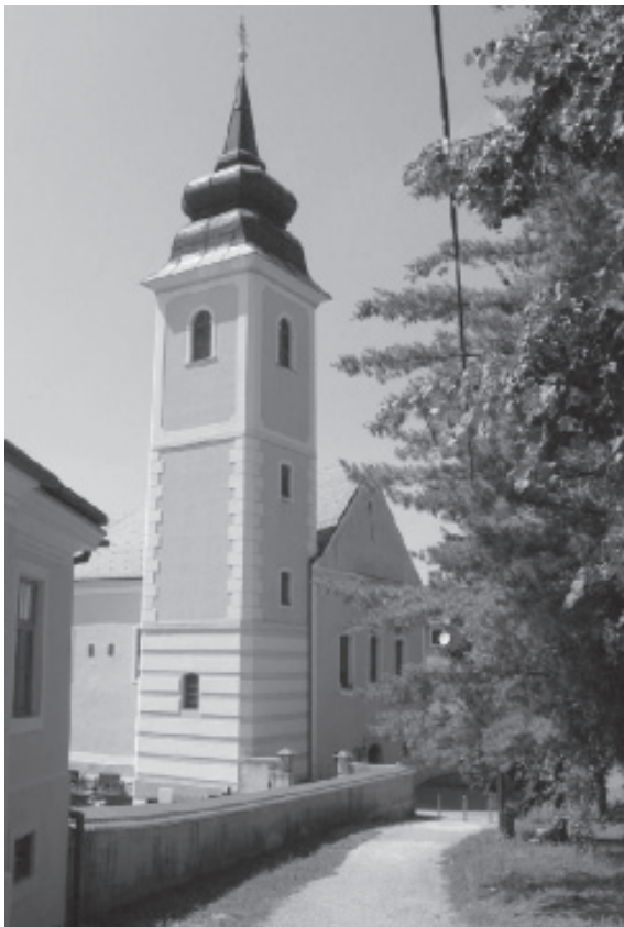
Slika 1. Župna crkva Blažene Djevice Marije od Pohođenja u Mariji Gorici 31

strmome brijegu. Unutrašnjost crkve je rekonstruirana te je postala jednobrodna, s prezidanom sakristijom na sjevernoj i visokim tornjem na južnoj strani. Toranj zvonika ima tri kata, a visok je 41 metar. Barokni utjecaj očituje se u ukrašenim nadstrešnicama prozora te u obliku portala s klesanim dovratnikom na čijem je zaglavnom kamenu uklesana godina svršetka gradnje (1758. godine). Bio je to posljednji veći graditeljski zahvat na crkvi sve do danas.