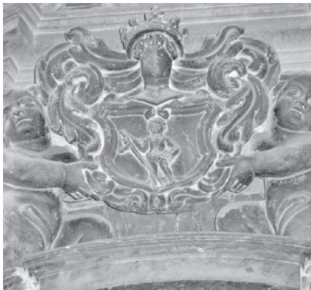
Slika 2. Grb obitelji Rauch na glavnom oltaru