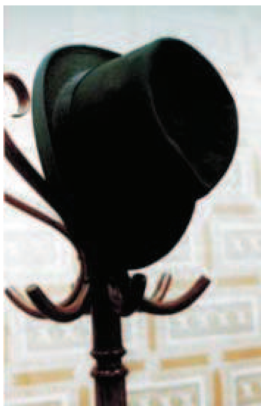
Slika 3. Cilindar F. M. Dostojevskog

se piščevih stanova u gradu, kao i adrese likova iz romana čija se radnja zbiva