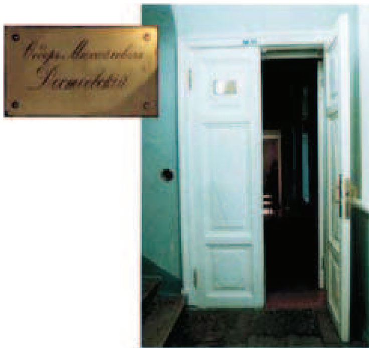
Slika 1. Ulazna vrata stana Dostojevskog

U Blagovaonici se cijela obitelj u 6 sati uvečer okupljala. Dostojevski je često pozivao prijatelje da večeraju s njegovom obitelji. Volio je primati goste u svojem domu. Vrući samovar uvijek se ostavljao za njega u blagovaonici – dok je radio, često je pio čaj koji bi sam pripremio. Dostojevski je često pozivao goste i primao ih u Dnevnoj sobi . Dok je živio u tom stanu, već je bio slavan pisac. Posjećivali su