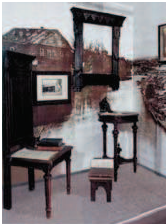
Slika 4. Detalj stalnog postava romana Braća Karamazovi

Deset je godina Dostojevski bio istrgnut iz normalnoga života i doslovce nije mogao pisati: najprije je bio u samici u