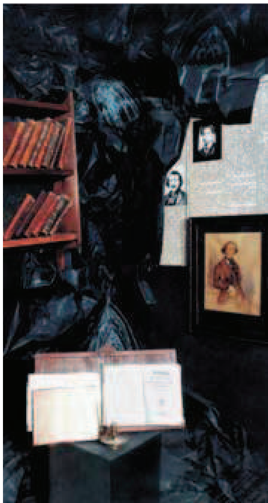
Slika 3. Detalj postava romana Bjesovi

u tom gradu. Tijekom svojega života u Sankt Peterburgu Dostojevski je promijenio 20 adresa. Gotovo svi njegovi stanovi nalazili su se na uglu zgrada na raskrižju.